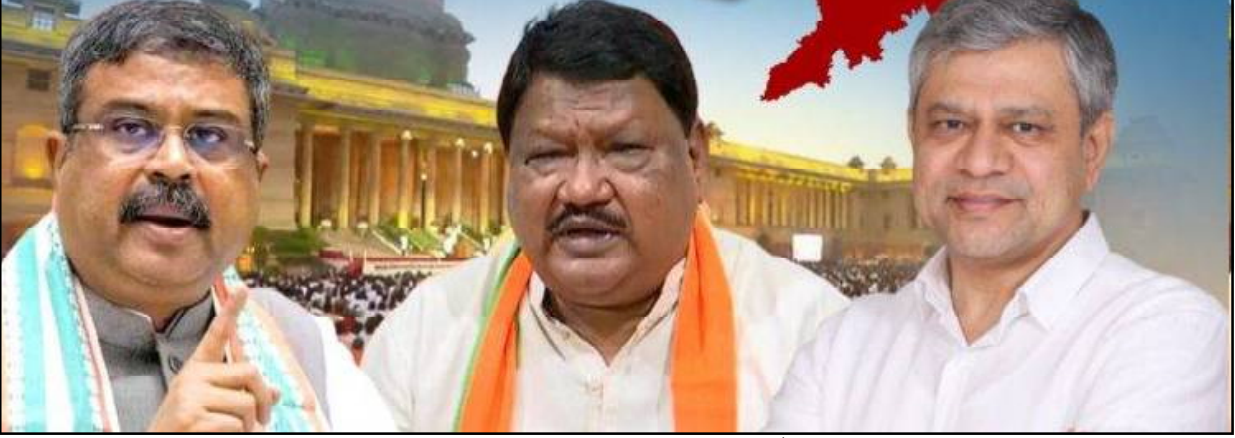
■ ଓଡ଼ିଶାରୁ କ୍ୟାବିନେଟ୍‌ରେ ସ୍ଥାନ ପାଇଲେ ଧର୍ମେନ୍ଦ୍ର, ଭୁଞ୍ଜଳ ସହିତ ଅଶ୍ୱିନୀ