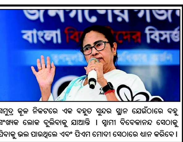
ସମୁଦ୍ର କୁଳ ନିକଟରେ ଏକ ବହୁତ ସୁନ୍ଦର ସ୍ଥାନ ଯେଉଁଠାରେ ବହୁ ସଂଖ୍ୟକ ଲୋକ ସୁଲିବାକୁ ଯାଆନ୍ତି । ସ୍ୱାମୀ ବିବେକାନନ୍ଦ ସେଠାକୁ ଯିବାକୁ ଭଲ ପାଉଥିଲେ ଏବଂ ପିତୃମତା ସେଠାରେ ଧ୍ୟାନ କରିବେ ।

ଯେହିପରି କାରି ରହିବ । ସେ କହିଥିଲେ ଯେ ଆପଣ ଜୁନ୍ ୪ରେ ରହିବେ ନାହିଁ । ଏହା ବ୍ୟତୀତ ଲୋକସଭା ନିର୍ବାଚନ ଶେଷ ହେବା ପରେ ପ୍ରଧାନମନ୍ତ୍ରୀ ନରେନ୍ଦ୍ର ମୋଦି ଚାମିଲନାହୁଁ କନ୍ୟାକୁମାରୀରେ ଦୁଇ ଦିନ ଧ୍ୟାନ କରିବେ ବୋଲି ମଧ୍ୟ ଖବର ରହିଛି । ମମତା ସାଧାରଣ ସଭାରେ କହିଥିଲେ ଯେ ସେ ଧ୍ୟାନ କରିବେ କିନ୍ତୁ କ୍ୟାମେରା ଆଗରେ । ପ୍ରତ୍ୟେକ ଥର ଆପଣ ଦେଖିବେ ଯେ ଶେଷ ପର୍ଯ୍ୟାୟ ନିର୍ବାଚନର ୪୮ ଘଂଟା ପୂର୍ବରୁ, ସେମାନେ ଯାଇ କୌଣସି ସ୍ଥାନକୁ ଲୁଚି ରହି ଲୋକଙ୍କୁ ଧ୍ୟାନ ଦେଉଛନ୍ତି ହେଲେ କୁହନ୍ତି । କନ୍ୟାକୁମାରୀ ବିଷୟରେ ଉଲ୍ଲେଖ କରି ମମତା କହିଛନ୍ତି ଯେ ଏହା