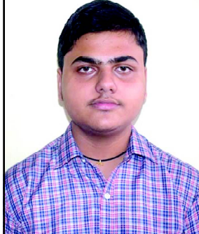
୫୬୦ ନମ୍ବର ରଖି ବାଲେଶ୍ୱର ଜିଲ୍ଲାର ଚତୁର୍ଥ ହୋଇପାରିଛନ୍ତି ।