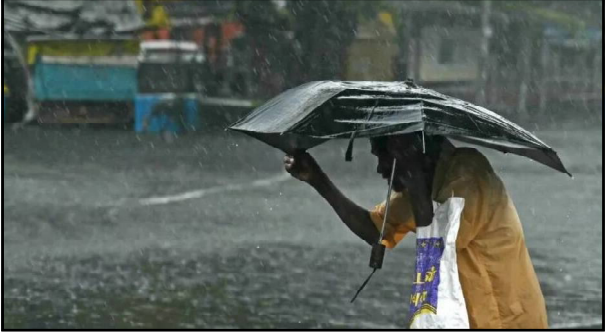
ଏହାକୁ ମୋନସୁନ ହୋଇ ଅଧିକ ଘନୀଭୂତ ହୋଇ ୨୪ ତାରିଖରେ ଅବପାତ ରୂପ ନେବାର ସମ୍ଭାବନା ରହିଛି ।

ଭୁବନେଶ୍ୱର, ୧୮/୫ (ନି.ପ୍ର): ରାଜ୍ୟବାସୀଙ୍କ ଚାଟିରୁ ମିଳିବ ଆଶ୍ୱସ୍ତି । ୨୨ ତାରିଖରେ ଦକ୍ଷିଣ ପଶ୍ଚିମ ବଙ୍ଗୋପସାଗରରେ ଏକ ଲଘୁଚାପ କ୍ଷେତ୍ର ସୃଷ୍ଟି ହେବାର ସମ୍ଭାବନା ରହିଛି । ଏନେଇ ଭୁବନେଶ୍ୱର ଆଞ୍ଚଳିକ ପାଣିପାଗ କେନ୍ଦ୍ର ପକ୍ଷରୁ ବିତ୍ କରି ସୂଚନା ଦିଆଯାଇଛି । ପାଣିପାଗ କେନ୍ଦ୍ରର ସୂଚନା ଅନୁସାରେ, ଦକ୍ଷିଣ ପଶ୍ଚିମ ବଙ୍ଗୋପସାଗରରେ ଏକ ଲଘୁଚାପ କ୍ଷେତ୍ର ସୃଷ୍ଟି ସମ୍ଭାବନା ରହିଛି ।