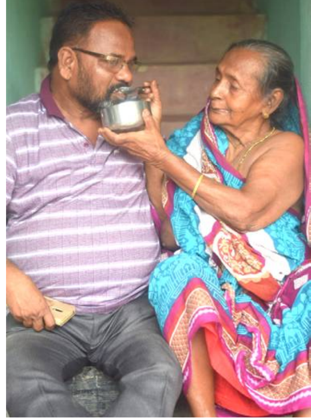
ମା'ଙ୍କ ସହ କବି...

କବିତାରେ କାହାର ମାନସିକତା ପରିବର୍ତ୍ତନ ସଂଭବ । କବିତା ବହୁତେ ମାନସ ବ୍ୟାପାର । ତେଣୁ ସଂଭବ ହେବନି କେମିତି ! ତେବେ କବିତାର ସେଭଳି ଶକ୍ତି ଓ ସାମର୍ଥ୍ୟ ଥିବା ଦରକାର । ବହୁକୁ ନିଜ ହୃଦୟରେ ଥିବା ଦେବତାକୁ ଚିହ୍ନିବାହେବ ।