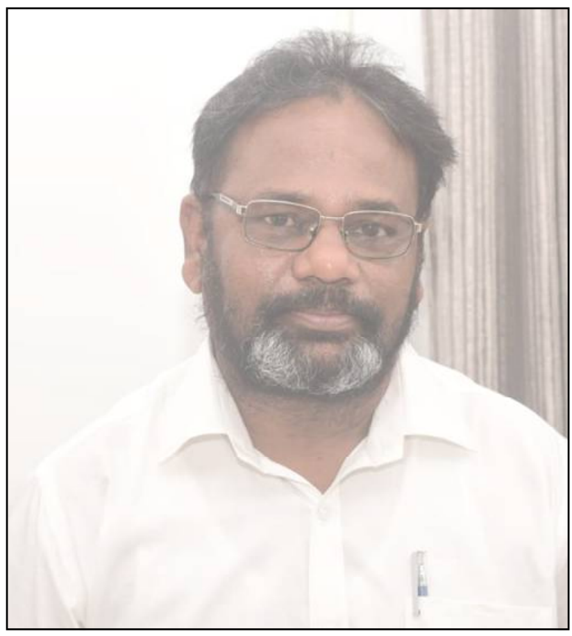
ରକ୍ଷକ ନାୟକଙ୍କୁ ବହୁତ ଜ୍ଞାନ ପାଇଛି । ତାଙ୍କୁ ଘଟା ଘଟା ଶୁଣିଛି ।