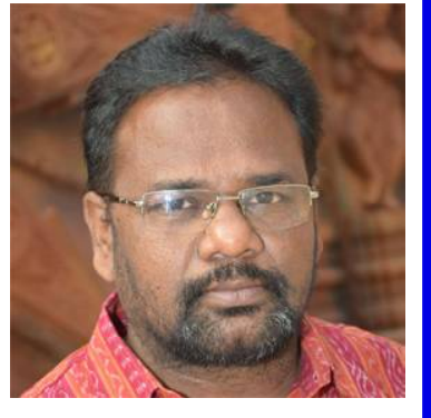
୧୩. କେତେବେଳେ କୋଉଥା (୨୦୨୩) ଗଳ୍ପ ସଂକଳନ ୧୪. କହିଲେ ନସରେ (୨୦୨୪) କବିତା, ୧୫. ସବ ବନ୍ଦରଗାହେଁ ମୋ ସ୍ୱାଗତମ୍ (୨୦୧୭) ହିନ୍ଦୀ ଅନୁବାଦ (ଡଃ.ଶଙ୍କର ଲାଲ ପୁରୋହିତ) କବିତା

■ ପ୍ରକାଶିତ ପୁସ୍ତକ : କବିତା ୧. ଉର୍ଦ୍ଧ୍ୱ ଉଡ଼ାଣ (୨୦୦୦) କବିତା ୨. ବ୍ରହ୍ମଶିଳା (୨୦୦୩) କବିତା ୩. ବୀଳ ବିକ୍ଷେପ (୨୦୦୭) କବିତା ୪. ଅସରନ୍ତି ଅଗାଧରା (୨୦୧୧) କବିତା ୫. ଆଉ ସବୁ ସାକ୍ଷାତରେ (୨୦୧୪) କବିତା ୬. ଅନୁଷ୍ଠା ଅହର୍ଦ୍ଦିଶ (୨୦୧୫) କବିତା ୭. ଅର୍ଚ୍ଚିତ ଅନର୍ଚ୍ଚିତ (୨୦୧୬) କବିତା ୮. ଶେଷହୀନ ସଂତରଣ (୨୦୧୯) କବିତା ୯. ଅମିତ୍ର ଅନ୍ଧାର (୨୦୧୯) କବିତା ୧୦. ବିସ୍ମୟାନ (୨୦୨୦) କବିତା ୧୧. ଘରକୁ ଫେରିବାକୁ ତର (୨୦୨୧) କବିତା ୧୨. ନାନାଦି ନିରବତା, (୨୦୨୨) କବିତା