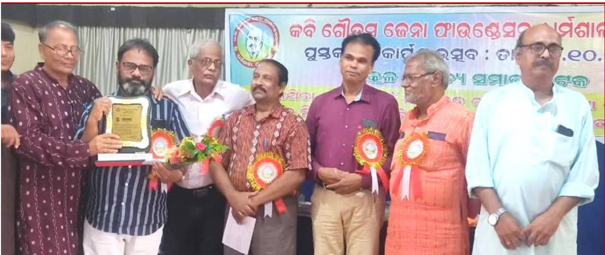
ସମ୍ବଳିତ ହେବାର ବିରଳ ମୁହୂର୍ତ୍ତ ।