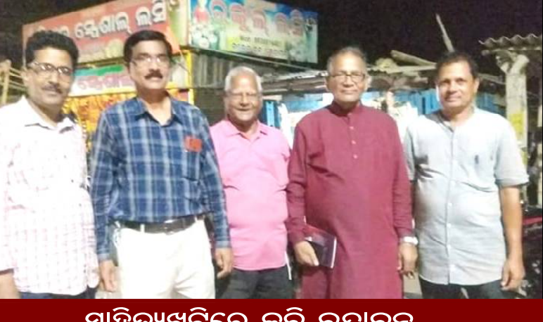
ସାହିତ୍ୟଖଟିରେ କବି ବୃନ୍ଦାବନ...