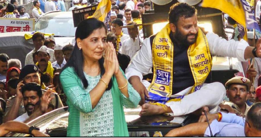
ପ୍ରଚାର କରିଛନ୍ତି। ସେ କହିଛନ୍ତି, 'ଆପଣଙ୍କ ମୁଖ୍ୟମନ୍ତ୍ରୀ ଯୋଗ୍ୟ ଅରବିନ୍ଦ କେନ୍ଦ୍ରୀୟ ମନ୍ତ୍ରୀ ମାଧ୍ୟମରେ ହେଲେ ଭୋଟରଙ୍କୁ ଯୋଗ୍ୟ କରିବାକୁ ସମର୍ଥନ ଦେବାକୁ ଚାହୁଁଛୁ।' >>>ପୃଷ୍ଠା ୭

ନୂଆଦିଲ୍ଲୀ, ୨୭/୪ : ଅବକାରୀ ନୀତି ଦୁର୍ନୀତି ମାମଲାରେ ଜେଲରେ ଥିବା ଦିଲ୍ଲୀ ମୁଖ୍ୟମନ୍ତ୍ରୀ ଅରବିନ୍ଦ କେନ୍ଦ୍ରୀୟ ମନ୍ତ୍ରୀ ସୁବ୍ରତା ଆଜି ପ୍ରଥମଥର ପାଇଁ କୌଣସି ନିର୍ବାଚନ ପାଇଁ ପ୍ରଚାର କରିଛନ୍ତି। ସେ ଆଜି ପୂର୍ବ ଦିଲ୍ଲୀରେ ବିଶାଳ ରୋଡ୍ ଶୋ' କରି ଆଉ ପାଇଁ ଭୋଟ ମାଗିଛନ୍ତି। ଏହି ରୋଡ୍ ଶୋ' ସମୟରେ ସେ ପୂର୍ବ ଦିଲ୍ଲୀର କୋଷଳିରେ ଦଳୀୟ କର୍ମୀଙ୍କ ସହ ମଧ୍ୟ ଆଲୋଚନା କରିଛନ୍ତି। ଗୋଟିଏ ଗାଡ଼ି ଉପରେ ଛିଡ଼ା ହୋଇ ସେ କୋଷଳି ଅଞ୍ଚଳରେ ଭୋଟରଙ୍କୁ ହାତ ଯୋଡ଼ି ଭୋଟ ମାଗିଛନ୍ତି। କେନ୍ଦ୍ରୀୟ ଜେଲରେ ଥିବାରୁ ଆଉ ତାଙ୍କ ପତ୍ନୀଙ୍କୁ ପ୍ରଚାର ମୈଦାନକୁ ଓହ୍ଲାଇଛି। ଏହିକ୍ରମରେ ଆଜି ସେ ରୋଡ୍ ଶୋ' କରିବା ସହ ଆପଣ