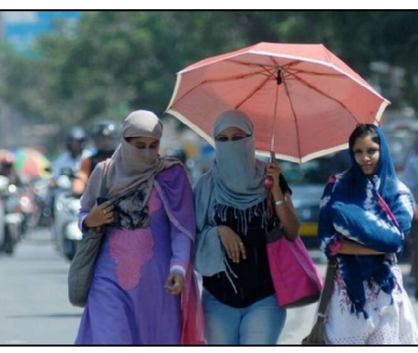
ବାରିପଦାରେ ୪୪.୨ ଡିଗ୍ରୀ, ବୌଦ୍ଧରେ ୪୩.୭ ଡିଗ୍ରୀ, ତେଜାନାଳରେ ୪୩.୭ ଡିଗ୍ରୀ, ଭବାନୀପାଟଣାରେ ୪୩.୭ ଡିଗ୍ରୀ, ନୂଆପଡ଼ାରେ ୪୩.୬ ଡିଗ୍ରୀ, ଝାରସୁଗୁଡ଼ାରେ ୪୩.୬ ଡିଗ୍ରୀ, >>>ପୃଷ୍ଠା ୭

ଭୁବନେଶ୍ୱର, ୨୭/୦୪ (ନି.ପ୍ର): ତାତିରେ ରେକର୍ଡ କଲା ଶିଶୁ ନଗରୀ ଅନୁଗୋଳ। ତା' ତଳକୁ ଅଛି ରାଜଧାନୀ ଭୁବନେଶ୍ୱର। ଆଜି ଅନୁଗୋଳରେ ସର୍ବାଧିକ ଚାପମାତ୍ରା ୪୪.୭ ଡିଗ୍ରୀ ରେକର୍ଡ କରାଯାଇଥିବା ବେଳେ ଭୁବନେଶ୍ୱରରେ ୪୪.୬ ଡିଗ୍ରୀ ଭୁବନେଶ୍ୱରରେ ୪୪.୬ ଡିଗ୍ରୀ ଭୁବନେଶ୍ୱର ଆଞ୍ଚଳିକ ପାଣିପାଗ କେନ୍ଦ୍ର ସମ୍ବଳ ଏନେଇ ସୂଚନା ଦିଆଯାଇଛି। ଭୁବନେଶ୍ୱର ଆଞ୍ଚଳିକ ପାଣିପାଗ କେନ୍ଦ୍ର କାରି କରିଥିବା ବୁଲେଟିନ୍ ଅନୁସାରେ