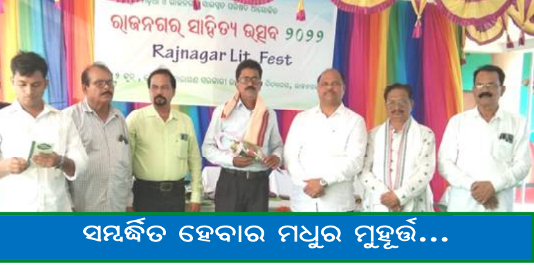
ସମ୍ପର୍କିତ ହେବାର ମଧୁର ମୁହୂର୍ତ୍ତ...