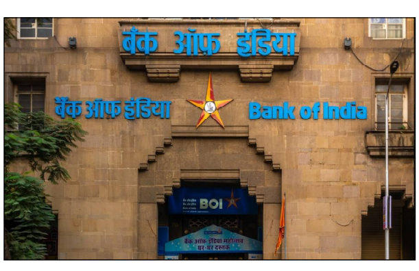
ଡିଏମଏଫ୍ । ଖଣି ଅଞ୍ଚଳର ବିକାଶ କରିବା ପାଇଁ ଏହି ଫଣ୍ଡ ଗଠନ କରାଯାଇଥିଲା । ଏହାର ଆକାର ୫ କୋଟିରୁ ଅଧିକ ଟଙ୍କା ବାରିପଦା ଟାଉନରେ ଥିବା ବ୍ୟାଙ୍କ

ବାରିପଦା, ୨୧/୪ (ନି.ପ୍ର): ଖଣି ଅଞ୍ଚଳର ବିକାଶ ପାଇଁ ଗଠନ ହୋଇଥିଲା ଡିଏମଏଫ୍ ଫଣ୍ଡ । ଆଜି ସେଥିରୁ ୯ କୋଟିରୁ ଅଧିକ ଟଙ୍କା ହତ୍ୟୁ ହୋଇଛି । ୪ଟି ଟେକ୍ ଦେଇ ବ୍ୟାଙ୍କକୁ ଟୁନା ଲଗାଇଦେଲେ ନେଇ ହରତ ଘଣାରେ ପଡ଼ିଛନ୍ତି ବ୍ୟାଙ୍କ ଅଫ୍ ଇଣ୍ଡିଆର ବାରିପଦା ଶାଖା କର୍ତ୍ତୃପକ୍ଷ । ଟଙ୍କା ହତ୍ୟୁ ହୋଇଥିବା ଜାଣି ବ୍ୟାଙ୍କ କର୍ତ୍ତୃପକ୍ଷ ଆଜି ଆନାରେ ଲିଖିତ ଅଭିଯୋଗ କରିଛନ୍ତି । ମୟୂରଭଞ୍ଜ ପିଡି ଡିଆରଡିଏ ଅଧୀନରେ ରହିଛି