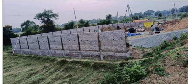
ଅର୍ଥ ବ୍ୟବସ୍ଥା କରାଯାଇଥିଲା । ଏହି ପ୍ରକଳ୍ପ ନିର୍ମାଣ ଦାୟିତ୍ୱରେ ଥିବା କମ୍ପାନୀ ନିଜେ ସମସ୍ତ କାର୍ଯ୍ୟ ନକରି ଯେଉଁ ଠିକାଦାରଙ୍କୁ କାର୍ଯ୍ୟ ନ କରିଥିଲେ । ଏଥିରେ ଉକ୍ତ ଯେଉଁ ଠିକାଦାର ମାନେ ନିମ୍ନମାନର ଚିମ୍ଫ, ଭତ, ଭଟା, ବାଲି, ପାଦପ ବ୍ୟବହାର କରିବା ଏବଂ ନିର୍ମାଣପରେ ପାଣିଠିକ ଭାବେ ନଦେଇ ଅର୍ଥ ବାଟେରୀର କରୁଥିବା ସ୍ଥାନୀୟ ଗ୍ରାମବାସୀ ମାନେ ଅଭିଯୋଗ କରିଛନ୍ତି । ଏ ସମ୍ପର୍କରେ ଯତ୍ନ ଅଳୟ ବେହେରାଙ୍କୁ ଯୋଗାଯୋଗ କରିଥିବାବେଳେ ସେ କାମ ଠିକଠାକ କରିବାକୁ ଠିକାଦାରଙ୍କୁ ବାରମ୍ବାର କହୁଥିବା କହିଛନ୍ତି ।

ଖଇରା, ୨୧/୪ (ନି.ପ୍ର): ବାଲେଶ୍ୱର ଜିଲ୍ଲା ଖଇରା ବ୍ଲକ ଅଧୀନ ବାଟେରୀ ସଂଳଗୁ ବାଟେରୀରେ ପାଣିଚାଳି ପାଟେରୀ ନିର୍ମାଣ କାର୍ଯ୍ୟରେ ବ୍ୟୟକ ଅନିୟମିତତା ହୋଇଥିବା ଅଭିଯୋଗ ହୋଇଛି । ନିମ୍ନମାନର କାମାଳ ବ୍ୟବହାର କରି ୧୬ଲକ୍ଷ ଟଙ୍କା କରିନେଇଥିବା ଅଭିଯୋଗ ହୋଇଛି । ପାହାଚପାଦବେଶରେ ଥିବା ୬୮୦ ଯତର ପାନାୟକ ବ୍ୟବସ୍ଥାକୁ ବ୍ୟବସ୍ଥିତ କରିବା ଲାଗି ପାଖାପାଖି ୧୦୦କୋଟି ଟଙ୍କା ପ୍ରଦାନ କରାଯାଇଥିଲା । ଏହି ଅର୍ଥ ମଧ୍ୟରେ ପାଦପବିକା, ପାଣିଚାଳି, ପୁରୁଷା ପାଟେରୀ ନିର୍ମାଣ ଲାଗି ସ୍ୱତନ୍ତ୍ର ଭାବେ