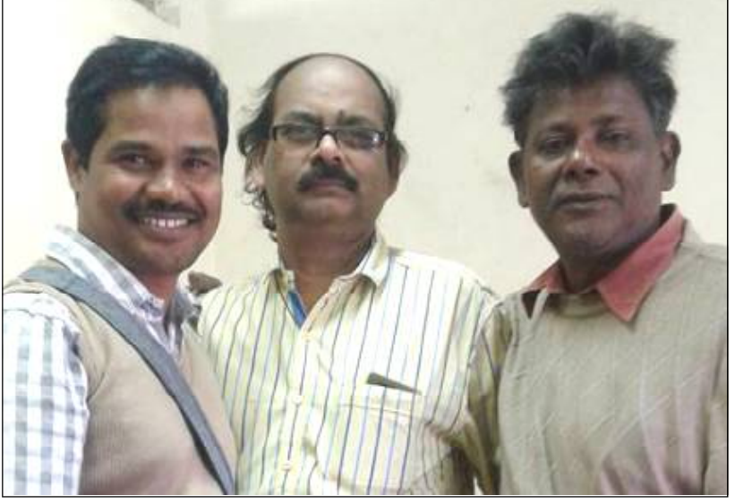
ପ୍ରିୟ ବଂଧୁମାନଙ୍କ ଗହଣରେ କବି ଶ୍ରୀଦେବ ...