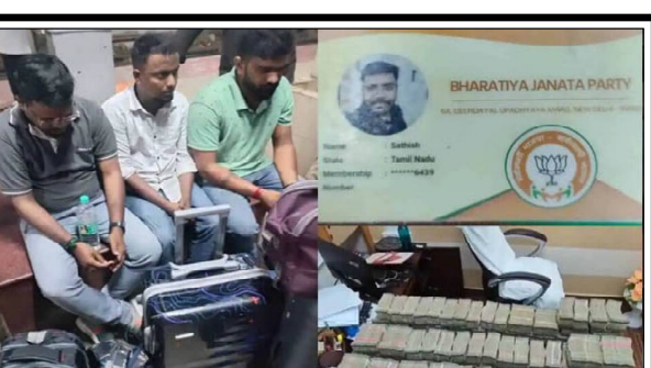
ନେତାମାନେ ଜୋରସାରରେ ଲାଗିପଡ଼ିଛନ୍ତି। ଉଠୁଛୁ ପଢୁଛି ପ୍ରଚାର ନୈବାନ। ୧୯ ତାରିଖରେ ଭୋଟିଂ ପରେ କୁଟ୍ ୪ ତାରିଖରେ ଫଳାଫଳ ଘୋଷଣା ହେବ।