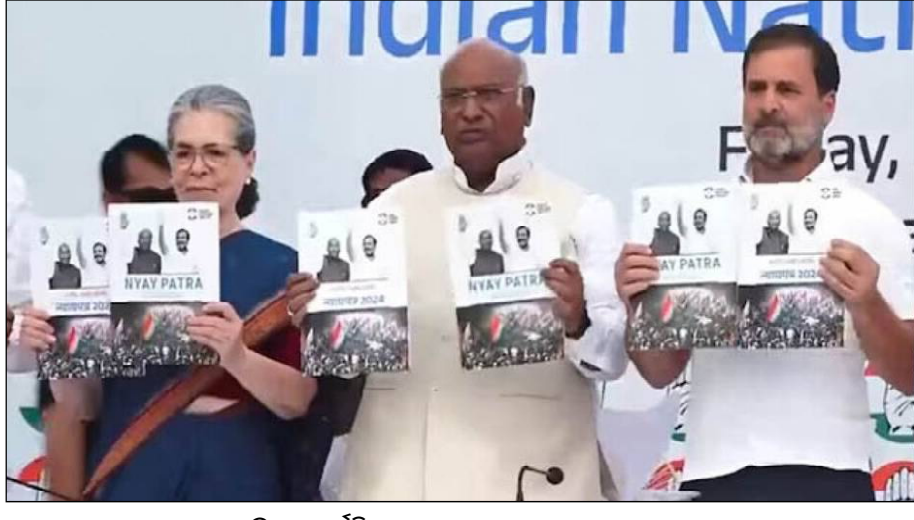
ସଂରକ୍ଷଣ ଦେବାକୁ କଂଗ୍ରେସ ନିଜ ନ୍ୟାୟ ପତ୍ରରେ କହିଛି । କେବଳ ସେତିକି ନୁହେଁ ସଂରକ୍ଷଣ ସାମାଜିକ, ଜାତିଗତ ଜନଗଣଙ୍କୁ ଦେଖାଇ, ଗଣ ଛାଡ଼ି ନାହିଁ । ସର୍ବନିମ୍ନ ମଜୁରୀ ୪୦୦, ୪୦୦ ଲକ୍ଷ ସରକାରୀ ଚାକିରି, ଗରିବ ମହିଳାଙ୍କୁ ୧ ଲକ୍ଷ ଟଙ୍କା ସହାୟତା, ତାଲିମ ପାଇଁ ୧ ଲକ୍ଷ ଟଙ୍କା, ସହରୀ ନିୟୁତ୍ତ ଗ୍ୟାରେଣ୍ଟି ଯୋଜନା ଆଣିବାକୁ ପ୍ରତିଶ୍ରୁତି ଦିଆଯାଇଛି ।

ନୂଆଦିଲ୍ଲୀ, ୦୫/୪ : ପାଖେଇ ଆସିଲାଣି ଲୋକସଭା ନିର୍ବାଚନ । ଏହାପୂର୍ବରୁ କଂଗ୍ରେସ ଜାରି କରିଛି ତା'ର ଯୋଷଣା ପତ୍ର । ଏହାକୁ ସେ 'ନ୍ୟାୟ ପତ୍ର' ନାଁ ଦେଇଛି । ଏହି ନ୍ୟାୟ ପତ୍ରରେ ରହିଛି ୫ ନ୍ୟାୟ ଓ ୨୫ ଗ୍ୟାରେଣ୍ଟି । କଂଗ୍ରେସ ମୁଖ୍ୟ କାର୍ଯ୍ୟକ୍ରମରେ ଦଳର ଅଧ୍ୟକ୍ଷ ମଲ୍ଲିକାର୍ଜୁନ ଖଡ଼ଗେ ଏବଂ ପୂର୍ବତନ ଅଧ୍ୟକ୍ଷ ସୋନିଆ ଗାନ୍ଧି ଏବଂ ରାହୁଲ ଗାନ୍ଧି ଏହି ଯୋଷଣା ପତ୍ରକୁ ପ୍ରକାଶ କରିଛନ୍ତି । କଂଗ୍ରେସ ଏହି ଯୋଷଣା ପତ୍ର ମାଧ୍ୟମରେ ଜନସାଧାରଣଙ୍କୁ ୨୫ଟି ପ୍ରତିଶ୍ରୁତି ତଥା ଗ୍ୟାରେଣ୍ଟି ଦେଇଛି । ଗରିବ ପରିବାରର ମହିଳାମାନଙ୍କୁ ବାର୍ଷିକ ୧ ଲକ୍ଷ ଟଙ୍କା ସହାୟତା ପାଇଁ ପ୍ରତିଶ୍ରୁତି ଦିଆଯାଇଛି । ଏଥି ସହିତ, ୨୦୨୫ ସୁଦ୍ଧା ସରକାରୀ ଚାକିରିରେ ମହିଳାମାନଙ୍କୁ ୫୦ ପ୍ରତିଶତ