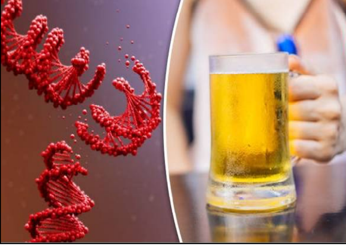
ଦୈନନ୍ଦିନ ଜୀବନରେ କେତେକ ଖାଦ୍ୟାଭାସ ଦ୍ୱାରା ଶରୀର ଉପରେ ନକାରାତ୍ମକ ପ୍ରଭାବ ପଡ଼ିଥାଏ । ନିୟମିତ ମଦ୍ୟପାନ କଲେ, ଏହା କୋଷ୍ଠରେ ଥିବା ଡିଏନ୍ଏ

ସଂରଚନାକୁ ବିଶ୍ୱାଙ୍ଗିତ କରେ । ଏହାଯୋଗୁ କର୍ଚ୍ଚତ ରୋଗ ବୃଦ୍ଧି ହୋଇଥାଏ ବୋଲି ଗବେଷକ ସୂଚିତ କରିଛନ୍ତି । ସୁରାସାର ଜିନିଷ ସଂରଚନାକୁ ସମ୍ପୂର୍ଣ୍ଣ ନଷ୍ଟ କରି ଦେଇଥାଏ । ତେଣୁ ଜୀବନଶୈଳୀରେ ନିୟମିତ ମଦ୍ୟପାନ ନ କରିବା ଉଚିତ ବୋଲି ଗବେଷକ ସୂଚିତ କରିଛନ୍ତି । ଏହା ଶରୀରରେ ଏସିଡିକାଭିଡିଆଇଟ୍ ପ୍ରସ୍ତୁତ କରେ । ଯାହାକି ଜିନରେ ପରିବର୍ତ୍ତନ ଆଣିଥାଏ । ଏହାର ପ୍ରଭାବରେ ଡିଏନ୍ଏ ସଂରଚନାରେ ପରିବର୍ତ୍ତନ ଆସିଥାଏ । ସୁରାସାର ଦ୍ୱାରା ସ୍ତନକର୍ଚ୍ଚତ ଓ ପାଚକଯନ୍ତ୍ର କର୍ଚ୍ଚତ ସମେତ ୭ ପ୍ରକାର କର୍ଚ୍ଚତ ରୋଗ ବୃଦ୍ଧି ହୋଇଥାଏ । ସୁରାସାର ଆଲକହୋଲିକ୍ ହଜାଇଡ୍ରୋଜେନେଟ୍ ଏଞ୍ଜାଇମ୍‌ରୁ ନଷ୍ଟ କରିଥାଏ । ଫଳରେ ଏସିଡିକାଭିଡିଆଇଟ୍ ବୃଦ୍ଧି ହୋଇଥାଏ । ଏହି ଏଞ୍ଜାଇମ୍‌ର ଅଭାବରେ ଶରୀରରେ ଡିଏନ୍ଏ ସଂରଚନାରେ ବ୍ୟତିକ୍ରମ ଦେଖାଯାଇଥାଏ ବୋଲି ବ୍ରିଟେନ୍ କର୍ଚ୍ଚତ ଗବେଷଣା ପରିଷଦ ପକ୍ଷରୁ କରାଯାଇଥିବା ଗବେଷଣା ରିପୋର୍ଟରେ ଉଲ୍ଲେଖ କରାଯାଇଛି ।