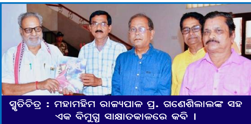
ସ୍ମୃତିଚିତ୍ର : ମହାମହିମ ରାଜ୍ୟପାଳ ପ୍ର. ଗଣେଶୀଲାଲଙ୍କ ସହ ଏକ ବିମୁଗ୍ଧ ସାକ୍ଷାତକାଳରେ କବି ।

ବିଶ୍ୱବିଦ୍ୟାଳୟ ସ୍ଥାପନା ହେବା, ସରକାରୀ ସ୍ତରରେ ଓଡ଼ିଆ ଭାଷାର ବ୍ୟବହାର ଇତ୍ୟାଦି ସକରାତ୍ମକ ପଦକ୍ଷେପ ମାତୃଭାଷାର ପ୍ରାଥମିକ ପ୍ରତି ନିଶ୍ଚୟ ଶୁଭକାରୀ । ତେବେ ଏହା ଯେ ଯଥେଷ୍ଟ ନୁହେଁ ଏବଂ ଏ ଦିଗରେ ଯଥେଷ୍ଟ ସଚେତନ ହେବାର ଆବଶ୍ୟକତା ଅଛି । ■ ଜଣେ କବି ଓ ସାହିତ୍ୟ ସଂଗଠକ ଭାବରେ ମଣିଷର ସାମାଜିକ ଦାୟିତ୍ୱ କଣ ହେବାର ଉଚିତ୍ ? ■ ସାହିତ୍ୟ ମାଧ୍ୟମରେ ସମାଜକୁ ସୁସଜ୍ଜିତ ଓ ସୁଶୁଖିଳିତ କରିବା ପ୍ରତ୍ୟେକ କବି ଓ ସାହିତ୍ୟିକର ପରମ ଦାୟିତ୍ୱ ହେବା ଉଚିତ୍ । ପରିବର୍ତ୍ତିତ ସମାଜରେ ମାନବୀୟ ମୂଲ୍ୟବୋଧ ଓ ଜୀବନ ଜୀବନୀର ଏକ ସକରାତ୍ମକ ବାଣୀ ଦେବା ପ୍ରତ୍ୟେକ ସାହିତ୍ୟିକର ବା ସଂଗଠକଙ୍କର ପ୍ରାଥମିକ ଦାୟିତ୍ୱ । ■ କବିତା ଏବଂ ସାହିତ୍ୟ ପରିବର୍ତ୍ତନ କରିପାରେ କି ? କବିତା ପାଇଁ ଭାବ, ଭାଷା ନା ଶୈଳୀ, କିଏ ବେଶ୍ ଗୁରୁତ୍ୱପୂର୍ଣ୍ଣ ?