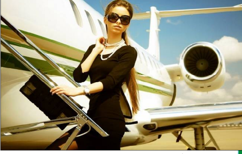
ଟ୍ରୋକୋଲି, ଫୁଲକୋବି, ବନ୍ଧାକୋବି ଆଦି ପରିବା ସ୍ୱାସ୍ଥ୍ୟ ପାଇଁ ଖୁବ୍ ଭଲ, କିନ୍ତୁ ବିମାନ ଯାତ୍ରା ପୂର୍ବରୁ ଏସବୁ ଖାଆନ୍ତୁ ନାହିଁ । କାରଣ ଏହି ପରିବା ସହଜରେ ହଜମ ହୋଇନଥାଏ ।

ବିମାନ ଯାତ୍ରା ସମୟରେ ଖାଦ୍ୟ ନିୟମିତ ଭାବେ ଖାଇବା ଉଚିତ । ବିମାନ ଚିକେଟ୍ ଭଙ୍ଗା ଯତ୍ନେ ହାତ ପାଲଟାଇ ଦିଅନ୍ତୁ ବର୍ତ୍ତମାନ ଲୋକେ ନିଜ ସମ୍ପତ୍ତି ଅନୁସାରେ ଯାତ୍ରା କରିପାରୁଛନ୍ତି । ତେବେ ବିମାନ ଯାତ୍ରା ସମୟରେ କୋଡୋଟି ବିନା ପ୍ରତି ଧ୍ୟାନ ଦେବା ଆବଶ୍ୟକ । ସମସ୍ତ ପ୍ରକାର ଖାଦ୍ୟପାନୀୟ ଆକାଶମାର୍ଗରେ ଯାତ୍ରା ସମୟରେ ଖାଇବା ସ୍ୱାସ୍ଥ୍ୟ ନିମନ୍ତେ ହିତକର ନୁହେଁ । ଛଣାଛଣି ଖାଦ୍ୟ ବିମାନ ଯାତ୍ରା ସମୟରେ କିମ୍ବା ୩୦-୪୦ ମିନିଟ୍ ପୂର୍ବରୁ ସେବନ କରନ୍ତୁ ନାହିଁ । ଏହା କାରଣରୁ ଅଳ୍ପ ରୋଗ ହେବାର ଆଶଙ୍କା ସର୍ବାଧିକ । ବିଶେଷତଃ ମତରେ ଛଣାଛଣି ଖାଦ୍ୟରେ ସୋଡିୟମ ପରିମାଣ ଅଧିକ ଥିବାରୁ ତାହା ଶରୀର ପାଇଁ କ୍ଷତିକାରକ । ମୃଦୁପାନୀୟ ମଧ୍ୟ ବିମାନ ଯାତ୍ରା ପୂର୍ବରୁ ନ ପିଇବା ଉଚିତ । ଏହି କାରଣରୁ ବଦହଜମ ହୋଇପାରେ ।