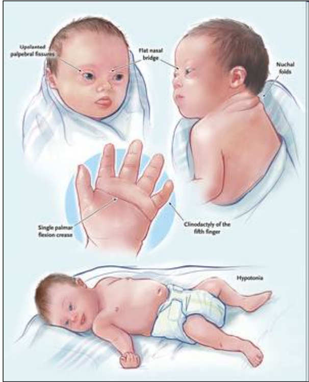
ଉପରୋକ୍ତ ହୁଅନ୍ତୁ ନାହିଁ ପ୍ରାଥମିକ ସମସ୍ୟା ପରାମର୍ଶ ଓ ଚିକିତ୍ସା ଗ୍ରହଣ କଲେ ଏହା ସମସ୍ୟା ହୋଇ ରହିବନାହିଁ ।

ପିଲାଟି ଚଳାଚଳୁ ଆଉ ବୋହୂକୁ ଆଉ ଛୋଟିଆ ମୋଟିଆ ନିତ୍ୟ ନିୟମିତ କାର୍ଯ୍ୟକରିବାରେ ଅପାରଗ ହେଲେ । ସେହିପରି ଏହାର ଆନୁସଙ୍ଗିକ ସମସ୍ୟା ଗୁଡ଼ିକରେ ମାଂସପେଶୀ ଦୁର୍ବଳତା, ଆଇରଣ୍ଡିଫି ସମସ୍ୟା, ରକ୍ତ ସଂକ୍ରମଣ, ଦୃଷ୍ଟି ଦୋଷ, କାନ ସଂକ୍ରମଣ ଓ ଶ୍ରବଣ ସମସ୍ୟା ମେଡୁଲର ଉପରିଭାଗର ସମସ୍ୟା, ଏପରିକି ହୃଦରୋଗ ମଧ୍ୟ ଦେଖାଦେଇଥାଏ ।