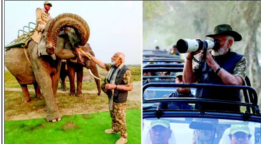
ନୂଆଦିଲ୍ଲୀ, ୦୯/୩ : ପୁଣି ଥରେ ବନ୍ୟପ୍ରାଣୀଙ୍କ ଗହଣରେ ସମୟ କାଟିଲେ ପ୍ରଧାନମନ୍ତ୍ରୀ। ଶନିବାର କାଜିରଙ୍ଗା ଜାତୀୟ ଉଦ୍ୟାନରେ ପହଞ୍ଚିଥିଲେ ମୋଦୀ। ହାତରେ କ୍ୟାମେରା ଓ ମୁଣ୍ଡରେ କ୍ୟାପ୍, ଭିନ୍ନ ଏକ ଅବସ୍ଥାରେ ମୋଦୀଙ୍କୁ ଦେଖିବାକୁ ମିଳିଛି। ହାତୀ ପିଠିରେ ବସି ଭୁଲିବା ସହ ଜିପରେ ଚାନ୍ଦଗର ରିଜର୍ଭରେ ପହଞ୍ଚିଥିଲେ। କେବଳ ସେତିକି ନୁହେଁ କାଜିରଙ୍ଗା ବୁଲିବା ପ୍ରସଙ୍ଗରେ ଅଭିଳାଷ କରୁଥିବା ଆକର୍ଷଣୀୟ ଦୃଶ୍ୟ ସବୁ ନିଜେ କ୍ୟାମେରାରେ