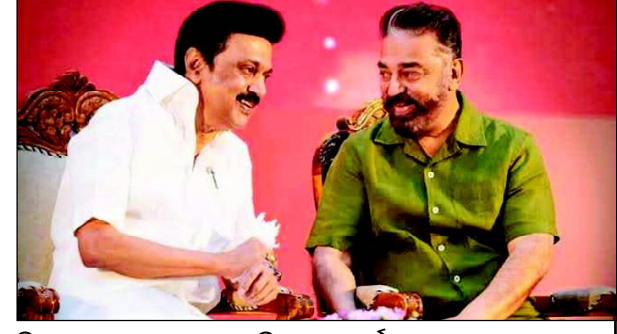
ଡିଏମକେ ନେତା ଚେନ୍ନାଇର ଡିଏମକେ କାର୍ଯ୍ୟାଳୟରେ କମଳ ହାସନଙ୍କୁ ସାକ୍ଷାତ କରିଛନ୍ତି। କମଳ ହାସନ କହିଛନ୍ତି, ସେ ଲୋକସଭା ନିର୍ବାଚନ ଲଢ଼ିବେ ନାହିଁ। କିନ୍ତୁ ଚେନ୍ନାଇରେ ଡିଏମକେ ନେତୃତ୍ୱାଧୀନ ମେଖ ପାଇଁ ପ୍ରଚାର କରିବେ। କୌଣସି ଆସନ ପାଇଁ ନୁହେଁ ଦେଶ ପାଇଁ ସେ ଏଭଳି କରିବେ। ଯେଉଁଠି ତାଙ୍କର ସମର୍ଥନ ଲୋଡା, ସେ ତାଙ୍କୁ ନିଜ ସମର୍ଥନ ଦେଉଛନ୍ତି ବୋଲି କହିଛନ୍ତି। ଅନ୍ୟପକ୍ଷେ କଂଗ୍ରେସ ପାଇଁ ଡିଏମକେ ୨୦୧୯ର ସିଟ୍ ଶେୟାରିଂ ଫର୍ମୁଲାକୁ ଦୋହରାଇଛି। କଂଗ୍ରେସକୁ ତାମିଲନାଡୁରେ ୯ଟି ଲୋକସଭା ଆସନ ଓ ପୁରୁଚେରାରେ ଗୋଟିଏ ଆସନ ଅଫର କରିଛି ଡିଏମକେ।

ନୂଆଦିଲ୍ଲୀ, ୦୯/୩ : ଅଭିନେତାଙ୍କୁ ନେତା ପାଲଟିଥିବା ସାଉଥୀୟ ପୁରୁଷୋତ୍ତମ କମଳ ହାସନ। ଏଥର ଲୋକସଭା ନିର୍ବାଚନ ସେ ଲଢ଼ିବେନି। କିନ୍ତୁ ଡିଏମକେ ପାଇଁ କରିବେ ପ୍ରଚାର। ଆଉ ପ୍ରଚାର ବଦଳରେ ତାଙ୍କ ଦଳ ଏମ୍‌ଏନ୍‌ଏମ୍‌କୁ ମିଳିବ ଗୋଟିଏ ରାଜ୍ୟସଭା ସିଟ୍। ତାମିଲନାଡୁରେ ଡିଏମକେ ଏଭଳି କିଛି ମେଖ ଫର୍ମୁଲା ପ୍ରସ୍ତୁତ କରିଥିବା ସୂଚନା ମିଳିଛି। ଏହା ବ୍ୟତୀତ ଡିଏମକେ ନେତୃତ୍ୱାଧୀନ ପ୍ରଚାର କରିବ ବୋଲି ମଧ୍ୟ କଥା ପକ୍ୱ ହୋଇଛି। ତାମିଲନାଡୁ ମୁଖ୍ୟମନ୍ତ୍ରୀ ଏମ୍‌କେ ଷ୍ଟାଲିନ, ଉପଯନ୍ତ୍ରୀ ଷ୍ଟାଲିନ ଓ ଅନ୍ୟ ଦକ୍ଷିଣ