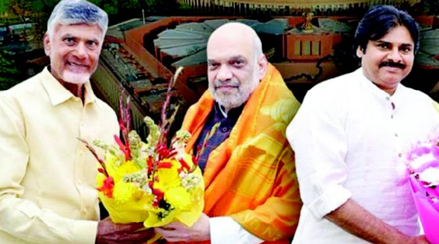
ପ୍ରସ୍ତୁତ କରାଯାଇଥିବା କୁହାଯାଇଛି। ସୁଦ୍ଧା ଅନୁଯାୟୀ ବିଜେପି ଆନ୍ତର୍ଯ୍ୟାମୀ ୬ଟି ଲୋକସଭା ଆସନରେ ନିର୍ବାଚନ ଲଢ଼ିପାରେ। ସେହିପରି ପଦ୍ମ କଲ୍ୟାଣଙ୍କ ନେତୃତ୍ୱାଧୀନ ଜେଏସ୍‌ସି ୨ଟି ଓ ଟିଡିପି ଅନ୍ୟ ୧୭ଟି ଆସନରେ ନିର୍ବାଚନ ଲଢ଼ିବ। ଖୁଲଜାଗ, ବିଜୟପୁରୀ, ଅରାଜୁ, ରାଜମପେଟ, ରାଜମୁନ୍ଦରୀ, ତିରୁପୁରୀରେ ନିର୍ବାଚନ ଲଢ଼ିବାକୁ ବିଜେପି

ଆନ୍ତର୍ଯ୍ୟାମୀ, ୦୯/୩ (ନି.ପ୍ର): ଏଥର ଆନ୍ତର୍ଯ୍ୟାମୀ ଦେଶରେ ଦମ୍ଭ ଦେଖାଇବ ବିଜେପି। ଏଥର ଚନ୍ଦ୍ରବାବୁ ନାୟକ ଓ ପଦ୍ମ କଲ୍ୟାଣଙ୍କ ଦଳ ସହ ମିଶି ବିଜେପି ଆନ୍ତର୍ଯ୍ୟାମୀ ଦେଶରେ ନିର୍ବାଚନ ଲଢ଼ିବାକୁ ଅଣ୍ଟା ଭିଟିଛି। ଏଥିପାଇଁ ଆସନ ଭାଗବତୀଙ୍କୁ ନେଇ ପ୍ରାୟ ଶେଷ ହୋଇଛି କୁଟାମଣା। ଏଥର '୧୭+୨+୨' ଫର୍ମୁଲାରେ ବିଜେପି ଆନ୍ତର୍ଯ୍ୟାମୀ ଦେଶରେ ନିର୍ବାଚନ ଲଢ଼ିବ। ତେଲୁଗୁ ଦେଶମ ପାର୍ଟି(ଟିଡିପି) ଅଧ୍ୟକ୍ଷ ଚନ୍ଦ୍ରବାବୁ ନାୟକ ଓ ଜନ ସେନା ପାର୍ଟି(ଜେଏସ୍‌ସି) ପ୍ରମୁଖ ପଦ୍ମ କଲ୍ୟାଣ ନୂଆ ଦିଲ୍ଲୀରେ ବୃହତ୍‌ମନ୍ତ୍ରୀ ସମିତି ଶାହ ମିଶି ଆଲୋଚନା କରିବା ପରେ ଏଭଳି କିଛି ଫର୍ମୁଲା