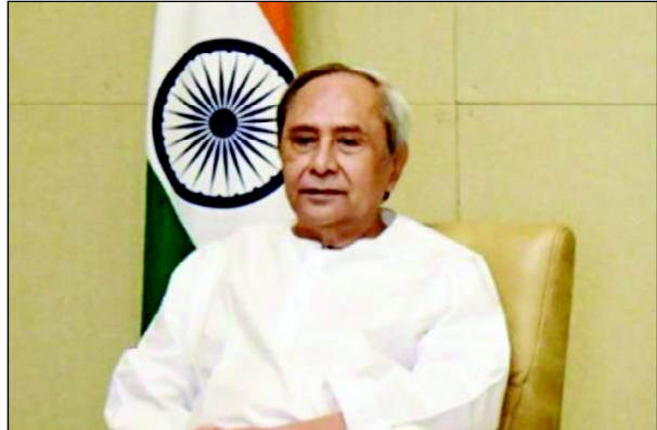
ଉଚ୍ଚଶିକ୍ଷା ବିଭାଗ ଅଧୀନ ସ୍କୁଲ, ପିଲି ପିଲା ଏହି ବୃତ୍ତି ପାଉଥିଲେ । ଏବେ ଅନ୍ୟ ବିଭାଗ କୃଷି, ସଂସ୍କୃତି ବିଭାଗ ଅଧୀନରେ ଥିବା ପିଲା ମଧ୍ୟ ପାଇବେ ।

ଭୁବନେଶ୍ୱର, ୦୯/୩ (ନି.ପ୍ର): ରାଜ୍ୟ କ୍ୟାବିନେଟ୍ ବୈଠକରେ ଶନିବାର ସନ୍ଧ୍ୟାରେ ୧୭ଟି ପ୍ରସ୍ତାବକୁ ମଞ୍ଜୁରୀ ମିଳିଛି । ମୁଖ୍ୟମନ୍ତ୍ରୀ ନବୀନ ପଟ୍ଟନାୟକଙ୍କ ଅଧିକ୍ଷତାରେ ଲୋକସଭା ଭବନରେ ଅନୁଷ୍ଠିତ ବୈଠକରେ ରାଜସ୍ୱ ବିପର୍ଯ୍ୟୟ ପରିଚାଳନା ବିଭାଗର ୩ଟି ପ୍ରସ୍ତାବ ମଞ୍ଜୁରୀ ମିଳିଛି । ବୈଠକରେ ରାଜ୍ୟର ସମସ୍ତ ସ୍କୁଲ (ସ୍ନାତକ) ଓ ପିଲି (ସ୍ନାତକୋତ୍ତର) ପିଲାଙ୍କୁ ନୂଆ-ଓ ଛାତ୍ରବୃତ୍ତି ମିଳିବ ବୋଲି ମଧ୍ୟ ନିଶ୍ଚିତ ହୋଇଛି । ପୂର୍ବରୁ କେବଳ