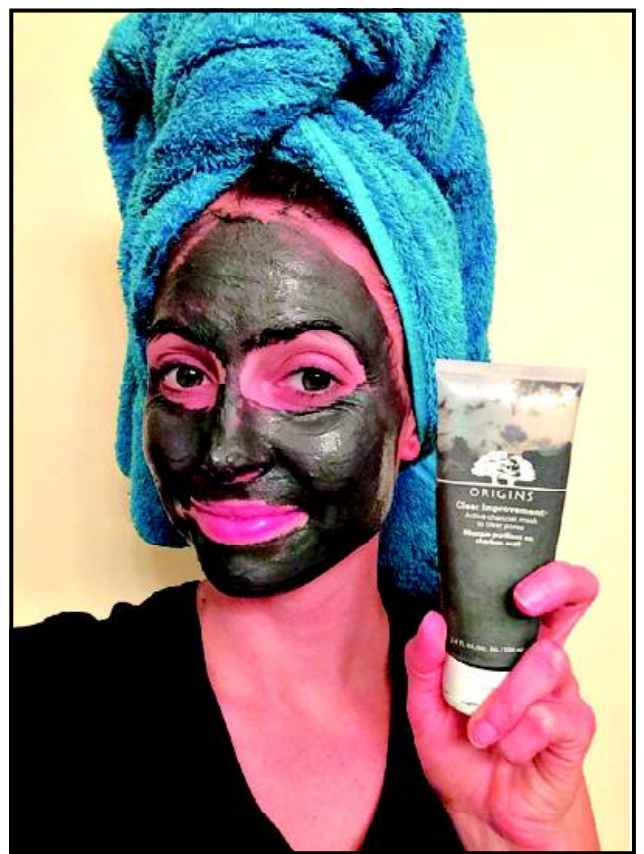
କେହି କେବେ ନିଜ ମୁହଁକୁ କଳାରଙ୍ଗରେ ସଜାଇବାକୁ ଚାହଁନ୍ତି ନି କଳାରଙ୍ଗର ତୃତୀୟ ପାଇବାକୁ ଇଚ୍ଛା କରିବେନି । କଳା ଅଜ୍ଞାନତା ମନୋକା କରିଦେଉଥିବାରୁ ଏହାକୁ

ଏ ସଂସାରରେ ସମସ୍ତେ ସଫଳତା ଲାଭ ଲାଗି ଚାହୁଁଛନ୍ତି । କେହି କୌଣସି କାର୍ଯ୍ୟରେ ସଫଳତାର ଆଶା ରଖନ୍ତି ତ ଆଉକେହି ଆଧ୍ୟାତ୍ମିକ କ୍ଷେତ୍ରରେ ସଫଳ ହେବାକୁ ମନ ବଳାନ୍ତି । ମନୁଷ୍ୟର ସଫଳତା ପ୍ରାୟ ନିର୍ଭର କରେ ତା'ର କର୍ମର ଶ୍ରେଷ୍ଠତା ଉପରେ । କର୍ମ ଯଦି ସତ୍ ଓ ନିଃସ୍ୱାର୍ଥ; ତେବେ ସଫଳତା ପ୍ରାୟ ଅସମ୍ଭବ ନୁହେଁ । ଏଥି ପାଇଁ ମନର ଶାନ୍ତି ଓ ପ୍ରସନ୍ନତା ଆବଶ୍ୟକ । ଇଚ୍ଛା ଦ୍ୱାରା ହିଁ ଜଟିଳ କାର୍ଯ୍ୟ ସହଜରେ ସାଧିତ ହୋଇଥାଏ । ଇଚ୍ଛାରୁ ଜନ୍ମ ନିଏ ପରିବାର ବିଶ୍ୱାସ ଏବଂ ତାହା ଆତ୍ମ-ବିଶ୍ୱାସରେ ପରିଣତ ହୁଏ । ବିଶ୍ୱାସ ଓ ଆତ୍ମ-ବିଶ୍ୱାସ ସଫଳତା ପାଇବାର ଅମୋଗ ଅସ୍ତ୍ର । ଆତ୍ମ-ବିଶ୍ୱାସ ଆମ ଭିତରେ ଦେବତା ଗୁଣ ପ୍ରକଟ କରେ । ସେତେବେଳେ ବ୍ୟକ୍ତି ସମର୍ଥ ହୋଇ ଯେକୌଣସି କାମ କରିପାରେ । ନିଜ ଉପରେ ବିଶ୍ୱାସ ନ ଥିବା କାରଣରୁ ଆମେ ଅନେକ ସମୟରେ ଅସଫଳ ହେଉ । ଆତ୍ମ-ବିଶ୍ୱାସ ସଂପର୍କରେ ସ୍ୱାମୀ ବିବେକାନନ୍ଦଙ୍କ ଉକ୍ତି ଏଠାରେ ଉଲ୍ଲେଖଯୋଗ୍ୟ- 'ଯାହାର ଆତ୍ମ-ବିଶ୍ୱାସ ନାହିଁ, ସେ ନାହିଁ । ବ୍ୟକ୍ତି ଅଥବା ରାଷ୍ଟ୍ର ଯେତେବେଳେ ଆତ୍ମ-ବିଶ୍ୱାସ ହରାଏ, ସେତେବେଳେ ହିଁ ତାର ମରଣ ହୁଏ । ଏଣୁ ନିଜ ଉପରେ ବିଶ୍ୱାସ ହିଁ ସଫଳତାର ଏକମାତ୍ର ଉପାୟ ।'