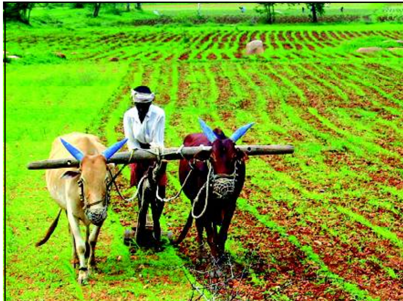
କାର୍ଯ୍ୟକ୍ରମ କହେ- ଏହା କୃଷକ ସମାଜର ପ୍ରତ୍ୟେକ ସଭ୍ୟଙ୍କ ପାଇଁ ସତ୍ୟୋଷକନକ ଜୀବନଧାରଣ ମାନ ଯୋଗାଇ

ଫସଲ ସହ ପ୍ରାଣୀପାଳନ ହିଁ ପରିବେଶ ଅନୁକୂଳ ଦୀର୍ଘସ୍ଥାୟୀ କୃଷି ଉପଯୋଗୀ, ବିକୃତ ଆର୍ଥିକ କାଞ୍ଚା କୃଷିକୁ କେବଳ ଅମଳ ବୃଦ୍ଧି ଭଳି ଏକ ନିର୍ଦ୍ଦିଷ୍ଟ ଦିଗକୁ ଚାଣିନେବାରେ ଲାଗିଛି। ଏକ ସୁସ୍ଥ ଖାଦ୍ୟ ତଥା କୃଷି