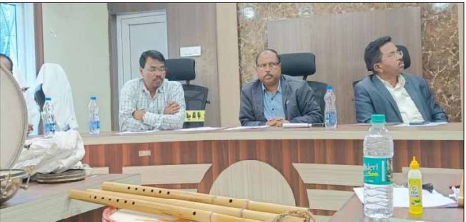
ବିଭିନ୍ନ ଜନଜାତି ସଂପ୍ରଦାୟର କଳା, ସଂସ୍କୃତି ଏବଂ ଐତିହ୍ୟକୁ ବଞ୍ଚାଇ ରଖିବାକୁ ଓଡ଼ିଶା ସରକାରଙ୍କ ସ୍ୱତନ୍ତ୍ର ଉନ୍ନୟନ ପରିଷଦ ପକ୍ଷରୁ ଏହି ଟେଣ୍ଡର ଉନ୍ମୋଚନ କରାଯାଇଥିଲା ।

ନୀଳଗିରି, ୯/୨ (ନି.ପ୍ର): ବାଲେଶ୍ୱର ଜିଲ୍ଲା ସ୍ୱତନ୍ତ୍ର ଉନ୍ନୟନ ପରିଷଦ ପକ୍ଷରୁ ନୀଳଗିରି ଆଇଡିଟିଏ ସମ୍ମିଳନୀ କକ୍ଷରେ ଶୁକ୍ରବାର ୧୧ ସମୟରେ ଆଦିବାସୀ ଜନଜାତି ମାନଙ୍କର ପୋଷାକ ପରିଚ୍ଛେଦ, ବାଦ୍ୟଯନ୍ତ୍ର ଆଦି ସାମଗ୍ରୀ ଯୋଗାଣଦେବା ନିମନ୍ତେ ଆହୁତ ଟେଣ୍ଡରକୁ ଉନ୍ମୋଚନ କରାଯାଇଛି । ଏହି ଟେଣ୍ଡରକୁ ନେବା ପାଇଁ ବାଲେଶ୍ୱର ଡିନୋଟି ସଂସ୍ଥା ଆବେଦନ କରିଥିବା ବେଳେ ଏହାକୁ ପଞ୍ଜୀକୃତ ଏବଂ ଟେଣ୍ଡର ହାତରେ ସର୍ବନିମ୍ନ ମୂଲ୍ୟରେ ଯୋଗାଣ ଦେବା ପାଇଁ ସ୍ୱୀକୃତି ପାଇଛି । ବାଲେଶ୍ୱର ଜିଲ୍ଲାର