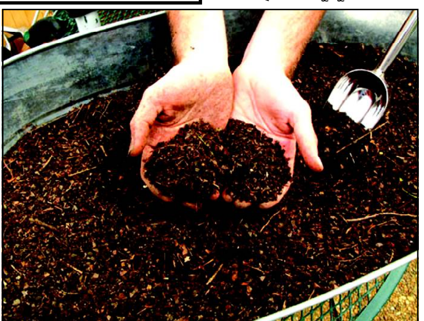
ପାଇପାଉଥିବ। ଏପରିକି ଗୋମୂତକ ତଥା ଭବିଷ୍ୟତ ବଂଶଧରଙ୍କ ପାଇଁ ମୃତ୍ତିକା ଓ ଏହାର ଉତ୍ପାଦିକା ଶକ୍ତି ରକ୍ଷା କରିପାଉଥିବ।

ଲାଭଜନକ ତଥା ଦୀର୍ଘସ୍ଥାୟୀ କୃଷି ପାଇଁ ବନ୍ୟଜନ୍ତୁ ସମୂହ ତଥା ଅଗଣିତ ଜଙ୍ଗଲ ଗୁଳ୍ମ, ଫୁଲ ତଥା ବୃକ୍ଷ ଆଦିର ଉପାଦେୟତାକୁ ଚାଷୀଭାଇ ଭୁଲିଯାଇଛନ୍ତି। ଆଜିର କୃଷି ବୈଷୟିକ ଜ୍ଞାନ ସୀମିତ ଭାବେ ପ୍ରୟୋଗ କରାଯାଉଛି।