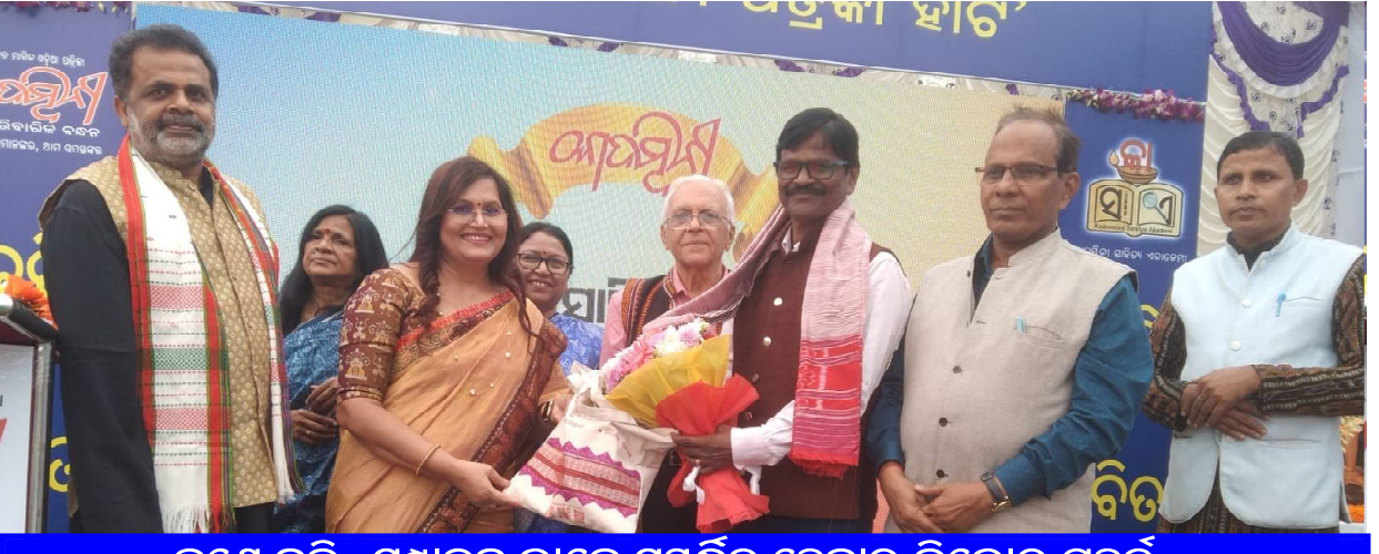
ଜଣେ କବି, ସମ୍ପାଦକ ଭାବେ ସମ୍ବର୍ଦ୍ଧିତ ହେବାର ବିଭୋର ମୁହୂର୍ତ୍ତ...

■ ମୁଁ ହାଲଚକ୍ରିୟରେ ପଢ଼ିଲା ବେଳେ ମୋ ବଡ଼ବୋଉକୁ ସବୁ ପୁରାଣ ପଢ଼ି କି ଶୁଣାଉଛି । ଆମ ଗାଁରେ ଲାଭଭୋଗରେ ସବୁ ଗପ, ସିରିକ ଡିଟେକ୍ଟିଭ ପଢ଼ିଥିଲି । କଲେଜରେ ଗୋପୀନାଥ ମହାନ୍ତି, କାଳିନ୍ଦୀ ଚରଣ, ଫକୀର ମୋହନ, କାନ୍ତୁଚରଣ, କିଶୋରଚରଣ ଦାସ, ବିକ୍ରମ ପଟ୍ଟନାୟକ, ପ୍ରତିଭା ରାୟ, ରାଧାମୋହନ ଗଡ଼ନାୟକଙ୍କୁ ପଢ଼ିଲି । ଆମ ଗ୍ରାମର ଗାନ୍ଧି ଓ ଔପନ୍ୟାସିକ କାଳିନ୍ଦୀ ଚରଣ କେନା ତାଙ୍କର ଗପ ଗୁଡ଼ିକ ଆଉଥରେ ଲେଖିବାକୁ ମୋତେ ଦେଉଥିଲେ । ତାଙ୍କର ସେହି ଗପ ସବୁକୁ ଉତ୍ତରା ଉତ୍ତରା ଗପ ଲେଖିବାର ଭକ୍ତା ମୋ ମନରେ ସୃଷ୍ଟି ହୋଇଥିଲା । ■ କେମିତି ଥିଲା ସାହିତ୍ୟ ଜଗତରେ ପ୍ରଥମ ପ୍ରବେଶର ଅନୁଭୂତି ? ବର୍ତ୍ତମାନ ସୁଦ୍ଧା ଆପଣଙ୍କର କେତୋଟି ପୁସ୍ତକ ପ୍ରକାଶିତ ? ସେଥିପାଇଁ କେଉଁଟି ଆପଣଙ୍କର ପ୍ରିୟ ଓ କହିବି ? ■ ଯେଉଁଦିନ ମୋର ପ୍ରଥମ ଗପ ପ୍ରକାଶ ପାଇଥିଲା ମୁଁ ବହୁତ ଖୁସି ହୋଇ ଯାଇଥିଲି । ଆଉ ଅନେକ ଲୋକଙ୍କୁ ପଢ଼େଇ ଥିଲି । ସେମାନଙ୍କ ପ୍ରଶଂସା ମୋତେ ଆଜି କଣେ ଗାନ୍ଧି କରିପାରିଛି । ମୋର ପ୍ରଥମ ଗଳ୍ପ ସଂକଳନ 'ଶେଷ ଠିକଣା' ଦ୍ୱିତୀୟ ଗଳ୍ପ ସଂକଳନ 'ସବୁଜ ସକାଳର ଅପେକ୍ଷାରେ' ଓ ତୃତୀୟ ଗଳ୍ପ ସଂକଳନ 'ବିବର ଶେଷର ସୂର୍ଯ୍ୟୋଦୟ' ଆଉ ତତ୍ପର୍ଯ୍ୟ ଗଳ୍ପ ସଂକଳନ 'ବଦଳି ଯାଇଥିବା ରାଷ୍ଟ୍ରା' ଏବେ ଯକ୍ଷପୁ । ଆଉ ଅନେକ ଗଳ୍ପ ମୋ ପାଖରେ ଆଗାମୀ ଦିନର ସୂର୍ଯ୍ୟୋଦୟ ଦେଖିବାକୁ ଅପେକ୍ଷାରେ । ଆପଣ ପଢ଼ାରିଛନ୍ତି ମୋର ପ୍ରିୟ ପୁସ୍ତକ କିଏ ? ସେ କଥା ମୁଁ କଣ କହି ପାରିବି । ସମସ୍ତେ ମୋର ମାନସ ସଜାନ । ସମସ୍ତେ ମୋ ପାଖରେ ସମାନ,