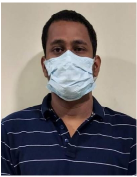
ଦେଖୁବା ସମ୍ପତ୍ତି ତଦତ ପରେ ।

ଜନଶୀ, ୨୧/୦୧ (ନି.ପ୍ର): ୭୩ ଲକ୍ଷ ୭୫ ହଜାର ବଙ୍କାର ସମ୍ପତ୍ତି ବାଜ୍ୟାପ୍ତି । ପ୍ରକାଶ ଆଉଟ୍, ଜଟଣୀ ମୁଣ୍ଡିଆପାଲିକା ଶିବ ଦାସଙ୍କ ସମ୍ପତ୍ତି ବାଜ୍ୟାପ୍ତି । ୩.୧୧କୋଟିର ବ୍ରାଉନସୁଗାର କବଚ, ଶିବ ପ୍ରସାଦ ଶିବପଟ୍ଟ, ୩ ବିଦେଶୀ ବନ୍ଧୁକ, ୭ ମାଗାଜିନ୍, ୪୩ ରାଉଣ୍ଡ ଗୁଳି କବଚ । ୫୫ ଲକ୍ଷ ୩୨ ହଜାର ୨ ଶହ ନଗଦ ଟଙ୍କା କବଚ । ଅଧିକ ତଥ୍ୟ ଆଗକୁ ପଢ଼ି ।