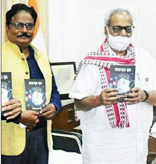
ମାନବର ରାଜ୍ୟପାଳଙ୍କ ସହ... ବହି ଉନ୍ମୋଚନ ଉତ୍ସବରେ...

କଲି । ଜମା ଭଲ ଲେଖୁନଥିଲି । କିନ୍ତୁ ବାପା ଆଉ ବୋଉ କହୁଥିଲେ ବଢ଼ିଆ ଲେଖୁନୁ । ତାହାହିଁ ଥିଲା ମୋ ପାଇଁ ପ୍ରେରଣାର ଉତ୍ସ । ■ କେମିତି ଥିଲା ସାହିତ୍ୟ ଜଗତରେ ପ୍ରଥମ ପ୍ରବେଶର ଅନୁଭୂତି ? କେଉଁ ନିର୍ଦ୍ଦେଶ ଲକ୍ଷ୍ୟ ଓ ଆଦର୍ଶ ନେଇ ଆପଣଙ୍କର ଏ ଯାତ୍ରା ? ■ ମୁଁ ଯେତେବେଳେ ଲେଖିବା ଆରମ୍ଭ କରିଥିଲି, ସେତେବେଳେ ଆଦର୍ଶ କଣ ଥିଲା ବୁଝୁନଥିଲି । ପରବର୍ତ୍ତୀ