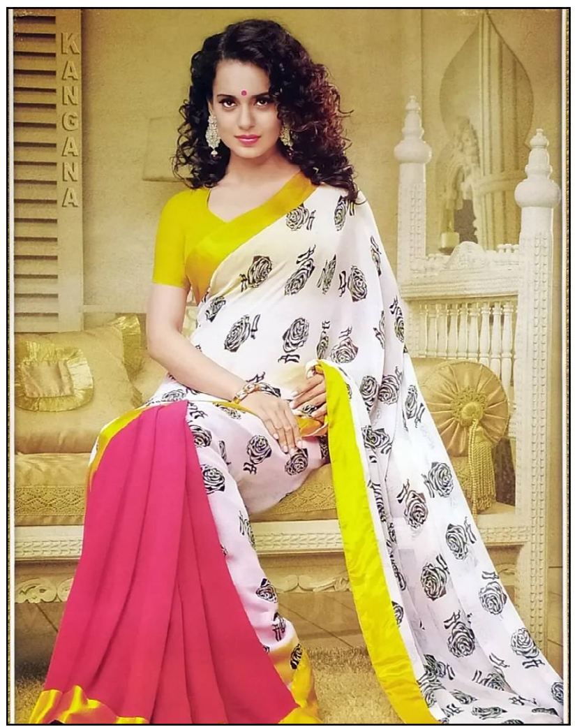
ଅନ୍ୟ ଷ୍ଟୁଡିଓଙ୍କ ଗାଭାୟୀତାକୁ ହିସାବରେ ସେମାନେ ଏଭଳି ରାଜନୀତି ସହ ଜଡିତ ଫିଲ୍ମ କରନ୍ତି ନାହିଁ । ସେ କିଓ ବିନୋଦନ ନେଇ କହିଛନ୍ତି ଯେ କଙ୍ଗନା ବିଜେପି ସରକାରକୁ ସମର୍ଥନ କରୁଥିବାରୁ କିଓ ବିନୋଦନ ତାଙ୍କ ସହ କାମ କରିବାକୁ ଚାହୁଁନାହିଁ ।

କଙ୍ଗନା ରାଣାଡୁଡ଼ ନିଜ ଅଭିନୟ ସହିତ ନିଜର ସ୍ୱସ୍ୱଭାବୀ କଥାବାର୍ତ୍ତା ପାଇଁ ଖୁବ୍ ଜଣାଶୁଣା । ନିଜତରଳ ପ୍ରସ୍ତୁତିପାଇଁ 'ବିଲକ୍ଷିତ ବାନୋ' ମାମଲାରେ ରାୟ ଶୁଣାଇଛନ୍ତି । ଏବେ କଙ୍ଗନା ରାଣାଡୁଡ଼ ସେହି ରାୟ ପରେ ନିଜର ଉଚ୍ଚା ପ୍ରକଟ କରିଛନ୍ତି । ଅଭିନେତ୍ରୀ କହିଛନ୍ତି ଯେ ଏହି ପୂରା ପ୍ରସଙ୍ଗ ଉପରେ ସେ ବିନୋଦନ କରିବାକୁ ଚାହାନ୍ତି । ଫ୍ୟୁଚର( ଏବେ ଏକ )ରେ ଜଣେ ବ୍ୟବହାରକାରୀ କଙ୍ଗନା ରାଣାଡୁଡ଼ କହିଥିଲେ ଯେ "ନାରୀ ସଶକ୍ତିକରଣକୁ ନେଇ ଆପଣଙ୍କ ଉତ୍ସାହ ପ୍ରୋତ୍ସାହନ ଯୋଗ୍ୟ । କ'ଣ ଆପଣ ଏକ ଶକ୍ତିଶାଳୀ ଫିଲ୍ମ କରିଆରେ 'ବିଲକ୍ଷିତ ବାନୋ'ଙ୍କ କାହାଣୀ ଲୋକଙ୍କୁ ଜଣାଇବାକୁ ଆଗ୍ରହୀ ଅଟନ୍ତି ? କ'ଣ ଆପଣ ବିଲକ୍ଷିତ ବାନୋ , ନାରୀବାଦ କିମ୍ବା ମାନବିକତାକୁ ଆଖି ଆଗରେ ରଖି ଏପରି କରିପାରିବେ ?" ବ୍ୟବହାରକାରୀଙ୍କ ଏପରି ପ୍ରଶ୍ନର ଉତ୍ତରରେ କଙ୍ଗନା କହିଛନ୍ତି ଯେ ବିଲକ୍ଷିତ ବାନୋଙ୍କ ଉପରେ ସେ ଫିଲ୍ମ କରିବାକୁ ଚାହୁଁଛନ୍ତି । ତାଙ୍କ କହିବା ଅନୁସାରେ ଦୀର୍ଘ ଦିନରୁ ସେ ଏଭଳି ଫିଲ୍ମ ତିଆରି କରିବାକୁ ଚାହୁଁଛନ୍ତି । ଗତ ତିନି ବର୍ଷରୁ ସେ ଏହି ବିଷୟରେ ଚର୍ଚ୍ଚା କରିବା ସହ ଏହା ଉପରେ କାମ ମଧ୍ୟ କରୁଛନ୍ତି । କଙ୍ଗନାଙ୍କ କହିବା କଥା ହେଲା କୌଣସି ଚପ୍ ଷ୍ଟୁଡିଓ ଓ ଭଲ ଓଡିଟି ପ୍ଲଟଫର୍ମର ସପୋର୍ଟ ନିମିତ୍ତରେ ସେ ଏହି ଫିଲ୍ମ ତିଆରି କରିପାରୁ ନାହାନ୍ତି । କଙ୍ଗନା ଫ୍ୟୁଚର କରି କହିଛନ୍ତି 'ମୁଁ ସେ କାହାଣୀ ବନେଇବାକୁ ଚାହୁଁଛି । ମୋ ପାଖରେ ଷ୍ଟୁଡିଓ ମଧ୍ୟ ପ୍ରସ୍ତୁତ ଅଛି । ମୁଁ ଏହା ଉପରେ ତିନି ବର୍ଷ ହେଲା ଚର୍ଚ୍ଚା କରିବା ସହ କାମ ମଧ୍ୟ କରିଛି । କିନ୍ତୁ ନେଟୱାର୍କ , ଆମାଜନ ପ୍ରାୟ ଉଚିତ ଓ