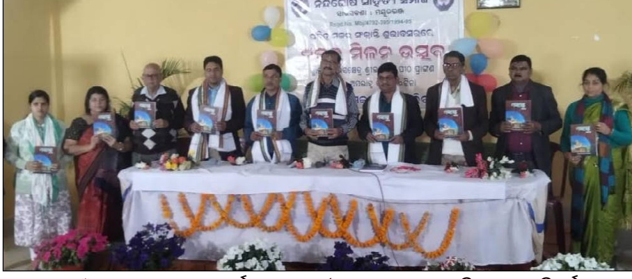
ମକର ମଣ୍ଡା ପର୍ବ ପାଳନ କରାଯାଇଥିଲା । ଉତ୍ସବରେ ଯୋଗଦେଇଥିବା ଅତିଥିମାନଙ୍କୁ ସମ୍ମାନିତ କରାଯାଇଥିଲା । ପ୍ରାରମ୍ଭରେ 'ମକର ମଣ୍ଡା' ପରିବାରର ବିଦ୍ୟାଳୟ ସମ୍ପର୍କିତ ବିଭିନ୍ନ କ୍ରମରେ ଆନୁଷ୍ଠାନିକ ସାହିତ୍ୟ ସମାଜର ପ୍ରତିଷ୍ଠା କରାଯାଇଥିଲା । ସମାଜର ପ୍ରତିଷ୍ଠା କରାଯାଇଥିଲା । ସମାଜର ପ୍ରତିଷ୍ଠା କରାଯାଇଥିଲା ।

ଦାମୋଦର, ୧୬/୧ (ନି.ପ୍ର): ପବିତ୍ର ମକର ସଂକ୍ରାନ୍ତି ଶୁଭକାର୍ଯ୍ୟକ୍ରମ ଚା:୧୫.୦.୧.୨୦୨୪ ଅପରାହ୍ଣ ସମୟରେ ଆନୁଷ୍ଠାନିକ ସାହିତ୍ୟ ସମାଜ ଆନୁଷ୍ଠାନିକଙ୍କର ସ୍ଥାନୀୟ ଶ୍ରୀକଳ୍ୟାଣ ପାଠ ସାଧନାକ୍ରମ କଲ୍ୟାଣ ମଣ୍ଡପରେ ମକର ମିଳନ ଉତ୍ସବ ଏବଂ ଫଳାଣ ମୋହନ କନ୍ୟା ଆନନ୍ଦ ଉଲ୍ଲାସ ମଧ୍ୟରେ ପାଳନ ହୋଇଯାଇଛି । ପ୍ରାରମ୍ଭରେ 'ମକର ମଣ୍ଡା' ପରିବାରର ବିଦ୍ୟାଳୟ ସମ୍ପର୍କିତ ବିଭିନ୍ନ କ୍ରମରେ ଆନୁଷ୍ଠାନିକ ସାହିତ୍ୟ ସମାଜର ପ୍ରତିଷ୍ଠା କରାଯାଇଥିଲା । ସମାଜର ପ୍ରତିଷ୍ଠା କରାଯାଇଥିଲା । ସମାଜର ପ୍ରତିଷ୍ଠା କରାଯାଇଥିଲା । ସମାଜର ପ୍ରତିଷ୍ଠା କରାଯାଇଥିଲା ।