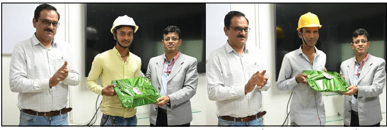
ରାଉରକେଲା, ୧୬/୧ (ନି.ପ୍ର): ସେଲ ରାଉରକେଲା ଇସ୍ପାତ କାରଖାନାର ହର୍ଷ୍ଟ୍ ଷ୍ଟ୍ରିପ୍ ମିଲ୍ -୨

ନାୟକ ଉପସ୍ଥାପନା ଦ୍ୱାରା ଅନେକ ଶିକ୍ଷଣୀୟ ବାର୍ତ୍ତା ପ୍ରଦର୍ଶନ କରିଥିଲେ ବାଲେଶ୍ୱରର ତଥା ରାଜ୍ୟର ବିଭିନ୍ନ ପ୍ରାନ୍ତରୁ ଆସିଥିବା କଳାକାରମାନେ ଓ ଜିଲ୍ଲା ପ୍ରଶାସନର ବିଭିନ୍ନ ବିଭାଗର ଚରମରୁ ଆୟୋଜିତ ହୋଇଥିଲା ଅନେକ କର୍ମଶାଳା ଏବଂ ସଚେତନତା ଶିବିର ଯେଉଁଥିରେ ବିପୁଳ ସଂଖ୍ୟାରେ ଯୋଗ ଦେଇ ତଥା କୌଶଳ ପ୍ରାପ୍ତ କରିଥିଲେ ଜନସାଧାରଣ । କୋଶମ୍ବ-୨୦୨୪ ର ଉଦ୍‌ଯାପନୀ ସଭାରେ ବହୁ ସଂଖ୍ୟାରେ ଯୋଗ ଦେଇ ବାଲେଶ୍ୱରର ଜନସାଧାରଣ ଏହି ମହାସମାବେଶକୁ ଉପଭୋଗ କରିଥିଲେ ।