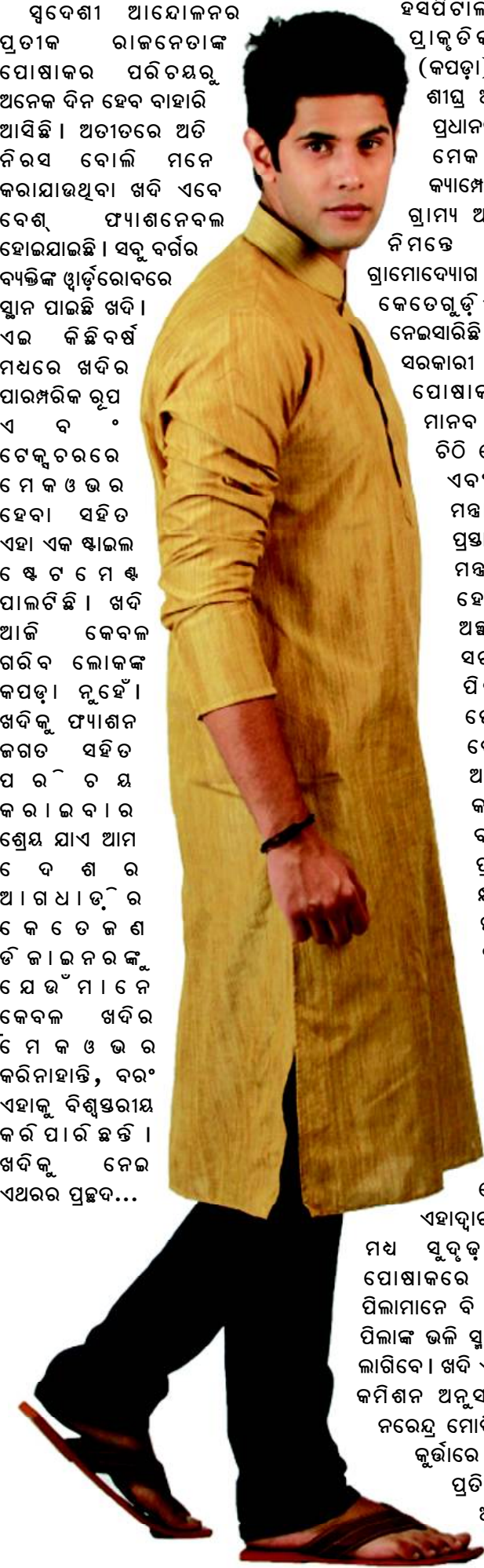
ସରକାରୀ କାର୍ଯ୍ୟାଳୟରେ ଖବି ଖବିର ପ୍ରଚାର ଓ ପ୍ରସାରକୁ ବ୍ୟାପକ କରିବା ଲକ୍ଷ୍ୟରେ ସରକାରଙ୍କ ପକ୍ଷରୁ ବିଭିନ୍ନ ଯୋଜନା ହାତକୁ ନିଆଯାଇଛି । ସରକାରୀ ସ୍କୁଲରୁ ଆରମ୍ଭ କରି ଭାରତୀୟ ରେଳବାଇ, ପୁଲିସ, ଇଣ୍ଡିଆନ ଏୟାରଲାଇନ୍ସ ଏବଂ ସରକାରୀ

ରାଜନେତାଙ୍କ ପୋଷାକର ପରିଚୟ ମଧ୍ୟରୁ ଅନେକ ଦିନ ହେବ ବାହାରି ଆସିଛି ଖବି । ପାରମ୍ପରିକ ହୋଇଥିଲେ ବି ସେଥିରେ ଲାଗିଛି ଆଧୁନିକତାର ସ୍ପର୍ଶ । ଖବିର ଚାହିଦା ଘରୋଇ ବଜାରରୁ ପ୍ରସାରିତ ହୋଇ ଆନ୍ତର୍ଜାତିକ ବଜାରରେ ପହଞ୍ଚିଛି । ଅତୀତର ଦିବର୍ଣ୍ଣ ଖବି ଏବେ ଝଲସୁଛି ରଙ୍ଗରେ ।