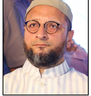
କାଶିଶୁଣ୍ଠି ବିକେପି ସରକାର ମାଟିରେ ମିଶାଇଛନ୍ତି। ଆଗକୁ ଏଭଳି ଅନେକ ମସଜିଦ ଧ୍ୱଂସ କରାଯିବ। ତେଣୁ ବିକେପି ନେତୃତ୍ୱର କେନ୍ଦ୍ର ସରକାରଙ୍କୁ

ନୂଆଦିଲ୍ଲୀ, ୨/୧ : ହିନ୍ଦୁ ବିରୋଧୀ ବୟାନ ଦେଇ ପୁଣି ବିବାଦରେ ଏଆଇଏମଆଇଏମ ମୁଖ୍ୟ ଅସଦ୍‌ଉଦ୍‌ଦିନ ଓଡ଼େସୀ। ଓଡ଼େସୀର ବିରୋଧରେ ମାମଲା ରୁଜୁ କରିଛି ହିନ୍ଦୁ ସେନା। ନିକଟରେ ଏକ ଜନସଭାକୁ ସମ୍ବୋଧିତ କରି ଅଯୋଧ୍ୟା ରାମମନ୍ଦିର ବିରୋଧରେ ବିବାଦୀୟ ବୟାନ ଦେବା ସହ ଉପକାନ୍ଦବା ଭଳି ଭାଷଣ ଦେଇଥିବା ଅଭିଯୋଗ ହୋଇଛି। ଏଆଇଏମଆଇଏମ ମୁଖ୍ୟ କହିଥିଲେ ବାକି ମସଜିଦକୁ ନେତୃତ୍ୱର କେନ୍ଦ୍ର ସରକାରଙ୍କୁ