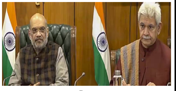
ମୃତ ନାଗରିକଙ୍କ ପରିବାର ପାଇଁ କ୍ଷତିପୂରଣ ଏବଂ ଚାକିରି ଯୋଷଣା କରିଥିଲେ । ଅନ୍ୟପଟେ ଏହି ମାମଲାରେ ତଦନ୍ତ ପ୍ରକ୍ରିୟା ମଧ୍ୟ ଆରମ୍ଭ କରାଯାଇଛି ।

ନୂଆଦିଲ୍ଲୀ: କେନ୍ଦ୍ର ଗୃହମନ୍ତ୍ରୀ ଅମିତ୍ ଶାହ ମଙ୍ଗଳବାର ଜାଣୁ କାଣ୍ଡାର ସୁରକ୍ଷା ସ୍ଥିତିର ସମୀକ୍ଷା କରିଛନ୍ତି । ୧୫ ଦିନ ତଳେ ପୁଣି କିଲ୍ଲରେ ଆତକବାଦୀ ଦ୍ୱାରା ଆକ୍ରମଣରେ ପାଞ୍ଚ ଯବାନ ସହିତ ହୋଇଥିଲେ । ତିସେମ୍ବର ୨୧ରେ ଆତକବାଦୀ ଆକ୍ରମଣ ଗୋଟିଏ ଦିନ ପରେ ସେନା ତିନି ନାଗରିକଙ୍କୁ ଚରାଭାଜରା ପାଇଁ ଠାଉ ଆଣିଥିଲା । ପରେ ତିନି ଜଣଙ୍କ ମୃତ୍ୟୁ ହୋଇଥିଲା ଏବଂ ଏହାକୁ ନେଇ ଲୋକଙ୍କ ମଧ୍ୟରେ ଆନ୍ଦୋଳନ ବେଶ୍ ଦେଖାଯାଇଛି । ଏହି ଘଟଣା ପରେ ରକ୍ଷାମନ୍ତ୍ରୀ ରାଜନାଥ ସିଂ ଏବଂ ସେନା ପ୍ରମୁଖ ମନୋଜ ପାଣ୍ଡେ ପୁଣି ଗଣତନ୍ତ୍ର କମିଟିରେ । ଆଜିର ବୈଠକରେ ଅମିତ୍ ଶାହ, ଯୋଗିନ୍ଦ୍ର, ଭାରତୀୟ ସେନା ଏବଂ ବିଆରପିଏଫ ମଧ୍ୟରେ ସମନ୍ୱୟ ସ୍ଥାପନ ଉପରେ କୋର ଦେଇଛନ୍ତି । ଏହାଦ୍ୱାରା ଜାଣୁ କାଣ୍ଡାର ସୁରକ୍ଷାକୁ ଅଧିକ ମଜବୁତ କରାଯାଇପାରିବ । ଏହାସହ ଲୋକାଳ ଅଞ୍ଚଳରେ ଉପକ୍ରମିତ ବାହାରିବା ପାଇଁ କୋର ଦେଇଛନ୍ତି । ଏହି ବୈଠକରେ ଜାଣୁ କାଣ୍ଡାର ଉପରାଜ୍ୟପାଳ ମନୋଜ ସିଂହ, ରାଷ୍ଟ୍ରୀୟ ସୁରକ୍ଷା ପ୍ରଶାସନର ଅଧିକାରୀ, ସେନା ମୁଖ୍ୟ ମନୋଜ ପାଣ୍ଡେ ଏବଂ ଗୁରୁତ୍ୱ ଓ ଅନ୍ୟ ସୁରକ୍ଷା ଏଜେଣ୍ଟଙ୍କୁ ଶାନ୍ତି ଅଧିକାରୀ ମଙ୍ଗଳବାର ବୈଠକରେ ସାମିଲ ହୋଇଥିଲେ । ଏହା ପୂର୍ବରୁ, ଜାଣୁ କାଣ୍ଡାର ପ୍ରଶାସନ