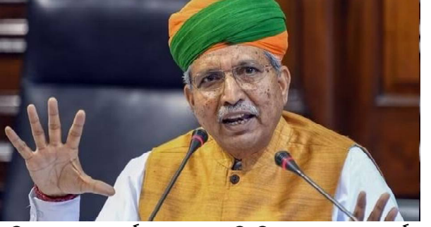
ଓଡ଼ିଶାରେ ହାଇକୋର୍ଟର ସ୍ତ୍ରୀମାନଙ୍କୁ ବେଶ୍ ପ୍ରତିଷ୍ଠା ପ୍ରସଙ୍ଗରେ ଆଜି ଏହା କହିଛନ୍ତି କେନ୍ଦ୍ର ଆଇନ ମନ୍ତ୍ରୀ ଅର୍ଜୁନ ରାମ ମେଘ୍ୱାଲା। ଭୁବନେଶ୍ୱର

ଭୁବନେଶ୍ୱର, ୨/୧ (ନି.ପ୍ର): ହାଇକୋର୍ଟର ନୂଆ ସ୍ତ୍ରୀମାନଙ୍କୁ ବେଶ୍ ପ୍ରତିଷ୍ଠା ପ୍ରସଙ୍ଗରେ ସମ୍ପୃକ୍ତ ରାଜ୍ୟ ମୁଖ୍ୟମନ୍ତ୍ରୀ ଓ ହାଇକୋର୍ଟର ମୁଖ୍ୟ ବିଚାରପତିଙ୍କ ସୁପାରିଶ ଆବଶ୍ୟକ। ଏଥିସହିତ ସୁପ୍ରିମକୋର୍ଟର ପ୍ରଧାନ ବିଚାରପତିଙ୍କ ସହମତି ଦରକାର। ଏହା ପରେ ଯାଇ କେନ୍ଦ୍ର ସରକାର ନୂଆ ସ୍ତ୍ରୀମାନଙ୍କୁ ବେଶ୍ ପ୍ରତିଷ୍ଠା ନେଇ ପଦକ୍ଷେପ ଆରମ୍ଭ କରିଥାନ୍ତି।