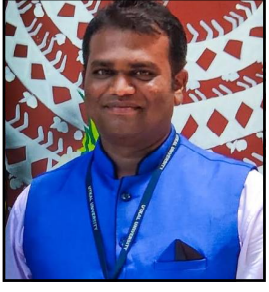
ପୃଥିବୀରେ ଏମିତି କିଛି ସମସ୍ୟା ନାହିଁ ଯାହାର ସମାଧାନ ନାହିଁ ଏବଂ ପ୍ରତିଟି ସମସ୍ୟାର ଉତ୍ତର ରହିଛି ଶ୍ରୀମତ୍ ଭଗବତ ଗୀତାର ପ୍ରତିଟି ଶ୍ଳୋକରେ । କୁରୁକ୍ଷେତ୍ରରେ ମହାଭାରତ ଯୁଦ୍ଧରେ ନିଜର ପ୍ରିୟ ପରିଜନମାନଙ୍କୁ ଦେଖି ଅସ୍ତ ଚ୍ୟାଗ କରିଦେଇଥିବା ଅର୍ଜୁନଙ୍କୁ ପ୍ରଭୁ ଶ୍ରୀକୃଷ୍ଣ ନିଜର ଦିବ୍ୟ ବାଣୀ ଦ୍ୱାରା ଜୀବନର ବାସ୍ତବତା ବୁଝାଇଥିଲେ, ଯାହାପରେ ବୀର ଅର୍ଜୁନ ପୁନଃ ନିଜର କ୍ଷତ୍ରିୟ ଧର୍ମ ପାଳନ ପୂର୍ବକ ନିଜର ବୀରତ୍ୱ ଶ୍ରେଷ୍ଠତା ପ୍ରଦର୍ଶନ କରିଥିଲେ । ସେଦିନ ସେହି ସମୟ ଅନୁତ୍ତମ ଆଜି ବି ଲାଗେ ଅନେକ ମହୋତ୍ସବ ଧର୍ମ ଆଜିର ସମୟରେ ପ୍ରତିଟି ମନୁଷ୍ୟ ପାଇଁ ନିତାନ୍ତ ଆବଶ୍ୟକ । 'ଆକର୍ଷଣ ଉଚିତ କୃଷ୍ଣ', ଅର୍ଥାତ୍ ଯିଏ ଆକର୍ଷଣ କରନ୍ତି ସେ ହିଁ କୃଷ୍ଣ ଏବଂ ଯିଏ ଅର୍ଜନ କରନ୍ତି ସେହି ଅର୍ଜୁନ କ୍ଷ ତେଣୁ ଜ୍ଞାନ ପିପାସୁ ଅର୍ଜୁନଙ୍କ ମନରେ ଯେତେବେଳେ ବିଷାଦ ଭାବ ଆସିଥିଲା ସତ୍ୟ ଶ୍ରୀକୃଷ୍ଣ ସେଠାରେ ବହୁତା ଯାତ୍ରା ନିଭାଉଥିଲେ । ସେଦିନ ଅର୍ଜୁନଙ୍କ ଦ୍ୱାରା ପଠା ଯାଇଥିବା ପ୍ରତିଟି ପ୍ରଶ୍ନ ଆଜି ବି ଲାଗେ ଅନେକ ମନୁଷ୍ୟଙ୍କ ମନରେ ଉଦ୍ଧୃତ । କିନ୍ତୁ ବର୍ତ୍ତମାନ ସମୟରେ ଶ୍ରୀକୃଷ୍ଣଙ୍କ ପରି ଜଗତଗୁରୁ ନାହାନ୍ତି ମାତ୍ର ତାଙ୍କ ବିନା ସ୍ୱାକ୍ଷରରେ ବି ଆଜି ଗୀତାର ପ୍ରଦର୍ଶିତ ମାର୍ଗକୁ ଆମେ ସମସ୍ତେ ଅନୁସରଣ କରୁଛୁ ।

ସମାଜର କିଛି ପ୍ରମୁଖ ଶ୍ଳୋକ ଉପରେ ଅବଲୋକନ କରିବା ତେବେ ଆମ ଜୀବନକୁ ସୁନ୍ଦର ଭାବେ ରଚି ଚାଲିବାରେ ସମ୍ମାନ ହେବ । ବର୍ତ୍ତମାନ ଅସହଜିତ ଜୀବନଚର୍ଯ୍ୟା ଆଜି ପ୍ରତିଟି ମନୁଷ୍ୟ ପାଇଁ ମୁଖ୍ୟ ବିଷୟ ପାଲଟିଛି । ମାତ୍ର ଗୀତାର ୧୩ ଅଧ୍ୟାୟରେ ଜୀବନଚର୍ଯ୍ୟା କିପରି ହେବା ଉଚିତ ତାହା ଉଲ୍ଲେଖ ରହିଛି - 'ଯୁଦ୍ଧାହାର ନିଜର ଦିବ୍ୟ ବାଣୀ ଦ୍ୱାରା ଜୀବନର ବାସ୍ତବତା ବୁଝାଇଥିଲେ, ଯାହାପରେ ବୀର ଅର୍ଜୁନ ପୁନଃ ନିଜର କ୍ଷତ୍ରିୟ ଧର୍ମ ପାଳନ ପୂର୍ବକ ନିଜର ବୀରତ୍ୱ ଶ୍ରେଷ୍ଠତା ପ୍ରଦର୍ଶନ କରିଥିଲେ । ସେଦିନ ସେହି ସମୟ ଅନୁତ୍ତମ ଆଜି ବି ଲାଗେ ଅନେକ ମହୋତ୍ସବ ଧର୍ମ ଆଜିର ସମୟରେ ପ୍ରତିଟି ମନୁଷ୍ୟ ପାଇଁ ନିତାନ୍ତ ଆବଶ୍ୟକ । 'ଆକର୍ଷଣ ଉଚିତ କୃଷ୍ଣ', ଅର୍ଥାତ୍ ଯିଏ ଆକର୍ଷଣ କରନ୍ତି ସେ ହିଁ କୃଷ୍ଣ ଏବଂ ଯିଏ ଅର୍ଜନ କରନ୍ତି ସେହି ଅର୍ଜୁନ କ୍ଷ ତେଣୁ ଜ୍ଞାନ ପିପାସୁ ଅର୍ଜୁନଙ୍କ ମନରେ ଯେତେବେଳେ ବିଷାଦ ଭାବ ଆସିଥିଲା ସତ୍ୟ ଶ୍ରୀକୃଷ୍ଣ ସେଠାରେ ବହୁତା ଯାତ୍ରା ନିଭାଉଥିଲେ । ସେଦିନ ଅର୍ଜୁନଙ୍କ ଦ୍ୱାରା ପଠା ଯାଇଥିବା ପ୍ରତିଟି ପ୍ରଶ୍ନ ଆଜି ବି ଲାଗେ ଅନେକ ମନୁଷ୍ୟଙ୍କ ମନରେ ଉଦ୍ଧୃତ । କିନ୍ତୁ ବର୍ତ୍ତମାନ ସମୟରେ ଶ୍ରୀକୃଷ୍ଣଙ୍କ ପରି ଜଗତଗୁରୁ ନାହାନ୍ତି ମାତ୍ର ତାଙ୍କ ବିନା ସ୍ୱାକ୍ଷରରେ ବି ଆଜି ଗୀତାର ପ୍ରଦର୍ଶିତ ମାର୍ଗକୁ ଆମେ ସମସ୍ତେ ଅନୁସରଣ କରୁଛୁ ।