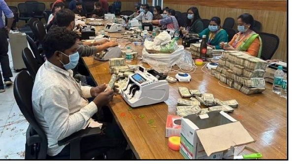
ଆଇଟିର ଅଧିକାରୀ ଓ ବ୍ୟାଙ୍କ କର୍ମଚାରୀ ଘଣ୍ଟା ଘଣ୍ଟା ବସି ପୁଲିସ୍ ଟଙ୍କା ଚଳାଣି କରୁଥିଲେ । ଏହି ସମୟରେ ଲାଗି ଥିଲା ।

ବଲାଙ୍ଗିର, ୧୧/୧୨ (ନି.ପ୍ର): କଂଗ୍ରେସ ସାଂସଦ ଧାରଣ ସାହୁଙ୍କ ଠିକଣାରେ ଚାଲିଥିବା ଆୟକର ବିଭାଗର ଚକ୍ର ଉଦ୍‌ବାର ଶେଷ ହୋଇଥିବା ବେଳେ ଏବେ ଲକ୍ଷ ଟଙ୍କା ଚୋରି ହୋଇଛି । ଆଉ ଜବତ ଟଙ୍କାକୁ ସୋମବାର ଏସିଆଲ୍ ବଲାଙ୍ଗିର ମୁଖ୍ୟ ଶାଖାରେ ଜମା କରାଯାଇଛି । ୨୮୫ କୋଟି ଟଙ୍କା ଜମା କରିଥିବା ଜଣା ଯାଇଛି । ଶେଷରେ ସରକାରୀ ଖାତାକୁ