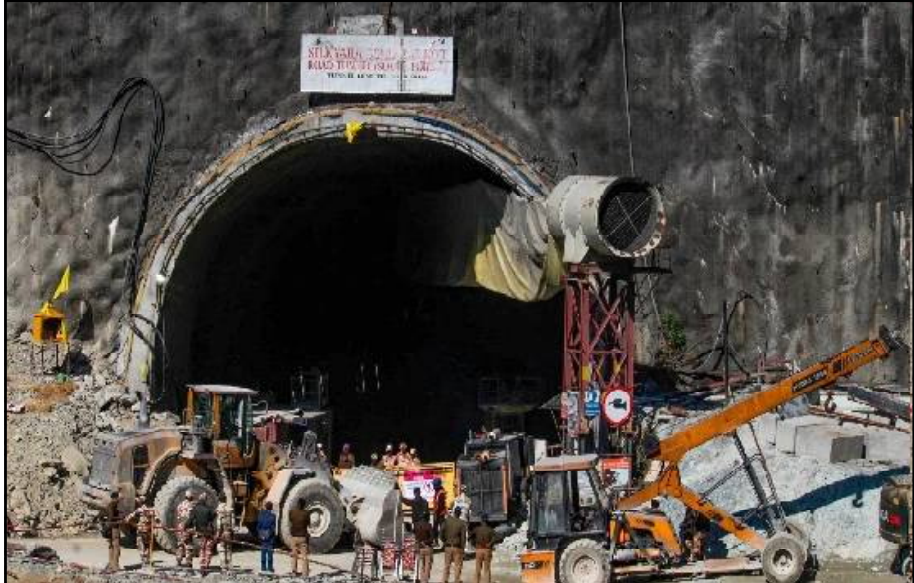
ଖୋଳା ହୋଇପାରିଛି । ମେସିନ୍ ଲାଗି ପ୍ଲଟଫର୍ମ ସ୍ଥିର ହେବା ପରେ ଡ୍ରମିଂ ପ୍ରକ୍ରିୟା ପୁଣି ଆରମ୍ଭ ହେବ । ଏଣୁ ରେଷ୍ଟ୍ରରେ ବାଧା ଉପୁଜିବାରୁ ଅଧିକାରୀଙ୍କ ଅନୁସାରେ ଗୁରୁବାର ଟନେଲରେ ଫଣିଥିବା ଶ୍ରମିକଙ୍କୁ ରାତି ପୁକା ଅପରେସନ ଶେଷ ଅପେକ୍ଷା ଆହୁରି ଦୀର୍ଘ ହୋଇଛି । ଏହା କରାଯିବାର ଥିଲା ।

ଭରତକାଶୀ ୨୩/୧୧ : ଭରତକାଶୀର ସିଲକ୍ୟାରା ଟନେଲରେ ୪୧ ଜଣଙ୍କ ଜୀବନ ବଞ୍ଚାଇବା ପାଇଁ ଉଦ୍ୟମ ଜାରି ରହିଛି । ତେବେ ଭାରତକାଶୀ ଦଳଙ୍କ ଆଗରେ ନୂଆ ସମସ୍ୟା ଦେଖାଦେଇଛି । ଯେଉଁ ପ୍ଲଟଫର୍ମରେ ଆମେରିକୀୟ ଅଗର ମେସିନ୍ କାମ କରୁଥିଲା ସେହି ପ୍ଲଟଫର୍ମଟି ବୋହାଲି ଯାଇଛି । ଏବେ ଏହି ପ୍ଲଟଫର୍ମକୁ ସ୍ଥିର କରିବା ପାଇଁ କାମ ଚାଲିଛି । ଏଥି ପାଇଁ ଅନେକ ସମୟ ଲାଗିପାରେ ବୋଲି ଅନୁମାନ କରାଯାଇଛି । ରେଷ୍ଟ୍ର ଅଧିକାରୀଙ୍କ ଅନୁସାରେ ପ୍ରକଳରେ ଏପର୍ଯ୍ୟନ୍ତ ୪୬.୮ ମିଟର ଖୋଳା ସରିଲାଣି, ତେବେ ଗୁରୁବାର କାମରେ ବାଧା ଦୁର୍ଘଟଣା ଘଟି ଯାଇଛି । ଏଣୁ ସାରା ଦିନରେ ମାତ୍ର ୧.୮ ମିଟର ହିଁ