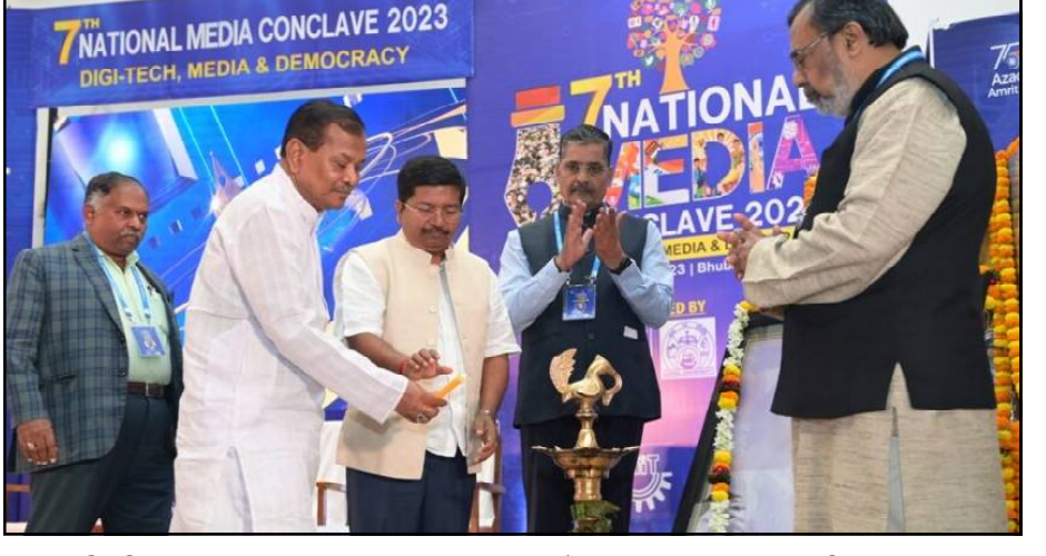
ଦେଇଆସିଛନ୍ତି ଏବଂ ଗଣତନ୍ତ୍ରର ଚତୁର୍ଥ ସ୍ତର ଭାବେ ନିଜର କର୍ତ୍ତବ୍ୟ ସମ୍ପାଦନ କରିବା ପାଇଁ ସରକାର କ୍ଷେତ୍ର ପ୍ରସ୍ତୁତ କରୁଛନ୍ତି ବୋଲି ସେ ମତବ୍ୟତ କରିଥିଲେ ।