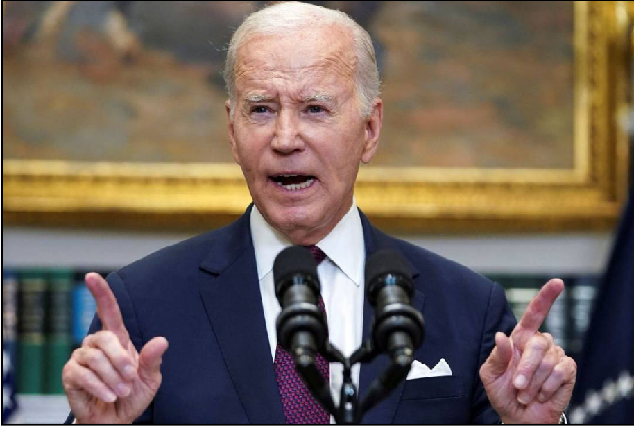
୧୯ ଦିନରେ ପର୍ଯ୍ୟନ୍ତ ଇସ୍ରାଏଲ-ପ୍ରତିଆକ୍ରମଣରେ କ୍ଷତିକରେ ଯାଇଛି ଶିଖର ସମେତ ୮ ହଜାର ଲୋକଙ୍କ ଜୀବନ । ଏବେ ପୁଣି ୩୫୫୫୫ ମୃତ୍ୟୁ ହୋଇସାରିଲାଣି । ସେପଟେ

ନୂଆଦିଲ୍ଲୀ, ୨୭/୧୦ : ସୁନ୍ଦର ପୁରିଛି ୨୦ ଦିନ । ଏହା ଭିତରେ ଆମେରିକା ରାଷ୍ଟ୍ରପତି ଜୋ ବାଇଡେନ ଏଭଳି ଏକ ବୟାନ ଦେଇଛନ୍ତି ଯାହାକୁ ନେଇ ହୁଏତ ଆମାମା ଦିନରେ ଭାରତ ଓ ଆମେରିକା ସମ୍ପର୍କ ବିବାଦଯୋଗୁ ଆସିପାରେ । ନିକଟରେ ଭାରତରେ ଆୟୋଜିତ କି-୨୦ ସମ୍ମିଳନୀରେ ଏହି କରିତର ନିର୍ମାଣ ପାଇଁ ଘୋଷଣା କରାଯାଇଥିଲା । କୁହାଯାଉଛି ଚୀନର ବିଆରଆଇକୁ କଡ଼ା ଚକ୍ର ଦେବ ଆରମ୍ଭପରିସି । ଇନ୍ଦ୍ର ଓ ନର୍ଦ୍ଦନ କରିତର ଭାରତ ପାଇଁ ଦେଶ ଗୁରୁତ୍ୱହୀନ କରୁଛି । ଯେଉଁଠି ଇନ୍ଦ୍ର କରିତର ଭାରତକୁ ଗଲୁ ଦେଶ ସହ ଯୋଡ଼ିବ । ନର୍ଦ୍ଦନ କରିତର ଦ୍ୱାରା ଗଲୁ ଦେଶମାନଙ୍କୁ ସୁରୋପ ସହ ଯୋଡ଼ିବ ।