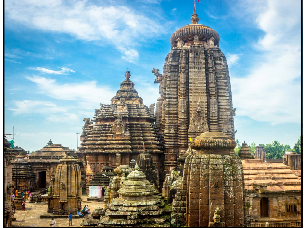
ଭୁବନେଶ୍ୱର, ୨୭/୧୦ (ନି.ପ୍ର): ପୁଣି ଭୋକ ଉପାସରେ ପ୍ରଭୁ ଲିଙ୍ଗରାଜ । ସେବାୟତଙ୍କ ବିବାଦରେ ବଳି ପଡ଼ିଛି ଠାକୁରଙ୍କ ନୀତିକାନ୍ତି । ବୁଧବାର ସକାଳୁ କେବଳ ସାହାଣମେଳା ଦର୍ଶନ ଦିନା ଅନ୍ୟ କୌଣସି ନୀତିକାନ୍ତି ହୋଇନି । ଅବକ୍ତା ମଧ୍ୟ ବାହାରିନି । ଅବକାଚକ ସଂପର୍କିତ ମାଲିକଙ୍କୁ ଏତେ ସମୟ ଧରି ସମିତି ଭୋକରେ ରଖାଯିବାକୁ ନେଇ ବ୍ୟଥିତ ଭକ୍ତ ପ୍ରାଣ । ଏହାକୁ ନେଇ ବିଭିନ୍ନ ମହଲରେ ଅସନ୍ତୋଷ ଚେଲୁଛି । ସେବାୟତଙ୍କ ଭିତରେ

ସମସ୍ତ ଅଭାବ ଓ ବିବାଦକୁ ବର୍ଷର ବିଭିନ୍ନ ସମୟରେ ଲିଙ୍ଗରାଜଙ୍କ ନୀତିରେ ବିଚ୍ଛିନ୍ନ ହେଉଛି । ସେବାୟତଙ୍କ ଭିତରେ ଜିଦାକିଦି ସ୍ଥିତି ଓ ଅହମ୍ ଲଢ଼େଇ ପାଇଁ ପୂର୍ବରୁ ଅନେକ ଥର ଉପାସରେ ରହିଛନ୍ତି ଲିଙ୍ଗରାଜ । ହେଲେ ଏଥର ବିବାଦର କାରଣ ହେଉଛି ଜମି । ଭୁବନେଶ୍ୱର ନୂଆଗାଁ ମୌଜା ଗଢ଼ୁଆ ନାଳ ନିକଟରେ ଥିବା ଲିଙ୍ଗରାଜଙ୍କ ୨ ଏକର ୬୩ ଟିସମିଲ ବେଦଯୋଗ୍ୟ ଜମିରେ ଦୋକାନ ▶▶ପୃଷ୍ଠା ୭