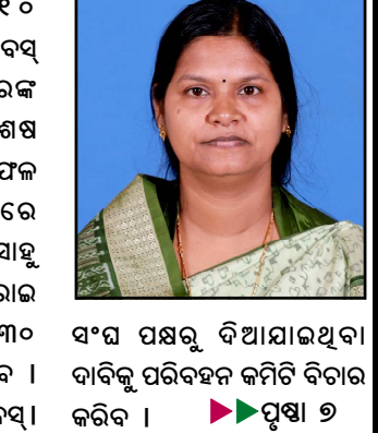
ସଂଘ ପକ୍ଷରୁ ଦିଆଯାଇଥିବା ଦାବିକୁ ପରିବହନ ମନ୍ତ୍ରୀ ବିଚାର କରିବେ । ▶▶ପୃଷ୍ଠା ୭

ଭୁବନେଶ୍ୱର, ୨୭/୧୦ (ନି.ପ୍ର): ରାଜ୍ୟ ଉତ୍ତରାଳ ବସ୍ ମାଲିକ ସଂଘ ଓ ସରକାରଙ୍କ ମଧ୍ୟରେ ଆଲୋଚନା ଶେଷ ହୋଇଛି । ଆଲୋଚନା ସଫଳ ହୋଇଥିବା ବେଳେ ପରେ ପରିବହନ ମନ୍ତ୍ରୀ ତୁଳସି ସାହୁ ପ୍ରତିଶ୍ରୁତି ରଖିଛନ୍ତି । ଉତ୍ତରାଳ ବସ୍ ମାଲିକ ସଂଘ ଆସନ୍ତା ୩୦ ବୁଧା ଲିଖିତ ଦାବି ଜଣାଇବେ । ବୁଧା ଲିଖିତ ଦାବି ଜଣାଇବେ ।