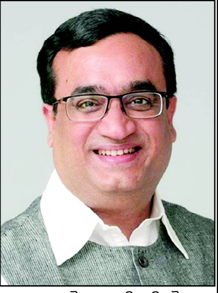
ସଦସ୍ୟଙ୍କ ସହ ବୈଠକ କରୁଛନ୍ତି । ଏହି ବୈଠକରେ ଆଶାଯାଏ ଯେ ନିଷ୍ପତ୍ତି ହେବ । ଏହାର ମଧ୍ୟରେ ଏହି ଘୋଷଣା ହୋଇଛି ।

ନୂଆଦିଲ୍ଲୀ, ୦୧/୧୦ : ଏଆଇସିସି କୋଷାଧ୍ୟକ୍ଷ ଭାବରେ ନିଯୁକ୍ତ ହେଲେ ଅଜୟ ମାକନ । କଂଗ୍ରେସ ମହାସଭାରେ କେବି ବେଣ୍ଟେନୋପାଲ ଅଜୟ ମାକନଙ୍କୁ ଏଆଇସିସି କୋଷାଧ୍ୟକ୍ଷ ନିଯୁକ୍ତ କରିଛନ୍ତି । ତାଙ୍କୁ ପୃଥିବୀ ବ୍ୟାପକ ସ୍ଥାନରେ କୋଷାଧ୍ୟକ୍ଷ ଭାବରେ ନିଯୁକ୍ତ କରାଯାଇଛି । ଏହି ନିଯୁକ୍ତି ଉପରେ କଂଗ୍ରେସ ଅଧ୍ୟକ୍ଷ ମନୁକାଣ୍ଟ୍‌ନ ଖତଗେ ମୋହର ମାରିଛନ୍ତି । ମାକନଙ୍କ ନିଯୁକ୍ତି ଅନ୍ତରାଳ ମତଭେଦକୁ ସମାଧାନ, ଦଳର ଏକତାକୁ ମଜବୁତ କରିବା ଏବଂ ରାଜସ୍ଥାନରେ କଂଗ୍ରେସରେ ସ୍ଥିରତା ଆଣିବାକୁ ଏକ ରଣନୀତିକ ପଦକ୍ଷେପ ଭାବରେ ଦେଖାଯାଇଛି । ଦଳର କଣେ ନେତାଙ୍କ କହିବା ଅନୁଯାୟୀ ସାଂଗଠନିକ ଅନୁଭବ ଦ୍ୱାରା କର୍ମକର୍ତ୍ତା ଶକ୍ତି ମିଳିବ ଏବଂ ଦଳକୁ ମଜବୁତ କରିବ । ଏହି ପଦକ୍ଷେପ ବିଦ୍ରୋହୀ କଂଗ୍ରେସ ବିଧାୟକଙ୍କ ଦ୍ୱାରା ଉଠାଯାଇଥିବା ପ୍ରସଙ୍ଗକୁ ସମୋ୍ତ କରିବା ଏବଂ ସମାଧାନ କରିବା ପାଇଁ ପାର୍ଟିର ପ୍ରତିବଦ୍ଧତାକୁ ମଧ୍ୟ ସଙ୍କେତ ଦେଉଛି । ସୁଚନାଆଉଜି, ଅଜୟ ମାକନ ରବିବାର ଛତିଶଗଡ଼ରେ ପହଞ୍ଚି ଏବଂ ସେ ରାୟପୁରରେ କଂଗ୍ରେସ କମିଟିର ସଦସ୍ୟଙ୍କ ସହ ବୈଠକ କରୁଛନ୍ତି । ଏହି ବୈଠକରେ ଆଶାଯାଏ ଯେ ନିଷ୍ପତ୍ତି ହେବ । ଏହାର ମଧ୍ୟରେ ଏହି ଘୋଷଣା ହୋଇଛି ।