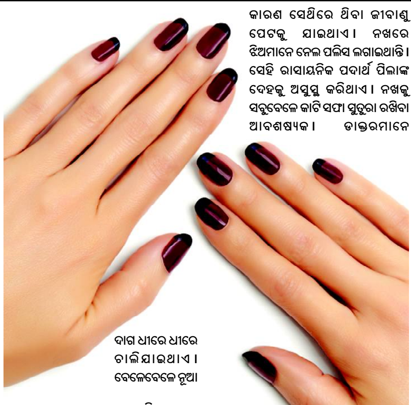
କାରଣ ସେଥିରେ ଥିବା କାର୍ବାଣ୍ଡ ପେଟକୁ ଯାଇଥାଏ। ନିଶ୍ଚିତ ରଖିବା ପାଇଁ ଆପଣଙ୍କର ଶରୀରକୁ ବିଭିନ୍ନ ରୋଗରୁ ରକ୍ଷା କରିବା ପାଇଁ ଆପଣଙ୍କର ଶକ୍ତିକୁ ବୃଦ୍ଧି କରିଥାଏ।

ପ୍ରାୟତଃ ପିଲାଠାରୁ ବଡ଼ କେହି କେହି ନିଶ୍ଚିତ ରଖିବା ପାଇଁ ପସନ୍ଦ କରନ୍ତି। ବିଶେଷ କରି ଝିଅ ପିଲାମାନେ ହାତକୁ ନିଶ୍ଚିତ ରଖିବା ପାଇଁ ପସନ୍ଦ କରନ୍ତି। ନିଶ୍ଚିତ ରଖିବା ପାଇଁ ଆପଣଙ୍କର ଶରୀରକୁ ବିଭିନ୍ନ ରୋଗରୁ ରକ୍ଷା କରିବା ପାଇଁ ଆପଣଙ୍କର ଶକ୍ତିକୁ ବୃଦ୍ଧି କରିଥାଏ।