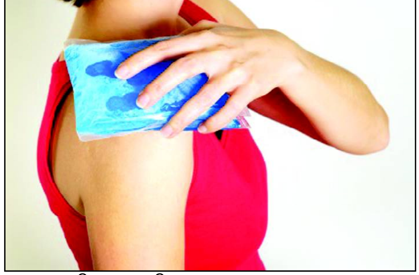
ଆପଣଙ୍କ ଶରୀର ମଧ୍ୟରେ ବ୍ୟବହାର କରି କରନ୍ତୁ। ଏହାକୁ ପ୍ରତ୍ୟକ୍ଷ ଭାବରେ ଦୂରା ସମ୍ପର୍କରେ ଆପଣଙ୍କୁ ନାହିଁ। ବରଫ ଯନ୍ତ୍ରଣା କରନ୍ତୁ।