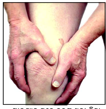
ଆବଶ୍ୟକ ସ୍ଥଳେ ବରଫ ଥଳା କିମ୍ବା ଗରମ ଥିବା କିମ୍ବା ବରଫ ଥଳା ବ୍ୟବହାର କରନ୍ତୁ।

ଚଳପ୍ରଚଳ କ୍ଷେତ୍ରରେ ବାଧା ଉତ୍ପନ୍ନ ହୋଇଥାଏ। ତେବେ ଆପଣ ସମସ୍ୟାକୁ ଅଧିକ ଗୁରୁତର ହେବାକୁ ନଦେଇ ଯଥାଶୀଘ୍ର ମେଡ଼ିକାଲ ପରାମର୍ଶ ଗ୍ରହଣ କରନ୍ତୁ। ଆପଣ ଯେତେ ଶୀଘ୍ର ଚିକିତ୍ସା ପ୍ରକ୍ରିୟା ଗ୍ରହଣ କରିବେ ସେତେ ଶୀଘ୍ର ଆପଣ ସୁସ୍ଥ ହେବେ। ଆବଶ୍ୟକ ସ୍ଥଳେ ଗରମ ଥିବା କିମ୍ବା ବରଫ ଥଳା ବ୍ୟବହାର କରନ୍ତୁ: