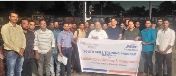
କରୁଥିଲେ । ଯୁବକମାନଙ୍କର ତାଲିମ ଏବଂ ଦକ୍ଷତା ବିକାଶ ସେମାନଙ୍କୁ ବନ୍ଦର ଭିତ୍ତିକ କାର୍ଯ୍ୟ ପରିଚାଳନା ଏବଂ ଲଳିତା ସହାୟତା କୌଶଳ ବୃଦ୍ଧି ପାଇଁ ଦକ୍ଷ କୁଶଳୀ ଏବଂ ଅର୍ଦ୍ଧ-କୁଶଳୀ ବର୍ଗରେ ନିଯୁକ୍ତି ସୁଯୋଗ ଆଣିଦେବରେ ସହାୟକ ହେବ, ଏଥିସହିତ ଉପରୋକ୍ତ କ୍ଷେତ୍ରରେ କାର୍ଯ୍ୟ

ପାରାଦ୍ୱୀପ, ୩୦/୦୮ (ନି.ପ୍ର): କେ.ଏସ.ଡବ୍ଲ୍ୟୁ.ଫାଉଣ୍ଡେସନ୍ ସାମାଜିକ ଦାୟିତ୍ୱବୋଧ କାର୍ଯ୍ୟକାରୀ ଅନୁଷ୍ଠାନ କେ.ଏସ.ଡବ୍ଲ୍ୟୁ.ଫାଉଣ୍ଡେସନ୍ ଦ୍ୱାରା ଜଗତସିଂହପୁର ଏବଂ ପାଖ ଜିଲ୍ଲାର ବେରୋଜଗାର ଯୁବକ ମାନଙ୍କ ପାଇଁ ବନ୍ଦର ଭିତ୍ତିକ କାର୍ଯ୍ୟ ପରିଚାଳନା ଏବଂ ଲଳିତା ସହାୟତା କୌଶଳ ବୃଦ୍ଧି ତାଲିମ ଓ ନିଯୁକ୍ତି ସହାୟତା ପ୍ରଦାନ କରିବା ଦିଗରେ କାର୍ଯ୍ୟ