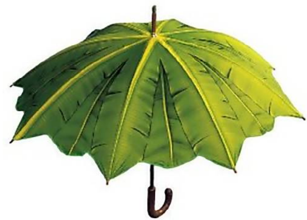
ସାଇକ୍ଲ ଛତା ମଧ୍ୟ ଏବେ ଲୋକପ୍ରିୟରେ । କାରଣ ଏହା ଆକାରରେ ଛୋଟ ହୋଇଥିବା ସହ ବ୍ୟାଗରେ ବେଶ୍ ସହଜରେ ନେଇହୁଏ ।

ଯୁବତୀ ତଥା ମହିଳାମାନେ କେବଳ ବେଶପୋଷାକ ବାବଦରେ ନୁହେଁ, ବରଂ ବ୍ୟାଗ, ଛତା ଓ କାନଫୁଲ କିଣିବାବେଳେ ମଧ୍ୟ ସଚେତନ । ଏଥରକ ବର୍ଷାଦିନେ ନିମନ୍ତେ ବଜାରକୁ ବିଭିନ୍ନ ଡିଜାଇନର ଛତା ଆସିଛି । ବିଭିନ୍ନ ବର୍ଗର ମହିଳା ତଥା ଯୁବତୀଙ୍କ ପାଇଁ ବିଶେଷ ଝାଉଳରେ ଛତା ଉପଲବ୍ଧ । ସ୍ୱେକାୟାର ଓଭାଲ, ପ୍ରିପେଡ୍ ତଥା କ୍ଲବ୍ ନାମରେ ଛତା ଅନ-ଲାଜନ ଓ ବଜାରରେ ବିକ୍ରି ହେଉଛି କର୍ମକାରୀମାନେ ଷ୍ଟୋରର ଛତାକୁ ଅଧିକ ପସନ୍ଦ କରୁଥିବାର ଦେଖାଯାଉଛି । ଏସବୁ ୪୦୦ରୁ ୧୫୦୦ ଟଙ୍କାରେ ମଧ୍ୟରେ ବିକ୍ରି ହେଉଥିବାବେଳେ ପାସବୁକ