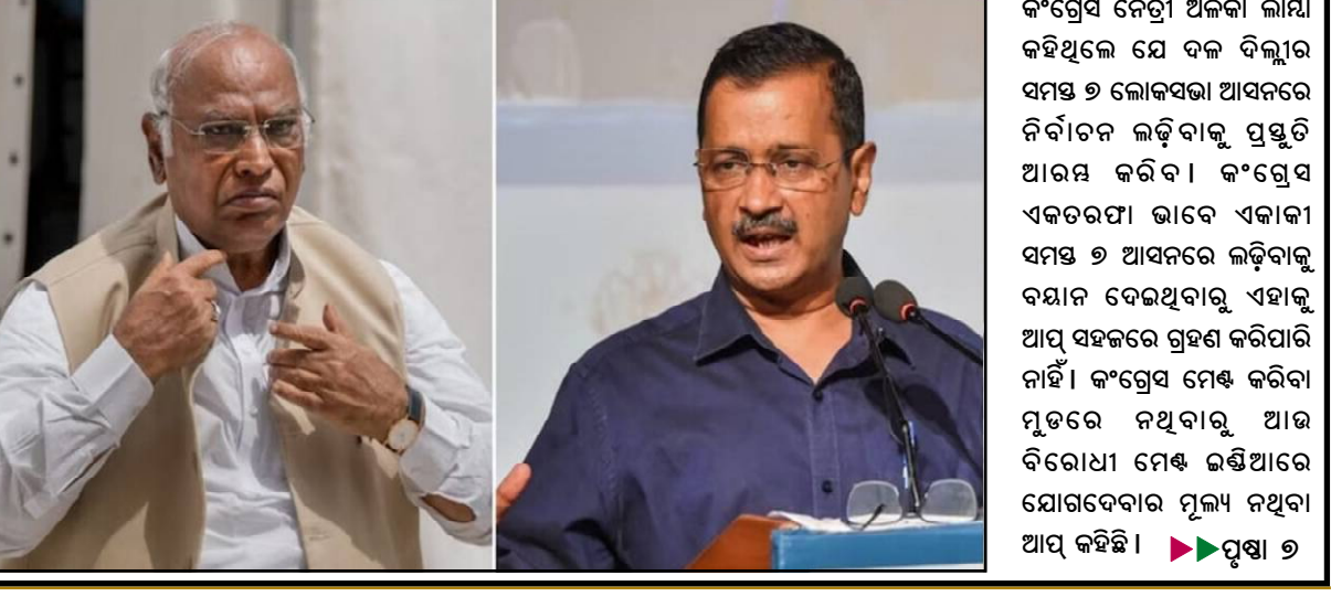
କଂଗ୍ରେସ ନେତ୍ରୀ ଅକଳା ଲାୟା କହିଥିଲେ ଯେ ଦଳ ବିଲ୍ଲୀର ସମସ୍ତ ୭ ଲୋକସଭା ଆସନରେ ନିର୍ବାଚନ ଲଢ଼ିବାକୁ ପ୍ରସ୍ତୁତି ଆରମ୍ଭ କରିବ । କଂଗ୍ରେସ ଏକତରଫା ଭାବେ ଏକାକୀ ସମସ୍ତ ୭ ଆସନରେ ଲଢ଼ିବାକୁ ସମ୍ମାନ ଦେଉଥିବାରୁ ଏହାକୁ ଆପ ସହଜରେ ଗ୍ରହଣ କରିପାରି ନାହିଁ । କଂଗ୍ରେସ ମେଣ୍ଟ କରିବା ମୁତବେ ନଥିବାରୁ ଆଉ ବିରୋଧୀ ମେଣ୍ଟ ଇଣ୍ଡିଆରେ ଯୋଗଦେବାର ମୂଲ୍ୟ ନଥିବା ଆପ କହିଛି ।

ନୂଆଦିଲ୍ଲୀ, ୧୬/୦୮ : ବିକେପି ବିରୋଧରେ ଏକାଠି ହୋଇଥିବା ବିରୋଧୀ ମେଣ୍ଟ ଇଣ୍ଡିଆରେ ଫାଟ । ଚୌଧୁରୀ ଅଧିବେଶ ବେଳେ ଓ ଏହା ପୂର୍ବରୁ ପରସ୍ପରକୁ ସମର୍ଥନ କରୁଥିବା ଆପ ଏବଂ କଂଗ୍ରେସ ମଧ୍ୟରେ ଏବେ ତିକ୍ତତା ଆରମ୍ଭ ହୋଇଛି । ସ୍ଥିତି ଏପରି ହୋଇଛି ଯେ ଆସନ୍ତା ୩୧ରେ ବସିଥିବା ଥିବା ଇଣ୍ଡିଆର ତୃତୀୟ ବୈଠକରେ ଆପ ଯୋଗଦେବାର ଆଉ ଆବଶ୍ୟକତା ନଥିବା ମଧ୍ୟ କହିବାକୁ ପଛାଇ ନାହିଁ । ପ୍ରଥମେ