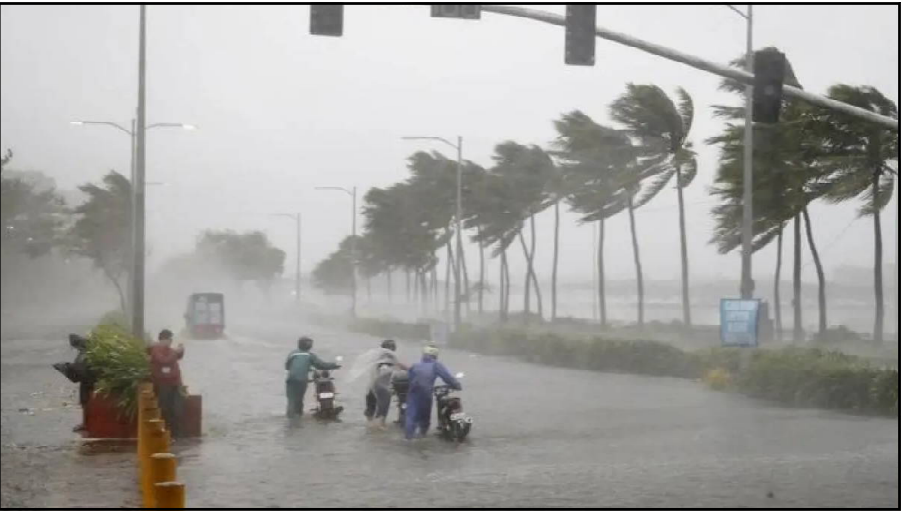
ମାଲକାନଗିରି ଜିଲ୍ଲାରେ କେତେକ ସମ୍ଭାବନା ରହିଛି । ଏହି ସବୁ ପର୍ଯ୍ୟନ୍ତ ବର୍ଷା ହୋଇପାରେ । ଗୁଆରେ ପ୍ରବଳ ବର୍ଷା ହେବାର ଜିଲ୍ଲାରେ ୭ରୁ ୧୧ ସେଣ୍ଟିମିଟର ସେହିପରି

ଭୁବନେଶ୍ୱର, ୧୬/୦୮ (ନି.ପ୍ର): ଆସନ୍ତା ୧୮ ତାରିଖ ବେଳକୁ ବଙ୍ଗୋପସାଗରରେ ସୃଷ୍ଟି ହେବ ଲଘୁଚାପ କ୍ଷେତ୍ର । ଏନେଇ ପୂର୍ବାନୁମାନ କରିଛି ଭୁବନେଶ୍ୱର ଆଞ୍ଚଳିକ ପାଣିପାଗ କେନ୍ଦ୍ର । ଏନେଇ ଭୁବନେଶ୍ୱରରୁ ସୂଚନା ଦିଆଯାଇଛି । ପାଣିପାଗ କେନ୍ଦ୍ରର ସୂଚନା ଅନୁସାରେ, ଉତ୍ତର-ପୂର୍ବ, ପୂର୍ବକେନ୍ଦ୍ରୀୟ ବଙ୍ଗୋପସାଗରରେ ସୃଷ୍ଟି ହେବ ସକ୍ରିୟ ଅଛି । ଏହି ସୃଷ୍ଟି ହେବ ସମୁଦ୍ର ମଧ୍ୟରେ ବାୟୁମଣ୍ଡଳର ୪.୫ ରୁ ୭.୬ ମି.ମି ଉଚ୍ଚତା ମଧ୍ୟରେ ସକ୍ରିୟ ରହିଛି । ଏହି ସୃଷ୍ଟି ହେବ ପ୍ରଭାବରେ ଉତ୍ତର ବଙ୍ଗୋପସାଗରରେ ୧୮ ତାରିଖ ବେଳକୁ ଲଘୁଚାପ କ୍ଷେତ୍ର ସୃଷ୍ଟି ହେବାର ସମ୍ଭାବନା ରହିଛି । ଅନ୍ୟପକ୍ଷରେ ଆଜିଠୁ ୩ ଦିନ ପର୍ଯ୍ୟନ୍ତ ରାଜ୍ୟରେ କେତେକ ଜିଲ୍ଲାରେ ପ୍ରବଳ ବର୍ଷା ହେବାର ସମ୍ଭାବନା ରହିଛି । ଏଥିପାଇଁ ସେଲୋ ଝାଞ୍ଜି କାରି କରିଛି ଭୁବନେଶ୍ୱର ଆଞ୍ଚଳିକ ପାଣିପାଗ କେନ୍ଦ୍ର । ୧୭ ତାରିଖରେ କେନ୍ଦ୍ରରେ, ମୟୂରଭଞ୍ଜ, ବାଲେଶ୍ୱର, ଯାଜପୁର, ଭଦ୍ରକ, କେନ୍ଦ୍ରାପଡ଼ା, କଟକ, ଜଗତସିଂହପୁର, ଖୋର୍ଦ୍ଧା, ପୁରୀ, ନୟାଗଡ଼, ଗଞ୍ଜାମ, ଗଜପତି, ରାୟଗଡ଼ା, ବଲାଙ୍ଗିର, ନବରଙ୍ଗପୁର, କୋରାପୁଟ ଓ