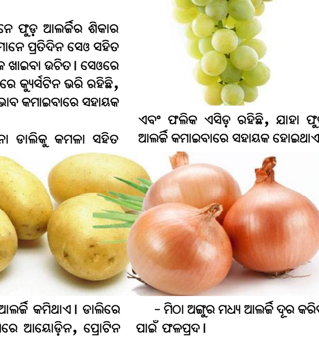
ଏବଂ ଫଳିକ ଏସିଡ୍ ରହିଛି, ଯାହା ଫୁଡ଼ ଆଲର୍ଜି କମାଇବାରେ ସହାୟକ ହୋଇଥାଏ । - ମିଠା ଅଳ୍ପ ମଧ୍ୟ ଆଲର୍ଜି ଦୂର କରିବା ପାଇଁ ଫଳପ୍ରଦ ।

ରହିବା ଉଚିତ୍ । - ଯେଉଁମାନେ ଫୁଡ଼ ଆଲର୍ଜିର ଶିକାର ହେଉଛନ୍ତି, ସେମାନେ ପ୍ରତିଦିନ ସେହି ସହିତ ଆଳୁଏବଂ ପିଆଜ ଖାଇବା ଉଚିତ । ସେଠାରେ ପ୍ରଚୁର ପରିମାଣରେ କ୍ୟୁର୍ବିଟିନ ଭରି ରହିଛି, ଯାହା ଆଲର୍ଜି ପ୍ରଭାବ କମାଇବାରେ ସହାୟକ ହୋଇଥାଏ । - ଦୁଇ ଗିନା ତାଲିକୁ କମଳା ସହିତ