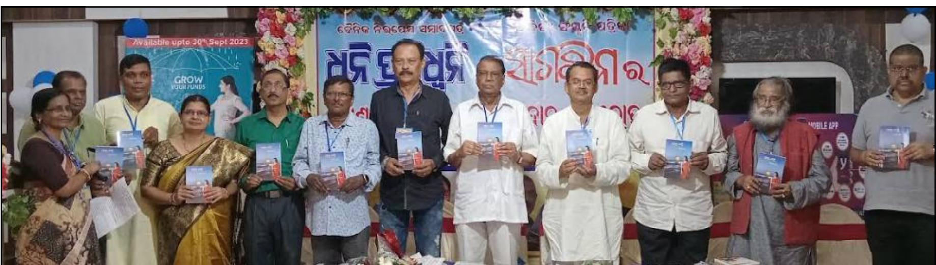
ଧୂନ ପ୍ରତିଧୂନ ଓ ସାଗରିକାର ୩୪ତମ ବାର୍ଷିକ ଉତ୍ସବ ପାଳନ ଅବସରରେ ସୁବର୍ଣ୍ଣଶ୍ରୀ ପ୍ରକାଶନୀ ଦ୍ୱାରା ପ୍ରକାଶିତ ପାଠାୟନ ଦାସକ ରଞ୍ଜ ପୁସ୍ତକ 'ସାଗର କଇଁ' ଅତିଥିମାନଙ୍କ ଦ୍ୱାରା ଉନ୍ମୋଚିତ ।