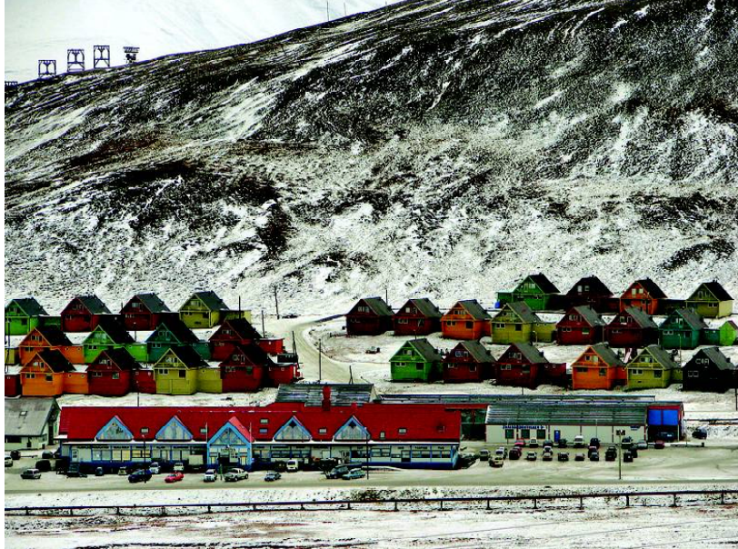
ବିଶ୍ଵର ପ୍ରତ୍ୟେକ ରାଷ୍ଟ୍ରର ଭିନ୍ନ ଭିନ୍ନ ନିୟମ ପ୍ରଣୟନ କରାଯାଇଛି । କେତେକ ରାଷ୍ଟ୍ର ନାଗରିକଙ୍କୁ ଅନେକ ସ୍ଵାଧୀନତା ମିଳିଥିବା ବେଳେ ଅନ୍ୟ କେତେକ ରାଷ୍ଟ୍ରରେ ଏବେ ମଧ୍ୟ ଏକଛତ୍ରବାଦ ଶାସନର ଦୃଶ୍ୟ

ପରିଲକ୍ଷିତ ହେଉଛି । ତେବେ ନରଝେର ଲାଙ୍ଗେୟେରବନ୍ ସହରର ଏକ ଅଜବ ନିୟମ ଅନୁସାରେ ଆଖ୍ୟାତ କରାଯାଇଛି । କାରଣ ନରଝେ ସରକାର ଏହି ସହରରେ