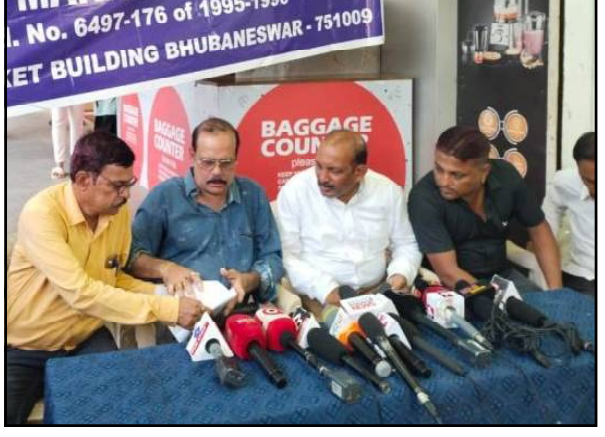
ଭୁବନେଶ୍ୱର, ୩/୦୮ (ନି.ପ୍ର): ଦୀର୍ଘ ଦିନ ବନ୍ଦ ରହିବା ପରେ ରିଟେଲ୍ ବୋକାନ ଗୁଡ଼ିକ ଯୁନିଟ-୨ ମାର୍କେଟ୍ ବିଲ୍ଡିଂ ମାର୍କେଟ୍ ବିଲ୍ଡିଂ ଖୋଲିଥିଲେ ବି

ଗୁଡ଼ିକ ଖୋଲାଯାଇନାହିଁ । ସେଠାରେ ବିଭିନ୍ନ ଆଲୋଚନା କାରି ରହିଛି। ବିଏମସି ପକ୍ଷରୁ ମଧ୍ୟ ଏପର୍ଯ୍ୟନ୍ତ କୌଣସି ଲିଖିତ ପ୍ରତିଶ୍ରୁତି ମିଳି ନଥିବା ଜଣାପଡ଼ିଛି। ସୂଚନାଯୋଗ୍ୟ ଯେ ଭୁବନେଶ୍ୱର ଯୁନିଟ-୨ ମାର୍କେଟ୍ ବିଲ୍ଡିଂରୁ ଉଠା ବୋକାନୀଙ୍କୁ ଉଚ୍ଚଦ ବାବି ନେଇ ଗତ ଜୁଲାଇ ୧୭ ତାରିଖରୁ ମାର୍କେଟ୍ ବିଲ୍ଡିଂ ବନ୍ଦ ରହିଛି । ବିଏମସି ପକ୍ଷରୁ କୌଣସି ପଦକ୍ଷେପ ନିଆଯାଇନଥିବାରୁ ଏହାର ପ୍ରତିବାଦରେ ସେଠାରେ ମାର୍କେଟ୍ ବିଲ୍ଡିଂ ସଂଘ ପକ୍ଷରୁ ବନ୍ଦ ତାକରା ଦିଆଯାଇଥିଲା।