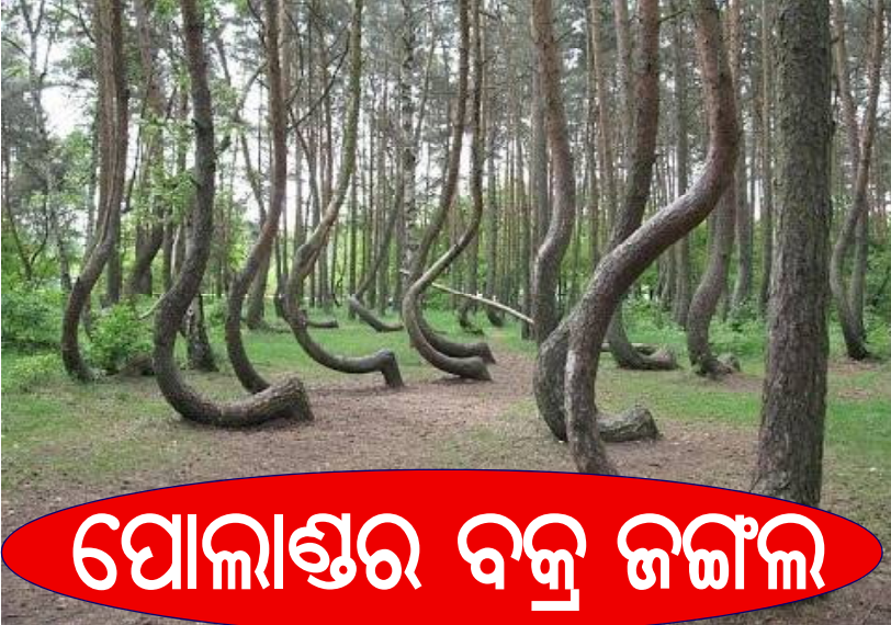
ପୋଲାଣ୍ଡର ବକ୍ର ଜଙ୍ଗଲ

ପୂର୍ବରୁ ଲଗାଯାଇଥିଲା । ଗଛ ଗୁଡ଼ିକ ୯୦ ଡିଗ୍ରୀରେ ମୋଡ଼ି ହୋଇଥିବାବେଳେ ୩୦୦ ୯ ଫୁଟ ପର୍ଯ୍ୟନ୍ତ ଏପରି ମୋଡ଼ି ରହିବା ପରେ ପୁଣି ଥରେ ଉପରକୁ ବଢ଼ିଛି । ସବୁ ବୃକ୍ଷ ଉପରକୁ ମୋଡ଼ି ରହିଛନ୍ତି । କେତେକଙ୍କ ମତରେ ଏହି ଗଛ ଲଗାଯିବା ପରେ ଦ୍ୱିତୀୟ ବିଶ୍ୱଯୁଦ୍ଧ ଆରମ୍ଭ ହୋଇଯାଇଥିଲା । ସେହି ସମୟରେ ଘୋଳ ଗୁଡ଼ିକ ବାରମ୍ବାର ସେହି ବାଟ ଦେଇ ଯୁଦ୍ଧ କ୍ଷେତ୍ରକୁ ଯାଉଥିବାବେଳେ ଚା'ର ପ୍ରଭାବରେ ଗଛ ଗୁଡ଼ିକର ଏପରି ଅବସ୍ଥା ହୋଇଛି । ଆଉ କେତେକଙ୍କ ମତରେ ସ୍ତ୍ରୀମାନେ ଲୋକମାନେ ଆସବାବପତ୍ର ତିଆରି କରିବା ପାଇଁ ଗଛକୁ ଏପରି ଆକାର ଦେଇଛନ୍ତି । କେତେକ ଏହାକୁ