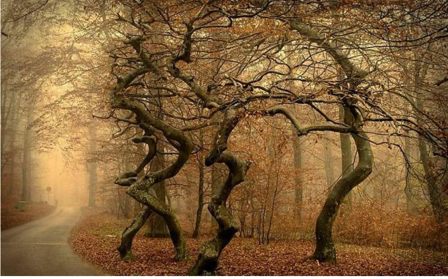
ଅଧିକାଂଶ କାର୍ଯ୍ୟ ବୋଲି କହିଛନ୍ତି । ପୋଲାଣ୍ଡର ନୋବେ ସଜାରଜନାବେ ନାମକ ଏକ ଗାଁରେ ଏହି ନିଆରା ଜଙ୍ଗଲଟି ରହିଛି । ବୃକ୍ଷଗୁଡ଼ିକୁ ଦ୍ୱିତୀୟ ବିଶ୍ୱଯୁଦ୍ଧ ଆରମ୍ଭ ହେବା ପରେ ପ୍ରଭାବ ବୋଲି ବି କହିଛନ୍ତି ।

ଆମ ପୃଥିବୀରେ ଏପରି ଅନେକ ରହସ୍ୟ ରହିଛି, ଯାହାକି ଏବେକି ଅସମ୍ଭାବ୍ୟ ହୋଇ ରହିଛି । ପୋଲାଣ୍ଡର ଜୁକଟ ଫରେଷ୍ଟ ବା ବକ୍ର ଜଙ୍ଗଲ ଏପରି ଏକ ରହସ୍ୟ । ଏହି ଜଙ୍ଗଲରେ ପାଖାପାଖି ୪୦୦ ବୃକ୍ଷ ୯୦ ଡିଗ୍ରୀରେ ମୋଡ଼ି ହୋଇ ରହିଛି । ଏହି ବୃକ୍ଷଗୁଡ଼ିକ କାହିଁକି ମୋଡ଼ି ହୋଇ ରହିଛି ତା'ର ଅନେକ ଥିଏରୀ ଦିଆଯାଇଛି, କିନ୍ତୁ ଏପର୍ଯ୍ୟନ୍ତ ସଠିକ୍ ଭାବେ କିଛି କୁହାଯାଇ ପାରିନି । କେତେକ ଲୋକ ଏହାକୁ ଅନ୍ୟ ଗ୍ରହରୁ ଆସିଥିବା ପ୍ରାଣୀଙ୍କ କାର୍ଯ୍ୟ ବୋଲି କହିଛନ୍ତି । ପୋଲାଣ୍ଡର ନୋବେ ସଜାରଜନାବେ ନାମକ ଏକ ଗାଁରେ ଏହି ନିଆରା ଜଙ୍ଗଲଟି ରହିଛି । ବୃକ୍ଷଗୁଡ଼ିକୁ ଦ୍ୱିତୀୟ ବିଶ୍ୱଯୁଦ୍ଧ ଆରମ୍ଭ ହେବା