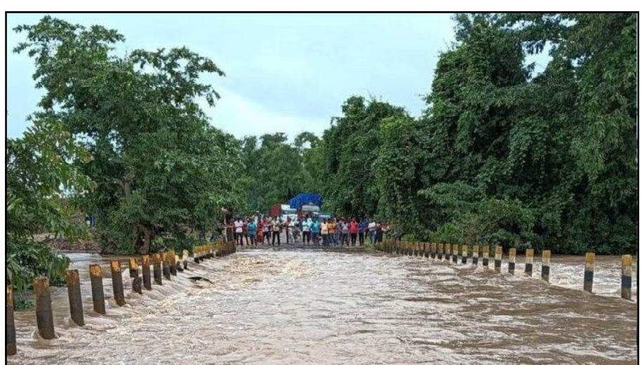
ରାଜପଥରେ ଯାତାୟତ ୦ପ୍ । ସେହିପରି ଲଗଣ ବର୍ଷା ଯୋଗୁଁ କାଳିମେଳା ବାହ୍ୟ ଜଗତକୁ ବିଚ୍ଛିନ୍ନ ହୋଇଯାଇଛି । ମାଲକାନଗିରି-ମୋଟୁ ୩୨୬ ନମ୍ବର ଜାତୀୟ ରାଜପଥରେ ଥିବା ପୋଲ ଓ କାଳିମେଳା-ପଡ଼ିଆ ମୁଖ୍ୟ ରାସ୍ତାରେ ଥିବା କନ୍ୟାଶ୍ରମ ପୋଲ ଉପରେ ବନ୍ୟା ଜଳ ପ୍ରବାହିତ ହେଉଛି ।