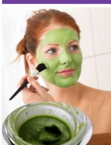
ଚାକହେଉ ଦୂର କରିବାରେ ପୁଦିନା ପତ୍ର ବେଶ୍ ଉପକାରୀ । ଯଦି ଆପଣଙ୍କର

ଏହି ସମସ୍ୟା ରହିଛି ତେବେ କିଛି ପୁଦିନା ପତ୍ରକୁ ଅଳ୍ପ ପାଣିରେ ଭଲ ଭାବେ ଫୁଟେଇ ଦିଅନ୍ତୁ । ଏହି ପତ୍ରକୁ ଭଲ ଭାବେ ବାଟି ସେଥିରେ ଅଳ୍ପ ହଳଦୀଗଣ୍ଡ ମିଶାଇ ପୁହଁରେ ଲଗାନ୍ତୁ । ଆଲୁକା ଚିପ ସାହାଯ୍ୟରେ ଧୀରେ ଧୀରେ ଚାକହେଉ ଥିବା ସ୍ଥାନକୁ ରଗଡ଼ନ୍ତୁ । ଅଳ୍ପ ସମୟ ରଖିବା ପରେ ଅଳ୍ପ ପାଣିରେ ପୁହଁ ଧୋଇ ଦିଅନ୍ତୁ । ପୁଦିନା ପତ୍ରରେ ଆର୍ଦ୍ରତାକୁ ହଟାଇବା ପାଇଁ ତରୁ ଭରପୁର ମାତ୍ରାରେ ରହିଛି । ତେଣୁ ଏହାର ପେଟକୁ ଫେସ୍ୟାକ୍ ଭାବେ ଲଗାଇବା ଦ୍ୱାରା ଗୁଣ ଭାବେ ଲଗାଇବା ଦ୍ୱାରା ଗୁଣ ଏବଂ କଳାଦାଗ ଆଦି ଦୂର ହୋଇଥାଏ । ପୁଦିନା ପତ୍ରବଟାରେ ହଳଦୀଗଣ୍ଡ ଏବଂ ରୋଜମାଟର ମିଶାଇ ପ୍ୟାକ୍ ପ୍ରସ୍ତୁତ କରନ୍ତୁ । ଏହାକୁ ପୁହଁରେ ଲଗାଇ ୧୫ମିନିଟ୍ ରଖିବା ପରେ ପାଣିରେ ଧୋଇ ଦିଅନ୍ତୁ । ଏପରି କରିବା ଦ୍ୱାରା ଆପଣଙ୍କ ଝିନ୍ ଟୋନ୍ ବଢ଼ିବ ଏବଂ ପୁର୍ବସେଧା ଅଧିକ ଗୋରା ଲାଗିବ । ରିଙ୍କଲ କିମ୍ବା ଫାଇନ ଲାଇନ୍ ଭଳି ଝିନ୍ ଏକ ସମସ୍ୟା ଦୂର କରିବାରେ ମଧ୍ୟ ଏହା