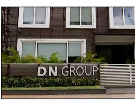
ଭୁବନେଶ୍ୱର, ୦୭/୦୭ (ନି.ପ୍ର): ଟିକସ ଫାଇଁକ୍ସ ଆଭିଯୋଗରେ ବ୍ୟବସାୟିକ