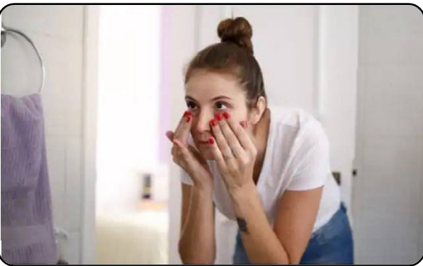
୫. ଡାର୍କ ସର୍କଲ୍ ଭଲ କରିବା ପାଇଁ ଓଜନ କମାଇବା ପାଇଁ ଚେଷ୍ଟା କରନ୍ତୁ ନାହିଁ । ଏଥିପାଇଁ ପୋଷିକ ଖାଦ୍ୟ ଖାଆନ୍ତୁ ଏବଂ ସ୍ୱାସ୍ଥ୍ୟ ସହିତ ତୃତୀୟ ମନ୍ତ୍ର ନିଅନ୍ତୁ ।

ସାଧାରଣତଃ ଆଖିତଳ ତୃତୀ କୋମଳ ହୋଇଥିବାରୁ କିଛି ଲୋକଙ୍କର ଏଥିରେ କଳାଦାଗ ବା ଡାର୍କ ସର୍କଲ୍ ସମସ୍ୟା ଦେଖାଦେଇଥାଏ । ତେଣୁ ଡାର୍କ ସର୍କଲ୍ ରକ୍ଷା ପାଇବା ପାଇଁ ଆପଣ ବଜାରରେ ଉପଲବ୍ଧ ହେଉଥିବା ବିଭିନ୍ନ କ୍ରୀମ୍, ସରୋଇ ଉପଚାର ଓ ଅଣ୍ଡର ଆଇ କ୍ରୀମ୍ ବ୍ୟବହାର କରିଥାନ୍ତୁ । ଏଥିପାଇଁ ବିଭିନ୍ନ ପ୍ରକାର ମେଡିସିନ୍ ନଖାଇ ପ୍ରଥମେ ସ୍ୱାସ୍ଥ୍ୟ ବିଶେଷଜ୍ଞଙ୍କ ସହିତ ପରାମର୍ଶ କରି ଡାର୍କ ସର୍କଲ୍ ହେବାର ମୂଳ କାରଣ ଜାଣିବା ନିହାତି ଆବଶ୍ୟକ । ତା'ହେଲେ ଆସନ୍ତୁ ଜାଣିବା ଏହି ଡାର୍କ ସର୍କଲ୍ କାହିଁକି ହୋଇଥାଏ ଏବଂ ଏଥିରୁ ରକ୍ଷା ପାଇବା ପାଇଁ କେଉଁସବୁ ଉପାୟ ଆପଣାନ୍ତୁ । ୧. ବୟସ ବଢ଼ିବା ସହିତ ଆଖିତଳର ଚର୍ମ କଳା ପଡ଼ିବାକୁ ଲାଗିଥାଏ । ଏଥିପାଇଁ ନିୟମିତ ଭାବରେ ଭଲ ସନସ୍କ୍ରିନ୍ ଲୋଶନ ବ୍ୟବହାର କରନ୍ତୁ । ୨. ପୋଷଣ ଅଭାବରୁ ମଧ୍ୟ ଡାର୍କ ସର୍କଲ୍ ହୋଇଥାଏ । ଶରୀରରେ ଆୟରନର ଅଭାବ ଥିଲେ ଏହାର ଯାଞ୍ଚ କରନ୍ତୁ ଏବଂ ଆୟରନଯୁକ୍ତ ଖାଦ୍ୟ ଖାଆନ୍ତୁ । ତିହାଇଡ୍ରୋସନ କାରଣରୁ ମଧ୍ୟ ଡାର୍କ ସର୍କଲ୍ ସମସ୍ୟା ଦେଖାଦେଇଥାଏ । ୩. ଆଇର-ଏଚ୍ ସମସ୍ୟା ଥିଲେ ଆଖିତଳ କଳାଦାଗ ଦେଖାଦେଇଥାଏ । ଏଥିପାଇଁ ଉଚିତ୍ ସମୟରେ ଏହାର ଚିକିତ୍ସା କରାନ୍ତୁ । ୪. ଆଲର୍ଜି ବା ଔଷଧ ଯୋଗୁଁ ମଧ୍ୟ ଡାର୍କ ସର୍କଲ୍ ହୋଇଥାଏ । ଉଚ୍ଚ ରକ୍ତଚାପ, ମଧୁମେହ ଓ ହାର୍ଟ ରୋଗୀ ଅଧିକ ମାତ୍ରାରେ ମେଡିସିନ୍ ଖାଆନ୍ଥାନ୍ତି । ଡାର୍କ ସର୍କଲ୍ ଏହାର ସାଇଡ୍ ଇଫେକ୍ଟ ଭାବରେ ଦେଖାଦେଇଥାଏ ।