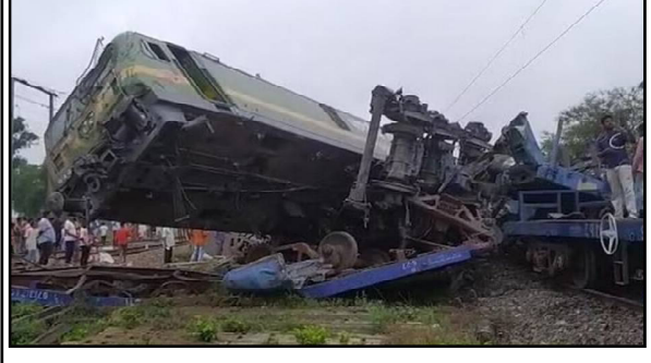
ପଶ୍ଚିମବଙ୍ଗ, ୨୫/୦୬ : ଭାରତୀୟ ରେଳବାଇର ପିଛା ଛାଡ଼ି ଦୁର୍ଘଟଣା। ଜୁନ ୨ ଓଡ଼ିଶାର ଟ୍ରେନ ଟ୍ରାକ୍‌ରେ ଏକାଧିକ ରେଳ ଦୁର୍ଘଟଣା ସାମ୍ବାଲ ଆଦିବାସୀ ଲାଗିଛି। ଏହିକ୍ରମରେ ଆଜି ପଶ୍ଚିମବଙ୍ଗର ବାଙ୍କୁରାରେ ପୁଣି ଦୁଇଟି ମାଲବାହୀ ଟ୍ରେନ ମଧ୍ୟରେ ଦୁର୍ଘଟଣା ଘଟିଛି। ରବିବାର ଭୋର ୪ଟାରେ ଦୁର୍ଘଟଣା ଘଟିଥିବା ବେଳେ ମାଲବାହୀ ଟ୍ରେନର ୧୨ଟି ବର୍ଗ ଲାଭନ ଚ୍ୟୁତ ହୋଇଯାଇଛି। ମିଳିଥିବା ସୂଚନା

ଅନୁସାରେ, ଦୁର୍ଘଟଣାଗ୍ରସ୍ତ ଦୁଇଟି ମାଲବାହୀ ଟ୍ରେନ ମଧ୍ୟରୁ ଗୋଟିଏ ଅନ୍ୟଟିକୁ ଧକ୍କା ପଡ଼ି ଧକ୍କା ଦେଇଥିଲା। ଫଳରେ ଦୁଇଟି ଯାକ ଟ୍ରେନ ଶ୍ଚିତ୍ରଗ୍ରସ୍ତ ହେବାର ସହ ୧୨ଟି ବର୍ଗ ଲାଭନ ଚ୍ୟୁତ ହୋଇଯାଇଛି। ଓଷା ଷ୍ଟେସନରେ ଦୁର୍ଘଟଣା ଘଟିଥିବାରୁ ଚଳେକ ସେବା ପ୍ରଭାବିତ ହୋଇଛି। ଦୁର୍ଘଟଣାରେ କିଛି ବଡ଼ ଅଘଟଣା ଘଟିବି। କିନ୍ତୁ ଗୋଟିଏ ମାଲବାହୀ ଟ୍ରେନର ଡ୍ରାଇଭର ସାମାନ୍ୟ ଆହତ ହୋଇଛନ୍ତି। ସବୁଠାରୁ ଗୁରୁତ୍ୱପୂର୍ଣ୍ଣ କଥା ହେଲା,