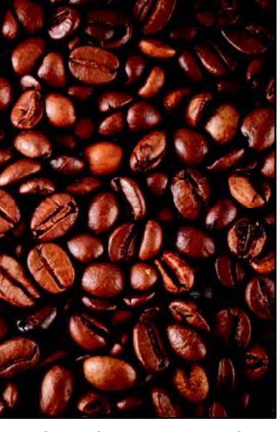
ନାମକରଣ କରିଥିଲେ କହାସ । ପରବର୍ତ୍ତୀ ସମୟରେ ଏହି ଶବ୍ଦଟିକୁ କର୍ମ ଏବଂ କାଫେ ଶବ୍ଦର ଉତ୍ପତ୍ତି ହୋଇଥିଲା । ଗରମ ଅନୁଭୂତ ଭ୍ୟାନିଲା, ସ୍ୱିସ ମୋଚା, ଭ୍ୟାନିଲା, ଚକୋଲେଟ୍, ମିଞ୍ଚ, ପିପରମିଞ୍ଚ, ପମ୍ପକିନ ସାଇସ୍ ଆଦି ସ୍ୱାଦଯୁକ୍ତ ଫ୍ଲେଣ୍ଡେଡ୍ କର୍ମ ପ୍ରସ୍ତୁତ ହୋଇଥାଏ ।

ତା ପସନ୍ଦ କରୁଥିବା ଲୋକଙ୍କ ସଂଖ୍ୟା ତ ଅଗଣିତ । ମାତ୍ର କର୍ମ ପସନ୍ଦ କରୁଥିବା ଲୋକଙ୍କ ସଂଖ୍ୟା ବି କିଛି କମ୍ ନୁହେଁ । ଦିନକୁ ଦିନ ବଢ଼ିଚାଲିଥିବା ଅର୍ଥସ୍ୱ କଲଚର୍ ଏବଂ ସ୍ୱାଦରେ ବିଭିନ୍ନତା ଆସୁଥିବାରୁ କର୍ମପ୍ରେମୀଙ୍କ ସଂଖ୍ୟା ବି ବୃଦ୍ଧି ପାଇଛି । ଏହି କ୍ରମରେ ଆସନ୍ତୁ ନଜର ପକାଇବା କର୍ମ ବିଷୟରେ ଆଉ କିଛି ରୋଚକ ତଥ୍ୟ ।