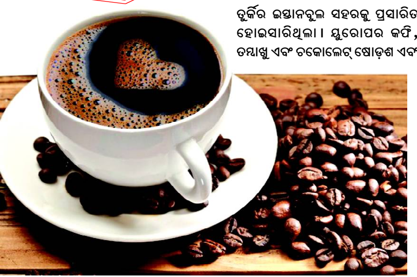
କର୍ମର ଇତିହାସ: ସପ୍ତଦଶ ଶତାବ୍ଦୀ ବେଳକୁ ଲୋକପ୍ରିୟ କର୍ମ ଗଛ ବର୍ଦ୍ଧିତ ହୋଇଥିଲା ଯାହାକି କର୍ମ ବାଷ୍ପ ହେବାକୁ ଲାଗିଲା । ପ୍ରଥମେ କର୍ମ ବାଷ୍ପ

ହେଉଥିବା ଲାଟିନ ଆମେରିକାର କେତେକ ଦେଶ ସମେତ କେତେକ ଆଫ୍ରିକାୟ ରାଷ୍ଟ୍ର ତଥା ଭିଏତନାମ ଓ ଇଣ୍ଡୋନେସିଆରେ ମଧ୍ୟ ଏହାର ଉତ୍ପାଦନ ହୋଇଥାଏ । ଭାରତର ମଧ୍ୟ କେତେକ ଉତ୍ପାଦନ ପୂର୍ବ ଭୂମିରେ ବୃଦ୍ଧି ପାଇଛି ।