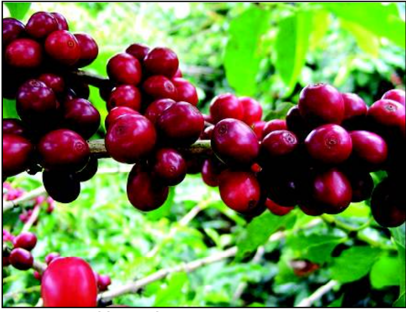
ନାମକ ଏକ ସ୍ଥାନରେ ମିଳିଥିଲା । କର୍ମକୁ ନେଇ ଅନେକ କିମ୍ବଦନ୍ତୀ ଅଛି । ସେମିତି ଏକ କିମ୍ବଦନ୍ତୀ ଅନୁସାରେ ଏକ ଅବସ୍ଥା ଅପରାଧରେ ଜଣେ ପଶୁପାଳକ ପ୍ରଥମଥର ପାଇଁ ଏହି ଗଛ ସଂସ୍ପର୍ଶରେ ଆସିଥିଲା । ସେ ଲକ୍ଷ୍ୟ କରିଥିଲା ଅତୀତ କାଳ ଓ ମେଘମାନେ ପୂର୍ବ ଭୂମିରେ ଅଧିକ ସମୃଦ୍ଧ ହୋଇଯାଇଛନ୍ତି । ଗାଈ ଓ ମେଘମାନେ ଏକ ବଡ଼ ଗଛ ତଳେ ପଡ଼ିଥିବା ଲାଲ ରଙ୍ଗର ଫଳକୁ ଖୁବ୍ ଖୁସିରେ ଖାଇ ଚାଲିଛନ୍ତି । ଖାଇବାର କିଛି ସମୟ ମଧ୍ୟରେ ସେମାନେ ପୂର୍ବ ଭୂମିରେ ଅଧିକ ଚଳଚଞ୍ଚଳ ହୋଇପାରୁଛନ୍ତି । ଏହା ଦେଖିବା ପରେ ସେ ନିଜେ କିଛି ମଞ୍ଜି ଚୋବାଇ ଦେଖିଥିଲା । ତାକୁ ମଧ୍ୟ ଲାଗିଥିଲା ପୂର୍ବ ଭୂମିରେ ନିଜକୁ ଖୁବ୍ ପୂର୍ବ ଅନୁଭବ କରୁଛି । ୧୪୧୪ ମସିହା ବେଳକୁ ମକ୍କା ମଧ୍ୟ କର୍ମ କାରଣରୁ ପରିଚିତ ହୋଇଯାଇଥିଲା ଏବଂ ପଞ୍ଚଦଶ ଶତାବ୍ଦୀ ଆରମ୍ଭରେ ଏହା ଯେମେନ ଭଳି ଦେଶକୁ ପହଞ୍ଚି ଯାଇଥିଲା । କିନ୍ତୁ ସେ ପର୍ଯ୍ୟନ୍ତ ଏହାକୁ କେବଳ ପୁଫି ସରୁମାନଙ୍କ ପାନାୟ ମଧ୍ୟରେ ହିଁ ସୀମିତ ରହିଯାଇଥିଲା । ୧୫୫୪ ମସିହା ବେଳକୁ ଏହା ସିରିଆ ଏବଂ

ସ୍ୱାଦ ଓ ସୁଗନ୍ଧ: ସ୍ୱାଦ ଓ ସୁଗନ୍ଧର ପ୍ରକାରଭେଦ ଅନୁସାରେ କର୍ମ ବିନ୍ଦୁ ରୁଚି ପ୍ରକାର-ଆରବିକା ଏବଂ ରୋବୋଷ୍ଟା । ଆରବିକା ବିନ୍ଦୁରେ ପ୍ରସ୍ତୁତ କର୍ମରେ ସ୍ୱାଦ ଓ ସୁଗନ୍ଧ ଉଚ୍ଚ ଖୁବ୍ ଅଧିକ । ସେମିତି ରୋବୋଷ୍ଟା ବିନ୍ଦୁରୁ ପ୍ରସ୍ତୁତ କର୍ମଟିକେ କଡ଼ା ସ୍ୱାଦର । କର୍ମ ପିଇଥିବା ଲୋକମାନଙ୍କ ପାଇଁ ଆରବିକା କି ସବୁ ଦୃଷ୍ଟିରୁ ଉପଯୁକ୍ତ । ଏହି କର୍ମ ସେଇସବୁ ଲୋକମାନଙ୍କ ପାଇଁ ଭଲ ଯେଉଁମାନେ ହାଲୁକା ଓ ଫ୍ଲେଉରସୁକ୍ତ କର୍ମ ପିଇବାକୁ ପସନ୍ଦ କରନ୍ତି । କିନ୍ତୁ ଲୋକମାନେ କର୍ମକୁ କାଫେନ୍ ବ୍ୟତୀତ ଅଲଗା ଏକ ଅନ୍ୟ ଆଶା କରନ୍ତି - ସେମାନଙ୍କ ପାଇଁ ରୋବୋଷ୍ଟା ଉପଯୁକ୍ତ । ଭାରତରେ ପ୍ରସ୍ତୁତ ହେଉଥିବା କର୍ମ ବିନସ ମଧ୍ୟରେ ମାଲବାର ମନସୁନ ଓ ଡାର୍ଡିଫରେଷ୍ଟ ଅନ୍ୟତମ । ଏହି କର୍ମରୁ ଆଲମଶ୍ୱ, ଏମେରେଟୋ, ଅରବିଶ କ୍ରିମ, ଫ୍ରେସ୍ ହୋଇଥାଏ ।