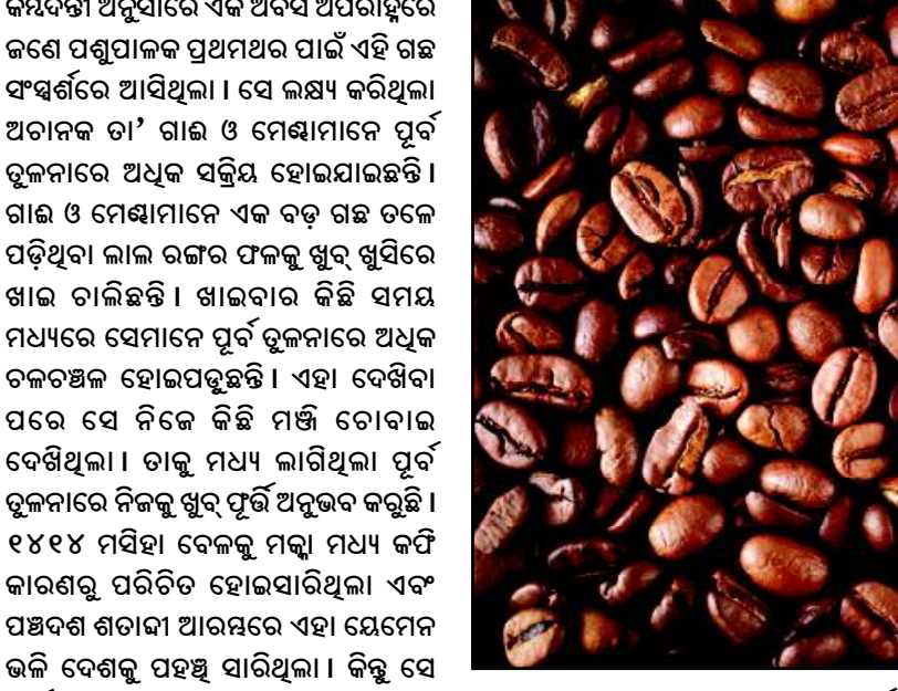
ନାମକରଣ କରିଥିଲେ କହାସ । ପରବର୍ତ୍ତୀ ସମୟରେ ଏହି ଶବ୍ଦଟିକୁ କର୍ମ ଏବଂ କାଫେ ଶବ୍ଦର ଉତ୍ପତ୍ତି ହୋଇଥିଲା । ଗରମ ଅନୁଭୂତ ଭ୍ୟାନିଲା, ସ୍ୱିସ ମୋଚା, ଭ୍ୟାନିଲା, ଚକୋଲେଟ୍, ମିଞ୍ଚ, ପିପରମିଞ୍ଚ, ପମ୍ପକିନ ସାଇସ୍ ଆଦି ସ୍ୱାଦଯୁକ୍ତ ଫ୍ଲେଣ୍ଡେଡ୍ କର୍ମ ପ୍ରସ୍ତୁତ ହୋଇଥାଏ ।

ଯେମେନରେ ହେଉଥିଲା ଏବଂ ଯେମେନର ଲୋକମାନେ ହିଁ ଆରବୀ ଭାଷାରେ ଏହାର ଅନ୍ୟତମ । ଏହି କର୍ମରୁ ଆଲମଶ୍ୱ, ଏମେରେଟୋ, ଅରବିଶ କ୍ରିମ, ଫ୍ରେସ୍ ହୋଇଥାଏ ।