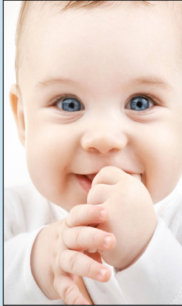
ପାଇଁ ବେଷ୍ଟ ପ୍ରକୃତ କିଣିବାବେଳେ ଆପଣଙ୍କୁ ଠିକ୍ ଅଧିକ ଯତ୍ନଶୀଳ ହେବାକୁ ପଡ଼ିବ । ଯଦି ଆପଣ ଜାଣିପାରୁନାହାନ୍ତି କେଉଁଟି ଆପଣଙ୍କ ପାଇଁ ଠିକ୍ ତେବେ କୌଣସି ଚର୍ମାଚାର୍ଯ୍ୟକର୍ତ୍ତାଙ୍କୁ ଉପଦେଶ ନିଅନ୍ତୁ ।

■ ଶିଶୁର ହୃତାକୁ ଆଦୌ ଶୁଷ୍କ ହେବାକୁ ଦିଅନ୍ତୁନି । ମାର୍କେଟରେ ଉପଲବ୍ଧ ହେଉଥିବା ଦେବି ମଧ୍ୟସ୍ତରାଜିକା କ୍ରିମ ଆପ୍ଲୁଏ କରନ୍ତୁ । ଶିଶୁ