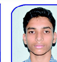
LALKRUSHNA S.B.B. MEDICAL COLLEGE BOLANGIRI