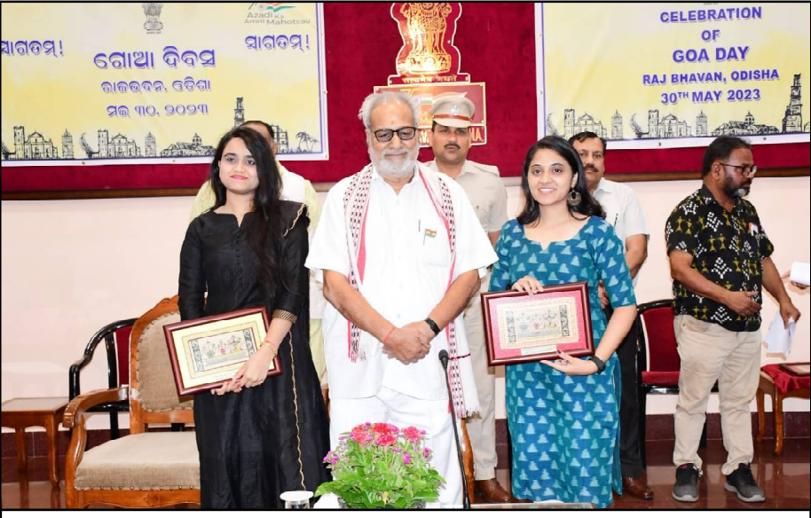
ରାଜଭବନରେ ଗୋଆ ଦିବସ ପାଳିତ