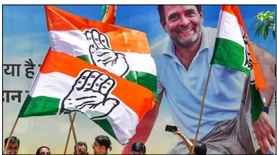
କଂଗ୍ରେସ: ୧୩୬ || ବିଜେପି: ୬୫ || ଜେଡିଏସ୍ ୨୦

କର୍ଣ୍ଣାଟକ, ୧୩/୦୫ : କର୍ଣ୍ଣାଟକରେ କଂଗ୍ରେସର ବିଜୟ ପୂର୍ତ୍ତୀ ଦଳ ଭିତରେ ଭରି ଦେଇଛି ସଂଘିବନୀ । ବେଙ୍ଗାଲୁରୁ ଦିଲ୍ଲୀ ପର୍ଯ୍ୟନ୍ତ ଉତ୍ତର ମୁଖର ହୋଇପଡିଛନ୍ତି ଦଳୀୟ ନେତାଠାରୁ କର୍ମୀ । ନୂଆ ଉତ୍ତର ଓ ଉତ୍ତରୀୟ ଭରି ଯାଇଛି କଂଗ୍ରେସ ଶିବିରରେ । ଏହି ବିପ୍ଳବ ବିଜୟ ପରେ କଂଗ୍ରେସର ବରିଷ୍ଠ ନେତା ରାହୁଲ ଗାନ୍ଧୀ କହିଛନ୍ତି, 'ପୁଣ୍ୟାଳୟ ବନ୍ଦ ହେଲା, ଖୋଲିଲା ଭଲ ପାଦବାର ଦୋକାନ ।' କର୍ଣ୍ଣାଟକରେ କଂଗ୍ରେସର ପଲ୍ଲୀ ଭାରି ଥିବା ସମସ୍ତଙ୍କୁ ଜଣାଥିଲା । ଏଥିପାଇଁ ପ୍ରଧାନମନ୍ତ୍ରୀ ନରେନ୍ଦ୍ର ମୋଦୀଙ୍କ ଠାରୁ ଆରମ୍ଭ କରି ଅମିତ ଶାହାଙ୍କ ପର୍ଯ୍ୟନ୍ତ ନିର୍ବାଚନ ପ୍ରଚାରରେ ଜୋର ଲଗାଇ