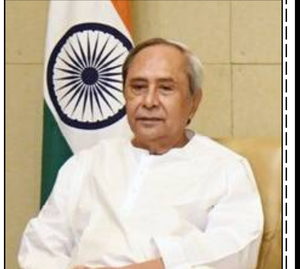
ଆମ ରାଜ୍ୟ ବିରୋଧରେ କାମ କରୁଛନ୍ତି ବୋଲି ସୂଚିବାକୁ ହେବ । ମା' ଓ ►ପୃଷ୍ଠା ୭

ଝାରସୁଗୁଡ଼ା, ୧୩/୦୫ (ନି.ପ୍ର): ଝାରସୁଗୁଡ଼ା ଉପନିର୍ବାଚନରେ ବିଜେଡିର ବିଜୟ ପରେ ବିରୋଧୀଙ୍କୁ କଡ଼ା ସମାଲୋଚନା କରିଛନ୍ତି ଦଳୀୟ ସୁପ୍ରିମୋ ତଥା ମୁଖ୍ୟମନ୍ତ୍ରୀ ନବୀନ ପଟ୍ଟନାୟକ । ଭୁବନେଶ୍ୱର ଶଙ୍ଖ ଭବନରେ ସେ ଝାରସୁଗୁଡ଼ା ବିଜୟ ଉତ୍ସବରେ ଯୋଗଦେଇ ସେ କହିଛନ୍ତି, ସିଙ୍ଗଲ ଇଞ୍ଜିନ ନୁହେଁ ଦୁଇ-ଇଞ୍ଜିନ ଗୁରୁତ୍ୱପୂର୍ଣ୍ଣ ନୁହେଁ । ଲୋକଙ୍କ ଦୃଷ୍ଟିରେ ସରକାର ଗୁରୁତ୍ୱପୂର୍ଣ୍ଣ । ଗୁରୁ ଗଭର୍ଣ୍ଣାଣ୍ଡ ଓ ପ୍ରୋ ପିପୁଲ ଗଭର୍ଣ୍ଣାଣ୍ଡ ସବାବେଳେ ଜିତେ । ସେହିମାନେ ଓଡ଼ିଶାରେ ଲୋକଙ୍କୁ ଅସମ୍ମାନ କରିବେ ଓ ସେମାନଙ୍କୁ ଲ' ଲେସ୍ କୁହାଯିବ । ସେମାନେ