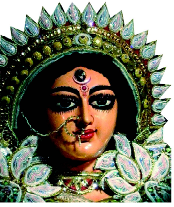
ସ୍ତ୍ରୀ ଦେବୀ ସର୍ବଭୂତେଷୁ.....

website : www.dhwanipratidhwani.net email: pratidhwani.dhwani@gmail.com