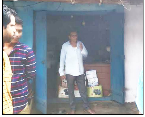
ପୋଲିସ ବିଭାଗର କୌଣସି ହୋମଗାର୍ଡ କିମ୍ବା ଅନ୍ୟ ପେଟ୍ରୋଲିଂ କର୍ମଚାରୀ ନଥିବାର ସୁଯୋଗ ନେଇ ଚୋରି ହୋଇଥିବା ସୂଚନା ମିଳିଛି ।