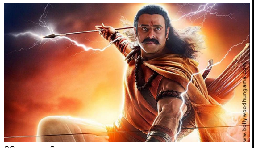
ବିଭିନ୍ନ ଭାଷାରେ ସିନେମା ଜୁନ୍ ୧୬ରେ ସାରା ବିଶ୍ୱରେ ରିଲିଜ୍ ହେବ । ୫୦୦ କୋଟିରେ ନିର୍ମିତ 'ଆଦିପୁରୁଷ'ରେ ଆଉ ୧୦୦ କୋଟି ବିନିଯୋଗ କରାଯାଇ ଠରଡ଼କୁ ବଦଳା ଯାଇଥିଲା । ହଲିଉଡ଼ ଫିଲ୍ମ ଶୈଳୀରେ ପ୍ରସ୍ତୁତ ହୋଇଛି ଏହି ବିଗ୍ ବଜେଟ୍ ଫିଲ୍ ।