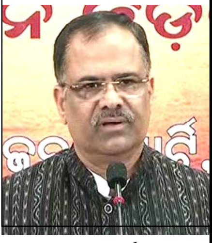
ପ୍ରକୃତ ଭବ ହୋଇଥିଲେ କାର୍ଯ୍ୟାନୁଷ୍ଠାନ ନିଅନ୍ତୁ ସରକାର ।