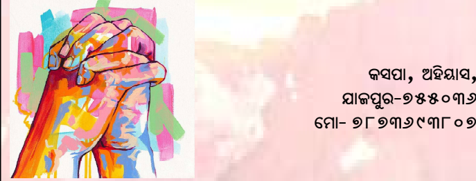
କବିପା, ଅଭିଯାସ, ଯାକପୁର-୭୫୫୦୩୭ ମୋ- ୭୮୭୩୭୯୩୮୦୭

ଏ ମାଟି ଛୁଆଁଇ କପାଳରେ ଥରେ କେତେଥେ ଭାବନା ଆସେ ବାରି ଅଛୁ ଆମେ ଦେଖ ଜାତି ପାଇଁ ପରାଣ ଦେବାକୁ ହସେ । (୦)