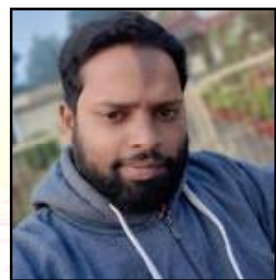
ମୁଁ ତୋ ଅପେକ୍ଷାରେ ଦୁଃଖୀ ବ୍ରାହ୍ମଣୀର ତାରେ ବନ୍ଧବର ଅପରାଧରେ...

ଏମିତି ହୁଅନ୍ତାନି, ପୁଣି ଆମେ ଫେରିଯା'ବେ ସେଇ ଦୁର୍ଗମ ଅତୀତକୁ ସେ ପ୍ରେମ ନଇ ଧାରକୁ ବ୍ରାହ୍ମଣୀର କୋଳକୁ, ଠିକ୍ ଯେମିତି କିଛି ବର୍ଷ ତଳେ ହାତରେ ହାତକୁ ଛନ୍ଦି ନୀରବ ନିଶ୍ଚଳ ହେଇ ବ୍ରାହ୍ମଣୀ କୁଳ ପଥରେ ବସି ଆମେ ହଜି ଯାଉଥିଲେ କଞ୍ଚନାର ରାଜକରେ