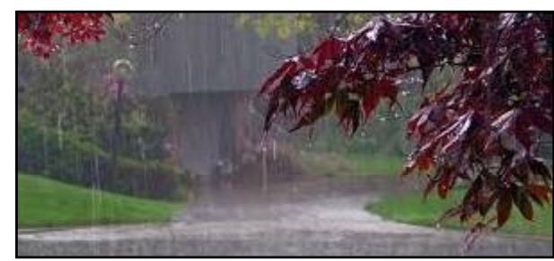
ବିଭିନ୍ନ ଉପକୂଳ ସହ ବର୍ଷା ଝଡ଼ବର୍ଷା ହେବ ବୋଲି ପୂର୍ବାନୁମାନ କରିଛି ପାଣିପାଗ ବିଭାଗ । ଏଥିପାଇଁ ଏସକ୍ସ୍ ଜିଲ୍ଲାକୁ ଯୋଲେ ଘୂର୍ଣ୍ଣି କାରି କରାଯାଇଛି । ଗତକାଳି ରାଜ୍ୟରେ ବିଭିନ୍ନ ଅଞ୍ଚଳରେ ପ୍ରବଳ ବର୍ଷା ଦେଖାଯାଇ ମିଳିଥିଲା । ଉପକୂଳ ଓଡ଼ିଶା ସହ, କୋରାପୁଟ ଏବଂ ଭୁବନେଶ୍ୱର ରେ ମଧ୍ୟ ବର୍ଷାର ପ୍ରଭାବ ଦେଖିବାକୁ ମିଳିଥିଲା ।

ଭୁବନେଶ୍ୱର, ୧୯/୦୩ (ନି.ପ୍ର) : ଆଜି ଉପକୂଳ ଓଡ଼ିଶାରେ ଘଟପତି ସହ ବର୍ଷା ହେବାର ସମ୍ଭାବନା ରହିଛି । ଉପକୂଳ ତଥ୍ୟ ସଂଲଗ୍ନ ଓଡ଼ିଶାରେ କାଳବୈଶାଖୀ ବର୍ଷା ସମ୍ଭାବନା ରହିଥିବା ବେଳେ ୪୦ରୁ ୫୦ କିଲୋମିଟର ବେଗରେ ପବନ ବହିବ ବୋଲି ପାଣିପାଗ ବିଭାଗ ଆକଳନ କରିଛି । ବିଶେଷକରି ଭଦ୍ରକ, ବାଲେଶ୍ୱର, ଯାଜପୁର, କଟକ, ଜଗତସିଂହପୁର, ପୁରୀ, ଖୋର୍ଦ୍ଧା, ନୟାଗଡ଼, ଗଞ୍ଜାମ, ଗଜପତି ଓ ଅନୁଗୁଳ ଆଦି ଜିଲ୍ଲାରେ ପ୍ରଭାବ ଦେଖାଯିବ ।