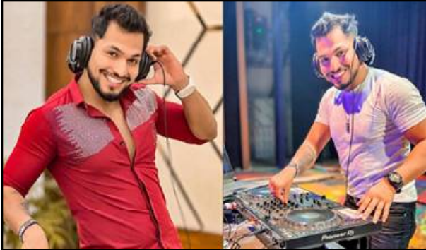
ସେମାନଙ୍କୁ ଚର୍ଚ୍ଚା ପରିସର ଭୁକ୍ତ କରାଯିବ । ସେ କହିଛନ୍ତି ଯେ ପ୍ରାଥମିକ ଚର୍ଚ୍ଚାରୁ ମାନସିକ ଚାପରୁ ଆମ୍ଭତ୍ୟା ଜଣାପଡ଼ିଛି । ପୋଷ୍ଟମର୍ଟମ ରିପୋର୍ଟ ଓ ଡିଜିଟାଲ ପ୍ରମାଣ ଆଧାରରେ ଚର୍ଚ୍ଚା ହେବ ବୋଲି ସେ କହିଛନ୍ତି ।