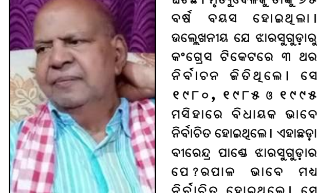
ଝାରସୁଗୁଡ଼ର ପୂର୍ବତନ ବିଧାନ ସଭା ସଭ୍ୟଙ୍କୁ ପରଲୋକ ଦେହାନ୍ତ ହୋଇଯାଇଛି । ଆଜି ଭୋରରେ ଭୁବନେଶ୍ୱରର ଏକ ଘରୋଇ ଚାକର ଖାତାରେ ତାଙ୍କର ପରଲୋକ ହୋଇଥିଲା ।

ଭୁବନେଶ୍ୱର, ୧୯/୦୩ (ନି.ପ୍ର) : ଝାରସୁଗୁଡ଼ର ପୂର୍ବତନ ବିଧାନ ସଭା ସଭ୍ୟଙ୍କୁ ପରଲୋକ ଦେହାନ୍ତ ହୋଇଯାଇଛି । ଆଜି ଭୋରରେ ଭୁବନେଶ୍ୱରର ଏକ ଘରୋଇ ଚାକର ଖାତାରେ ତାଙ୍କର ପରଲୋକ ହୋଇଥିବା ଜଣାପଡ଼ିଛି । ସେ ଯକୃତ ରୋଗରେ ପୀଡ଼ିତ ଥିଲେ । ତାଙ୍କର ବିଶେଷତା ଅନେକ ମାନସଗଣ୍ୟ ଲୋକ ଶୋକ ପ୍ରକାଶ କରିଛନ୍ତି । ୧୯୪୮ ମସିହାରେ