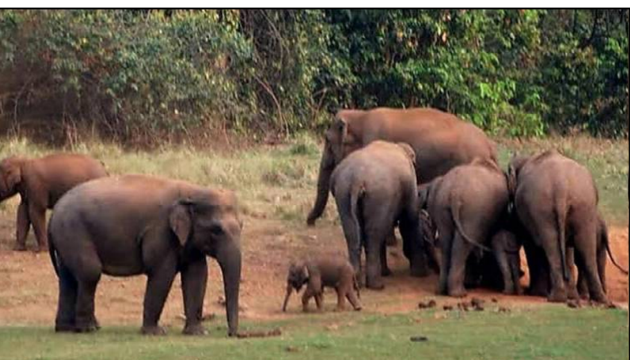
୨୦୧୦ର ଧାରା ୨୬ ଅନୁସାରେ ଉତ୍ତମ ବିରୋଧରେ କାର୍ଯ୍ୟକାରୀ ନିପୋର୍ତ୍ତ ବାଖଳ କରାଯିବ ବେଳେ କାରଣ ଦର୍ଶାବାକୁ (ପିସିସିଏଫ୍) ଓ ମୁଖ୍ୟ ବନ୍ୟପ୍ରାଣୀ

କଟକ, ୧୭/୦୩ (ନି.ପ୍ର): ହାତୀ କରିଡର ପ୍ରଫର୍ମରେ ୨୦୨୧ ଅଗଷ୍ଟ ୧୭ରେ ପ୍ରଦାନ କରାଯାଇଥିବା ନିର୍ଦ୍ଦେଶକୁ କାର୍ଯ୍ୟରେ ସରକାର କାର୍ଯ୍ୟକାରୀ କରି ନଥିବାରୁ ଜାତୀୟ ଗ୍ରିନ୍ ଡ୍ରୁନାଲ (ଏନଜିଠି) ଅସନ୍ତୋଷ ବ୍ୟକ୍ତ କରିଛନ୍ତି । ତୁଳନାତ୍ ଭିତରେ ନିର୍ଦ୍ଦେଶ କାର୍ଯ୍ୟକାରୀ କରି ନିପୋର୍ତ୍ତ ବାଖଳ କରାଯିବା ପାଇଁ କୁହାଯାଇଥିଲା । କିନ୍ତୁ ଉପରୋକ୍ତ ୨୦୨୩ ମାର୍ଚ୍ଚ ମାସ ହୋଇ ସାରିଥିଲେ ମଧ୍ୟ ଏ ପର୍ଯ୍ୟନ୍ତ ରାଜ୍ୟ ସରକାର ନିର୍ଦ୍ଦେଶ କାର୍ଯ୍ୟକାରୀ ନିପୋର୍ତ୍ତ ବାଖଳ କରି ନାହାନ୍ତି । ଏହା ପରିତାପର ବିଷୟ ବୋଲି ଏନଜିଠି କହିବା ସହିତ ପ୍ରମୁଖ ମୁଖ୍ୟ ବନ୍ୟପ୍ରାଣୀ (ପିସିସିଏଫ୍) ଓ ମୁଖ୍ୟ ବନ୍ୟପ୍ରାଣୀ ଓଡ଼ିଶାକୁ ନୋଟିସ୍ ଜାରି କରି ବ୍ୟକ୍ତିଗତ ବନ୍ୟପ୍ରାଣୀ ବାଖଳ ପାଇଁ ନିର୍ଦ୍ଦେଶ ଦେଇଛନ୍ତି । ଜାତୀୟ ଗ୍ରିନ୍ ଡ୍ରୁନାଲ ଆଇନ,