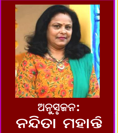
ଅନୁସୃଜନ: ନନ୍ଦିତା ମହାନ୍ତି

ଗାଁରେ ଗାଁ-ସରପଞ୍ଚ ନିର୍ବାଚନର ସମୟ ଆସି ଯାଉଥିଲା । ସତ କଥା କହିବାକୁ ଗଲେ, ଗାଁର ଭଡ଼ିଆସରେ ପ୍ରଥମ ଥର ପାଇଁ ନିର୍ବାଚନ ହେବାକୁ ଯାଉଥିଲା । ଦୁଇ ବଳ ସାମନାସାମ୍ନି ଥିଲେ । ଗୋଟେ ପଟେ ଥିଲେ ବେପାରୀ ଓ ଆଜି ଯାଏଁ ସରପଞ୍ଚ ସଦ ଉପରେ କଳ୍ପା କରି ରଖୁଥିବା ଦଳ ଓ ଅନ୍ୟପଟେ ଥିଲେ ବିରୋଧୀ ଦଳ । ଆମମାନଙ୍କର ସମର୍ଥନ ବିରୋଧୀ ଦଳ ପାଇଁ ଥିଲା । ଆମେ ଥିବା ସବୁ କାର୍ଯ୍ୟ ଗ୍ରାମପଞ୍ଚାୟତ ନିର୍ବାଚନା ସ୍ତୋତ୍ରରେ ଭରି ଯାଉଥିଲା । ଆମେ ଥିଲେ ବିରୋଧୀ ଦଳ ହିଁ ନିର୍ବାଚନରେ ଜୟସୂତ୍ର ହୋଇଥିଲା । ସାଭାବିକ ଭାବରେ ତାଙ୍କର ସବୁ ରାଗ ମୋ ଉପରେ ହିଁ ଥିଲା । ଶୁଣ୍ଠ ପୁଠ ବିଳୁଳା ସୁବିଧାକୁ କେବଳ ଆମରି ଘରକୁ ବହୁତ କରାଯାଉଥିଲା । ବାକି ସବୁ ଘର ବିଳୁଳା ଆଲୋକରେ ଚିକ୍ଚିକି କରୁଥିଲା । ଖାଲି ଯାହା ଆମରି ଘର ଅନ୍ତରରେ ଚୁଡ଼ି ରହିଥିଲା । ପଡ଼ୋଶୀ ଘରର ବିଳୁଳା ତାରକୁ ହୁକ୍ ପକେଇ ମାଆ ବିଳୁଳି ନେଇଥିଲା । ଶେଷରେ ବକା ପଠଠ କରି ଆମ ଘର ପାଇଁ ଅଲଗା ମିତର ଓ ବିଳୁଳି କନେକସନ୍ ନେଲା । ଚା'ପରେ ମୋର ବିରୋଧୀମାନଙ୍କ ସହିତ ଥିବା ସମ୍ପର୍କକୁ ସିଏ ସୁଧାରି ନେଇଥିଲା । (କୁମରୀ)