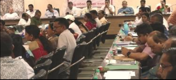
ନେଇ ଜିଲ୍ଲା ପରିଷଦ ସଦସ୍ୟମାନେ ଦୀର୍ଘ ସମୟଧରି ଆଲୋଚନା କରିଥିଲେ । ବିଶେଷ କରି ଜିଲ୍ଲାରେ ଲାଗି ରହିଥିବା ଶିକ୍ଷକ କର୍ମଚାରୀ ଅଭାବ ଓ ଭିତ୍ତିଭୂମି ବିକାଶ ସମସ୍ୟା ସାଙ୍ଗକୁ ରୂପାନ୍ତରଣ ଆଳରେ ୫-ଟି ସ୍କୁଲରେ ଚାଲିଥିବା ସରକାରୀ ଅର୍ଥ ଆବୁସାତକୁ ନେଇ ବୈଠକରେ ଅଭିଯୋଗ ଉଠିଥିଲା । ବାହାନଗା ବୁଦ୍ଧର ୧୬ଟି ବିଦ୍ୟାଳୟର ରୂପାନ୍ତରଣ କାର୍ଯ୍ୟ କରୁଥିବା ବନ୍ଧୁ ଓ ମୂଳ ନିଜ ଇଚ୍ଛାଦ୍ୱାରା କାର୍ଯ୍ୟ କରୁଥିବା ସଦସ୍ୟମାନେ ଆରୋପ କରିଥିଲେ । ଏ ବାବଦରେ ଜିଲ୍ଲା ଶିକ୍ଷାଧିକାରୀଙ୍କୁ ପଚରାଯିବାରେ ସେ