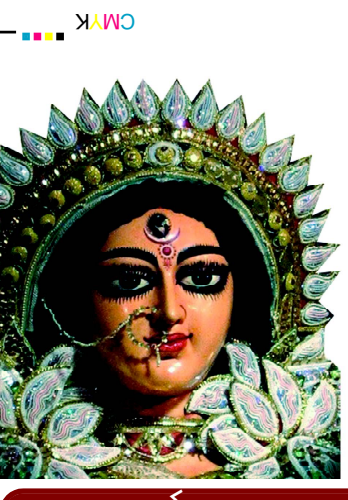
ସ୍ତ୍ରୀ ଦେବୀ ସର୍ବଭୂତେଷୁ.....

website : www.dhwanipratidhwani.net email: pratidhwani.dhwani@gmail.com