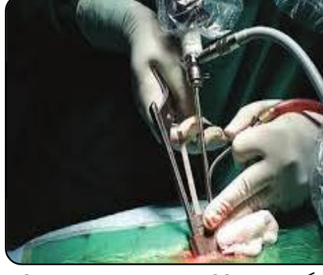
ଏହି ଅସ୍ତ୍ରୋପଚାର ବେଳେ ଏକ ସେଣ୍ଟିନିଟର ବ୍ୟାସାର୍ଦ୍ଧର ଛୋଟ କଣା କରାଯାଏ । ୨୫ମିନିଟ୍ ମଧ୍ୟରେ ଅସ୍ତ୍ରୋପଚାର ବେଳେ ଏକ ସେଣ୍ଟିନିଟର ବ୍ୟାସାର୍ଦ୍ଧର ଛୋଟ କଣା

କରାଯାଏ । ୨୫ମିନିଟ୍ ମଧ୍ୟରେ ଅସ୍ତ୍ରୋପଚାର ଶେଷ ହେବା ସହ ମାତ୍ର ୧୦ମିନିଟ୍ ଉକ୍ତ କ୍ଷୟ ହୁଏ । ଅସ୍ତ୍ରୋପଚାରର ଦୁଇପାଖ ପରେ ରୋଗୀ ଚାଲିପାରେ । ହସପିଟାଲରେ ଦୁଇ ଦିନ ରହିବାକୁ ପଡ଼େ ଏବଂ ସାତଦିନ ମଧ୍ୟରେ ରୋଗୀ କାମରେ ଯୋଗଦେଇପାରନ୍ତି । ଏହି ଅସ୍ତ୍ରୋପଚାର ସମୟରେ ସ୍ପଷ୍ଟମାକାଣ୍ଡୁ ବାହାରିଥିବା ସ୍କାଫ୍ଟକୁ ଅଲଗା କରି ରଖିବା ଲାଗି ସ୍ପନ୍ଡିଲ୍ ଭାବେ ଏକ ଯନ୍ତ୍ର ରହିଛି । ଏହା ଏକ ଅତି ସୂକ୍ଷ୍ମ ଚେଲିକୋପିକ ଯନ୍ତ୍ର ଭଳି ଆଗରୁ ଅସ୍ତ୍ରୋପଚାର ବେଳେ କେତେକ କ୍ଷେତ୍ରରେ ଉନ୍ନତମାନଙ୍କରେ ରହିଥିବା ସ୍ପନ୍ଡିଲ୍ କାଟି ହୋଇଯାଉଥିଲା । ଫଳରେ ରୋଗୀଙ୍କ ପାଇଁ ସ୍ପିନ୍ଡିଲ୍ ଫ୍ରେକ୍ଚର, ଏବଂ ପରାଲିସିସ୍ ହେବାର ଆଶଙ୍କା ଦେଖାଯାଏ । ଏହାକୁ ପୁରୁଣୁ ବୋଲି କହନ୍ତି ଏବେ ଅତ୍ୟାଧୁନିକ ଯନ୍ତ୍ରରେ ଅସ୍ତ୍ରୋପଚାର ଦ୍ଵାରା ଏହି ଆଶଙ୍କା ଏଡ଼ାଯାଇପାରିଛି । ଏଥିସହିତ ସେକ୍ସୁଆଲ୍ ଡିସ୍ ଫାରେନୋମାଲିଟି, ଫୋରାଲ୍ ଡିସ୍, ଫୋରାଲ୍ ଡିସ୍ ଆଦି ରୋଗ ସହଜରେ ଚିକିତ୍ସା କରାଯାଇପାରେ । ଏହି ଯନ୍ତ୍ର ଦ୍ଵାରା ବାମ ପାଖରେ ପଶି ଡାହାଣ ପାଖକୁ ଭିତରେ ଭିତରେ ଯାଇ ଲାମିନା ବା ଫେସ୍ଟେଲ୍ ବୟସକଳିତ ହାଡ଼ର ଅଧିକ ଦୃଷ୍ଟି ହାଲପରୁ ଲିଗାମେଣ୍ଟ ମଧ୍ୟ ସଫା କରିହୁଏ । ଏହି ଅସ୍ତ୍ରୋପଚାର ସାଧାରଣ ଅସ୍ତ୍ରୋପଚାରଠାରୁ କମ ସମୟ ଓ କମ ଖର୍ଚ୍ଚରେ ହୋଇଥାଏ ।