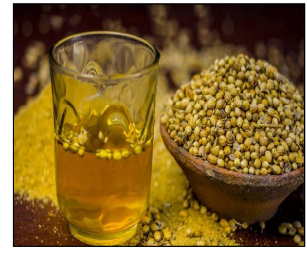
ଧନିଆ ଏହାକୁ ଫୁଟାନ୍ତୁ । ଗର୍ମରେ ଏହାକୁ ଛାଣି ପିଅନ୍ତୁ । ସାଧାରଣତଃ ଗର୍ମରେ ମହିଳାମାନେ ଏହି ପାଣିକୁ କମ୍ ପିଇବା ଭଳିତ ବୋଲି ବିଶେଷଜ୍ଞମାନେ ମତ ଦିଅନ୍ତି ।

ପ୍ରତିଦିନ ସକାଳେ ଧନିଆ ପାଣି ପିଇବା ଦ୍ଵାରା କେବଳ ଆଇରଏଡ୍ ଲକ୍ଷଣ କମ୍ ହୁଏ ନାହିଁ ବରଂ ଆପଣଙ୍କ ସ୍ଵାସ୍ଥ୍ୟର ସମ୍ବୃଦ୍ଧି ମଧ୍ୟ ଠିକ୍ ରହିଥାଏ । ଧନିଆ ପାଣି ରୋଗ ପ୍ରତିରୋଧକ ଶକ୍ତି ବଢ଼ାଇଥାଏ । ଆଇରଏଡ୍ ସାମାନ୍ୟ କରିଥାଏ । ଏଥିରେ ଥିବା ଆଣ୍ଟିଅକ୍ସିଡାଣ୍ଟ ଶରୀରରେ ଫ୍ରି ରେଡିକାଲସ୍ ହ୍ରାସ କରିବାରେ ସାହାଯ୍ୟ କରେ । କେଶ ପାଇଁ ମଧ୍ୟ ଏହା ଉତ୍ତମ । ଏଥିରେ ଭିଟାମିନ୍ କେ, ସି ଏବଂ ଏ ଭରପୁର ମାତ୍ରାରେ ରହିଥାଏ । ଏହି ଭିଟାମିନ୍ କେଶକୁ ମଜବୁତ କରିବା ସହ ଦୃଷ୍ଟି କରିବାରେ ମଧ୍ୟ ସାହାଯ୍ୟ କରନ୍ଥାଏ । ପ୍ରତିଦିନ ସକାଳେ ଧନିଆ ପାଣି ପିଇବା ପ୍ରକାରୀ ଖାଦ୍ୟ କେଶ ଡେବା ଏବଂ ଛିଡିବା ଭଳି ସମସ୍ୟା କମ ହୋଇଥାଏ । ଆଇରଏଡ୍ ଲକ୍ଷଣ ଥିବା ବ୍ୟକ୍ତିଙ୍କ ପାଇଁ ଏହା ରାମବାଣ ସଦୃଶ କାମ କରିଥାଏ ବୋଲି କୁହାଯାଏ । ରିପୋର୍ଟ ଅନୁଯାୟୀ ଆଇରଏଡ୍ ରୋଗୀଙ୍କ ପାଇଁ ଧନିଆ ଜଳ ବେଶ୍ ଲାଭଦାୟକ ହୋଇଥାଏ । ଏହା ଶରୀରକୁ ବିଷାକ୍ତ ପଦାର୍ଥ ବାହାର କରିବାରେ ସାହାଯ୍ୟ କରେ । ଧନିଆରେ ଥିବା ଆଣ୍ଟିଅକ୍ସିଡାଣ୍ଟ ଫ୍ରି ରେଡିକାଲ୍ ହ୍ରାସ କରିଥାଏ ଯାହା ଶରୀରର ଓଜନ ହ୍ରାସ କରିବାରେ ମଧ୍ୟ ସହାୟକ ହୋଇଥାଏ । ଏହାକୁ ପ୍ରସ୍ତୁତ କରିବା ପାଇଁ ଏକ ଗରମ ଧନିଆ ମାତ୍ରିକୁ ପାଣିରେ ୫ ମିନିଟ୍ ଫୁଟାନ୍ତୁ । ପାଣି ଥିବା ହେବା